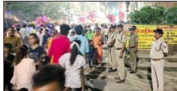
रेलवे फाटक से जाम हटवाती रेलवे पुलिस।

भरवारी कौशांबी। नगर पालिका भरवारी के रेलवे फाटक के पास प्रतिदिन जाम की समस्या से स्थानीय लोग जूझते हैं रेलवे फाटक घंटों बंद रहता है जिससे फाटक के दोनों ओर लंबा जाम लग जाता है और जाम के चलते आम जनता मुसीबत झेलती है शुक्रवार को फिर भरवारी रेलवे स्टेशन के रेलवे फाटक पर भीषण जाम लग गया फाटक के दोनों ओर सैकड़ों वाहन जाम में फंस गए फाटक खुलने के बाद भी वाहन चालकों को निकलने में दिक्कतें हो रही थी जिस पर आरपीएफ के