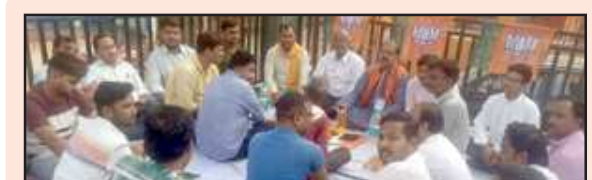
भाजपा के बैठक में उपस्थित नेता।

मुकदमा पेट्रोल पंप संचालक पर दर्ज किए जाने की मांग की है यह अकेला पेट्रोल पंप नहीं है जिले के लगभग अधिकतर पेट्रोल पंप में नाप के समय डीजल पेट्रोल कम दिया जा रहा है आम जनमानस के साथ अधिकारी और नेता के वाहनों में भी पेट्रोल भरवाने के समय नाप कम दिया जाता है जिससे नेता अधिकारी भी पेट्रोल पंप में लूटे जा रहे हैं लेकिन शिकायत के बाद योगी सरकार और उनके अधिकारी पेट्रोल पंप की जांच कर पंप के खिलाफ मुकदमा दर्ज कराए जाने और उनको सीज करते ते नहीं दिख रहे हैं