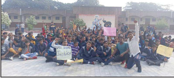
दूसरे दिन भी नवोदय स्कूल में धरना देते छात्रगण।