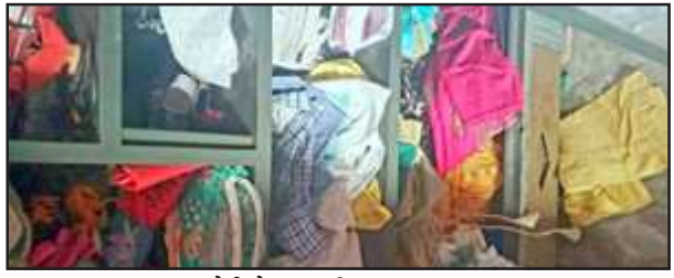
चोरी के बाद बिखरा पड़ा समान।

कोखराज थाना क्षेत्र में चोर गिरोह के सदस्यों के हासिल बुराद है गिरोह के सदस्य आए दिन घटनाओं को अंजाम दे रहे हैं खुलासे के नाम पर पुलिस लकीरें पीटती रह जाती है किसी भी घटना का खुलासा पुलिस नहीं कर पा रही है बीती रात फिर एक घर के दरवाजे का ताला तोड़कर भीतर घुसे चोर लाखों रुपए कीमत के सोने के जेवर और नकदी उठा ले जाने में सफल रहे हैं पूर्व की घटनाओं के खुलासे पुलिस नहीं कर सकी है जिससे क्षेत्र के लोगों का पुलिस से खुलासे के प्रति विश्वास उठता जा रहा है।