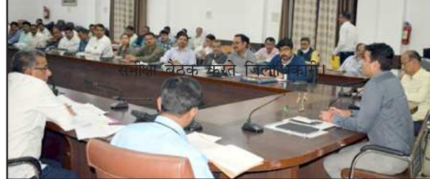
समीक्षा बैठक करते जिलाधिकारी।