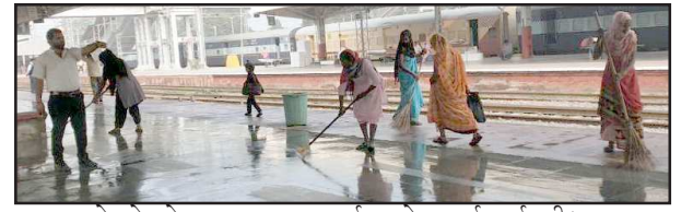
रेलवे स्टेशन पर साफ सफाई करते सफाई कर्मचारी।

आरोप लगाया। सूचना पर पहुंचे एसडीएम, सीओ के साथ गौरीगंज के प्रधानाचार्य ने छात्रों को मनाने का प्रयास करते रहे, लेकिन छात्रों की एक रटन की प्रिंसिपल का शीघ्र ही तबादला हो तभी धरना समाप्त किया जायेगा।