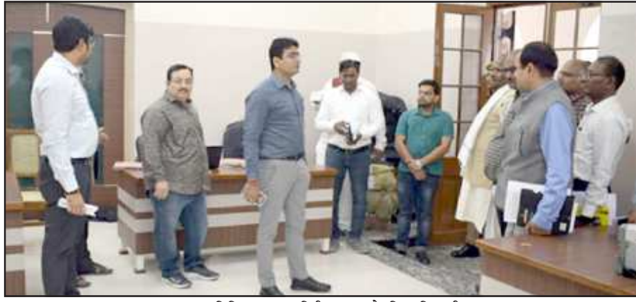
अतिथि गृह का निरीक्षण करते जिलाधिकारी।

मरम्मतकारण के कार्य का निरीक्षण किया। अतिथि गृह के निरीक्षण के दौरान उन्होंने वहां पर टॉयलेट एवं बिजली की फिनिशिंग ठीक न मिलने पर नाराजगी जताते हुए सुधार करने के निर्देश दिए हैं। उन्होंने सम्बंधित अभियंता से टॉयलेट सहित अन्य कक्षाओं में लगायी गयी सामग्री की जानकारी लेते हुए कहा कि गुणवत्ता के साथ कोई समझौता नहीं किया जायेगा। उन्होंने सामग्री की गुणवत्ता का विशेष ध्यान