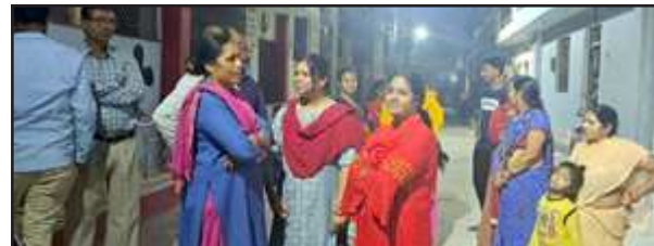
घर के बाहर लगी लोगों की भीड़।

झूसी। स्थानीय थाना क्षेत्र में शुक्रवार की शाम एक अंधेड़ की संदिग्ध परिस्थितियों में मौत हो गई। अंधेड़ की हत्या की सूचना पर पहुंची पुलिस ने शरीर पर चोट के निशान देख शव कब्जे में लेकर पीएम के लिए भेज दिया। परिजन मौत का कारण नहीं बता पा रहे थे और पीएम कराने से भी कतरा रहे थे।