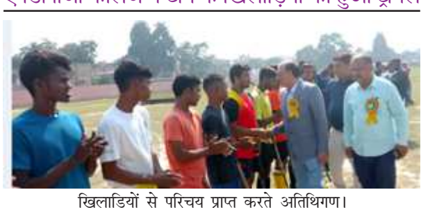
खिलाड़ियों से परिचय प्राप्त करते अतिथिगण।