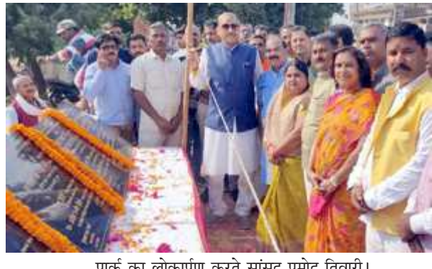
पार्क का लोकार्पण करते सांसद प्रमोद तिवारी।