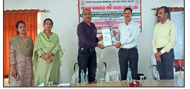
कुलभास्कर आश्रम के प्रोफेसर को सम्मानित करते प्राचार्य।