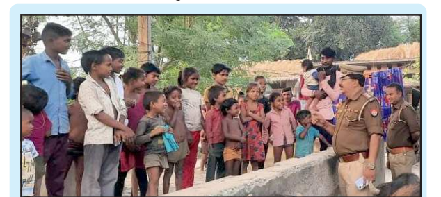
ग्रामाण और छात्रों को यातायात के जानकारी देते कोतवाल