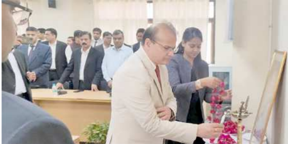
राष्ट्रीय लोक अदालत में कुल 145379 वादों का किया गया निस्तारण।

प्रयागराज। उत्तर प्रदेश राज्य विधिक सेवा प्राधिकरण लखनऊ के निर्देशानुसार शनिवार को जिला विधिक सेवा प्राधिकरण इलाहाबाद के तत्वधान में जनपद न्यायालय इलाहाबाद व समस्त तहसीलों में राष्ट्रीय लोक अदालत का आयोजन प्रातः 10:00 बजे माननीय जनपद न्यायाधीश/अध्यक्ष, जिला विधिक सेवा प्राधिकरण इलाहाबाद माननीय संतोष राय द्वारा दीप प्रज्वलित करके किया गया।