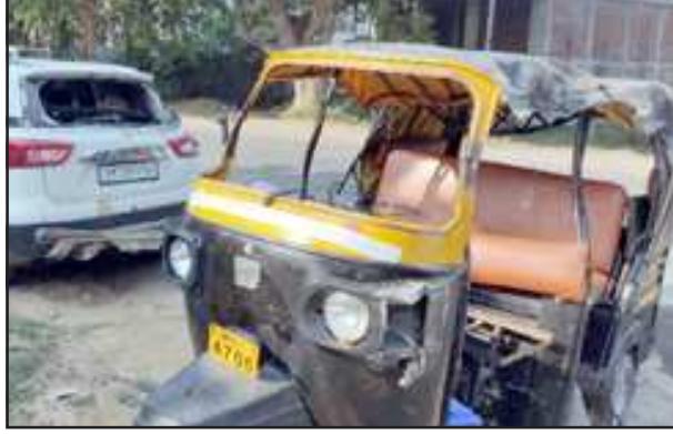
कार से टकराने के बाद क्षतिग्रस्त टेम्पो व कार।

लालगंज, प्रतापगढ़। हादसे पर हादसे आए दिन हो रहे हैं फिर भी प्रशासन लापरवाह बना हुआ है। अभी दो अगस्त को छात्रों से भरा टैंपो हंडैर चौराहे पर पलट गया था। जिसमें लगभग एक दर्जन छात्र समेत सवारियां घायल हो गई थीं। कुछ माह पहले वर्मा नगर व रानीगंज कैथोला स्थिति एक कॉन्वेंट स्कूल की मैजिक पलट गई थी जिसमें सवार कई बच्चे चोटिल हो गए थे। आए दिन हो रहे हादसे के बाद भी प्रशासन लापरवाही बरत रहा है।