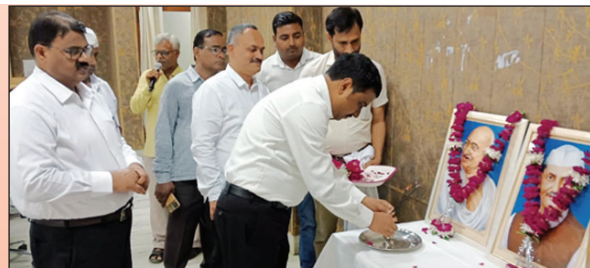
जिलाधिकारी ने महात्मा गांधी एवं लाल बहादुर शास्त्री के चित्र पर माल्यार्पण कर श्रद्धासुमन किया अर्पित