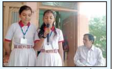
रघुपति राघव राजाराम का गीत गाती हैप्पी टाइम स्कूल की छात्राएं।

प्रतापगढ़। शहर के नया माल गोदाम रोड स्थित हैप्पी टाइम स्कूल में महात्मा गांधी व लाल बहादुर शास्त्री की जयंती हार्पोल्लास मनाई गई। स्कूल परिसर में बच्चों ने रघुपति राघव राजाराम