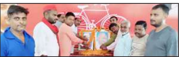
महात्मा गांधी व लाल बहादुर शास्त्री के चित्र पर माल्यापण करते सपाई।

प्रतापगढ़। राष्ट्रपिता महात्मा गांधी की जयंती एवं देश के पूर्व प्रधानमंत्री भारत रत्न लालबहादुर शास्त्री की जयंती के अवसर पर समाजवादी पार्टी कार्यालय मीराभवन पर उनके चित्र पर माल्यापण व पुष्प अर्पित कर नम-किया तत्पश्चात् शहर के शहीद उद्यान (कम्पनी गार्डन) में स्थित राष्ट्रपिता महात्मा गांधी जी व पूर्व प्रधानमंत्री भारत रत्न लालबहादुर शास्त्री की प्रतिमा पर माल्यापण