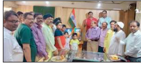
महात्मा गांधी व लाल बहादुर शास्त्री के चित्र पर माल्यापण करते व्यापार मण्डल के पदाधिकारी।