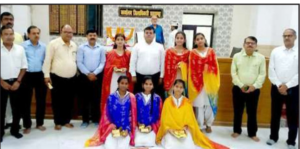
जिला कलेक्ट्रेट में मौजूद जिलाधिकारी के साथ जीजीआईसी की छात्राएं