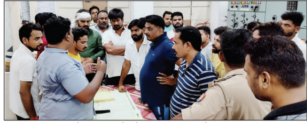
आक्रोशित ग्रामीणों को समझाते एएसडीओ ट्रांसमिशन