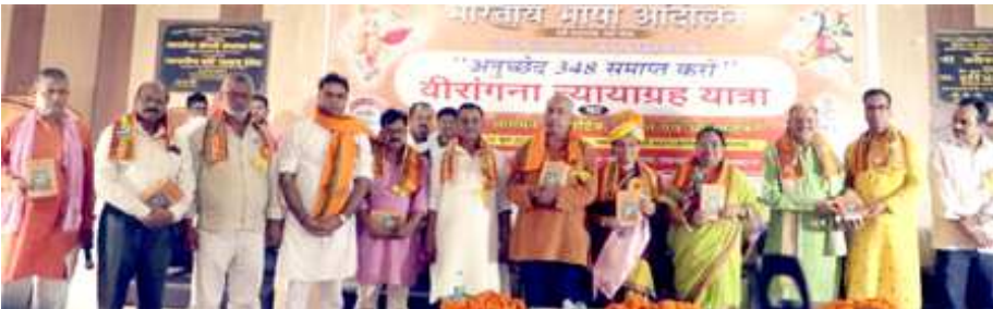
वीरांगना न्यायाग्रह यात्रा के सदस्य पहुंचे तुलसी सदन।