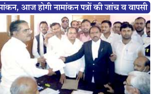
जूबाए पुरातन के पद के लिये नामांकन करते अधिवक्ता।