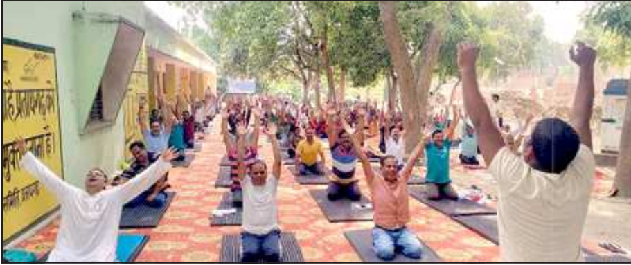
योग प्रशिक्षण कार्यक्रम में सहभागिता करते अधिकारीगण।

विद्यालय निरीक्षक व जिला बेसिक शिक्षा अधिकारी के द्वारा विद्यालयों में एवं उप कृषि निदेशक द्वारा समस्त बीज गोदामों में पर योग प्रशिक्षण के कार्यक्रम आयोजित किये जायेंगे।