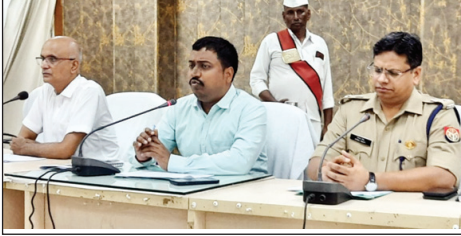
प्रबंधक प्रधानाचार्य के साथ बैठक करते डीएम एसपी

प्रकार की असामाजिक कार्यों एवं साम्प्रदायिक सौहार्द विगाड़ने वाली गतिविधियों में संलिप्त न हों तथा सोशल मीडिया पर भी भड़काऊ टिप्पणों से दूर रहें। उन्होंने सभी प्रबन्धकों एवं प्रधानाचार्यों से कहा कि अगर कोई दुष्प्रचार करता है तो उसे समझाएँ, यदि फिर भी कोई व्यक्ति नहीं मानता है और साम्प्रदायिक सौहार्द विगाड़ने का प्रयास कर सकता है तो उसकी सूचना