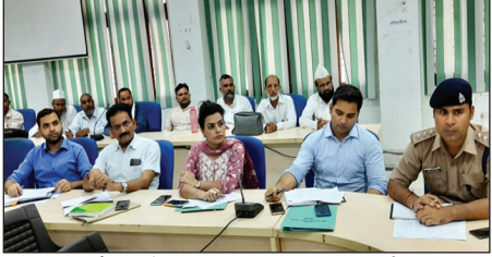
बैठक में उपस्थित प्रबंधक प्रधानाचार्य