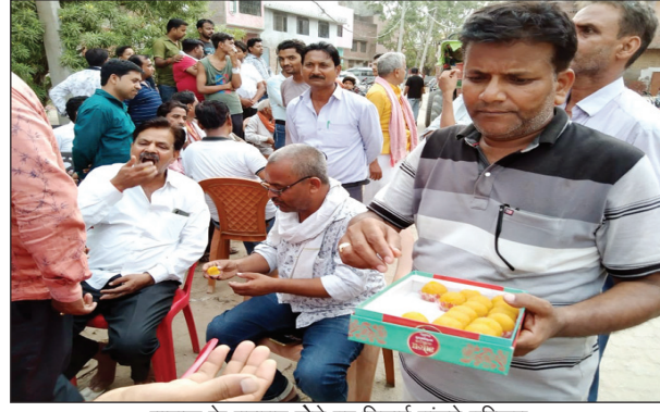
बालक के बरामद होने पर मिठाई बाँटते परिजन

जांच करना शुरू कर दिया मोबाइल और उससे कड़ाई से पूछताछ किया जाने लगा सीसीटीवी कैमरे की फुटेज के जरिए पुलिस को जानकारी लगी की बालक पड़ोसी और पड़ोसी के रिश्तेदारों ने फिरौती के लिए बालक के अपहरण की घटना को अंजाम दिया है पुलिस ने देर रात एक युवक को हिरासत में ले लिया और उससे कड़ाई से पूछताछ किया पकड़े गए सदिग्ध युवक ने बताया कि बालक को इलाहाबाद में एक युवती के पास पहुंचा दिया गया है पुलिस ने आधी रात को युवती को हिरासत में लेकर बालक को सकुशल बरामद कर लिया है और