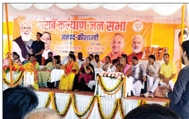
कार्यक्रम में उपस्थित राज्यमंत्री