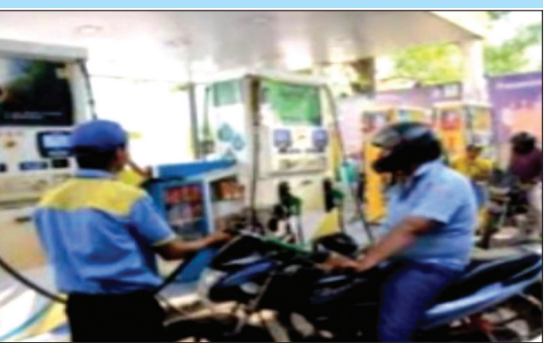
दे रहे हैं। उच्च अधिकारियों का इस ओर ध्यान आकृष्ट कराते हुए कोरांव क्षेत्र के छुट्ट गव भडमा नेता बनें