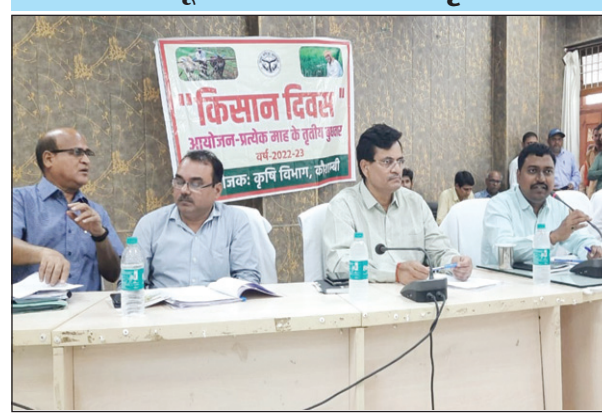
किसान दिवस की बैठक में डीएम सीडीओ व अन्य

किसान कम लागत में अधिक उपज पैदा कर सकें उन्होंने जिला कृषि अधिकारी को किसानों के उपज की मार्केटिंग विषयगत हेतु