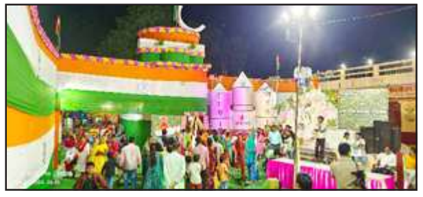
हनुमान मंदिर चिलबिला में बना चंद्रयान-3 पण्डाल।