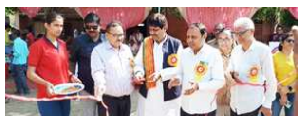
वालीबाल प्रतियोगिता का फीता काटकर उद्घाटन करते प्राचार्य अतिथिगण

प्रतापगढ़। एमडीपीजी कॉलेज में चल रही प्रोफेसर राजेंद्र सिंह (रजूजू भैया) विश्वविद्यालय की अंतर महाविद्यालयीय पुरुष वालीबाल प्रतियोगिता में एमडीपीजी कॉलेज ने एसवीएम डिट्री कॉलेज लालगंज को दौ-दौ से पराजित कर विजेता का खिताब प्राप्त किया। दोनों ही टीमों के बीच संपूर्ण मुकाबला हुआ। प्रथम सेट में एमडीपीजी ने लालगंज को 21-09 से पराजित किया जबकि दूसरे सेट में लालगंज ने एमडीपीजी को 21-19 से पराजित किया। तीसरे सेट में