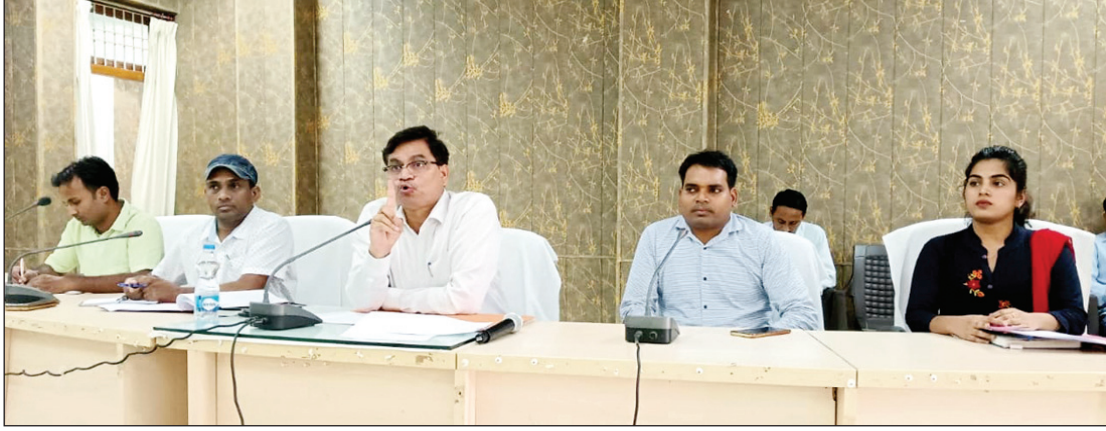
उपस्थित लोगों को संबोधित करते सीडीओ

प्रति दिन 200 से कम ई-केवाईसी पर केन्द्र को किया जाए निरस्त, 1200 संचालकों में 81 संचालक ही उपस्थित पाये जाने पर अधिकारी ने व्यक्त किया गहरा रोष