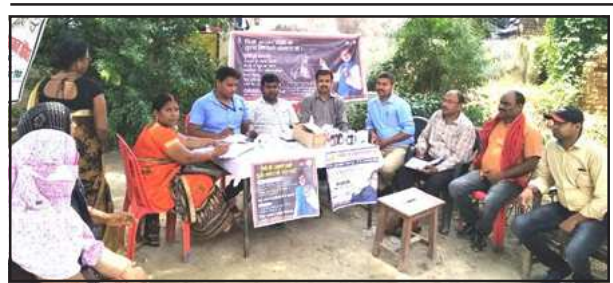
टी0बी0 जागरूकता कार्यक्रम सम्बन्धी में मौजूद अधिकारीगण।

स्वास्थ्य कैम्प में आये हुये 14 संदिग्ध टीबी के मरीजों की बलगम जांच हेतु स्पूटम कप दिया गया। जिनकी बलगम की जांच उपरान्त धनात्मक होने पर इलाज प्रारम्भ कर दिया जायेगा।