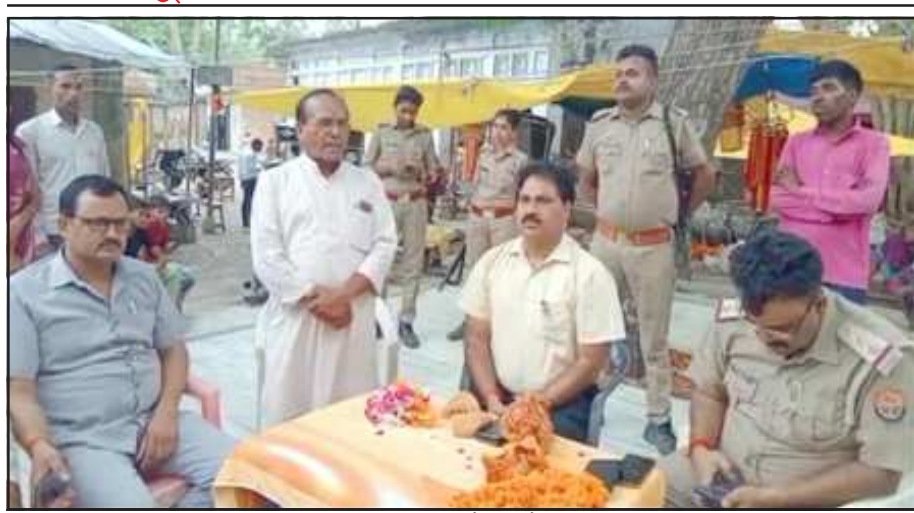
शीतला सप्तमी मेला के दौरान मौजूद अतिथिगण।

हैं। प्रशासनिक अधिकारियों का सौभाग्य है, कि माताजी जिसे बुलाती है, उसे ही प्रशासनिक कार्य करते हुए मां की सेवा का