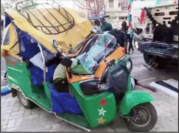
घटना स्थल पर पिचका आटो।

चित्रकूट। कोतवाली कर्मी के हाईवे पर अमानपुर गांव में तडके आटो व डम्पर में आमने-सामने हुई भिडन्त में सात लोगों की मौत हो गई, एक की हालत गंभीर है। डम्पर चालक मौके से फरार है। ये हादसा मंगलवार को तडके साढ़े पांच बजे कोतवाली कर्मी से साढ़े सात बजे हाईवे पर हुआ। बताया गया कि आटो किसी वाहन को ओवरटेक कर रहा था। सामने से आ रही डम्पर से टकरा गया। दोनों की रफ्तार काफी तेज थी।