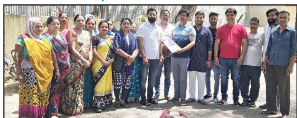
शराब की दुकान हटाये जाने को लेकर ज्ञापन देते मोहल्लेवासी।

मोहल्लेवासियों ने बताया कि देशी मदिरा की दुकान के करीब दो अत्याधिक पौराणिक शिव मन्दिर हैं जिसमें सुबह शाम मोहल्ले की समस्त हिन्दू