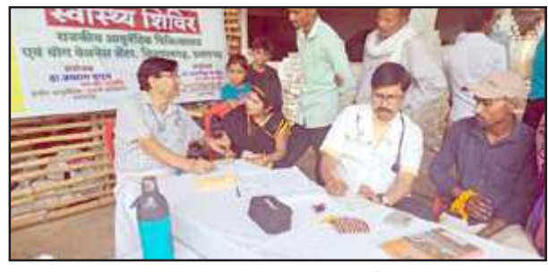
चिकित्सा शिविर में मरीजों की जांच करते चिकित्सक।