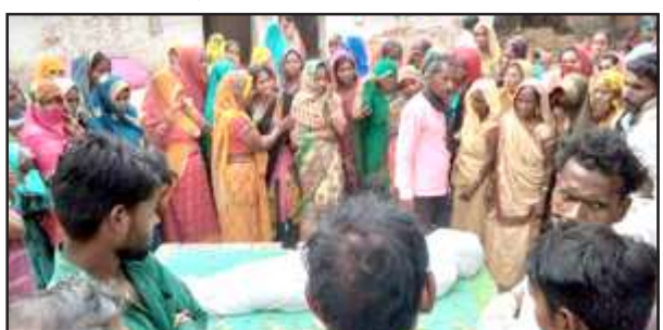
मजदूर का शव रखकर आक्रोश जताते परिजन।

पट्टी, प्रतापगढ़। तालाब में मिले मजदूर के शव को पोस्टमार्टम के बाद घर लाया गया। परिजन हत्या किए जाने का आरोप लगाते हुए अंतिम संस्कार करने से इनकार कर दिया। पुलिस परिजनों को समझाने में लगी हुई है।