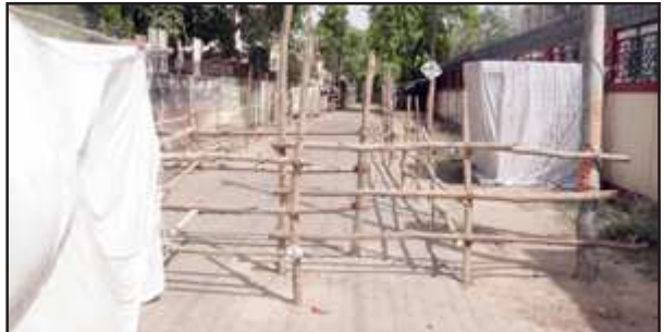
कलेक्ट्रेट परिसर में की गई बैरिकेटिंग।

प्रतापगढ़। प्रतापगढ़ संसदीय क्षेत्र में 25 मई को मतदान होना है, इसके लिये नामांकन 29 अप्रैल से शुरू हो जाएगा। नामांकन के लिये कलेक्ट्रेट में बैरिकेटिंग की गई है और नामांकन की सभी तैयारी पूरी कर ली गई है। बैरिकेटिंग के क्षेत्र में आवागमन पर प्रतिबंध रहेगा। केवल नामांकन करने वाले और उनके प्रस्तावक ही अंदर जा सकेंगे। नामांकन शुरू होने से पहले भाजपा, समाजवादी पार्टी, पीडीएम पार्टी के प्रत्याशी घोषित हो गये हैं। अभी बसपा की औपचारिक घोषणा होना बाकी है। भाजपा से सांसद