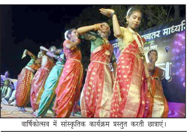
वार्षिकोत्सव में सांस्कृतिक कार्यक्रम प्रस्तुत करती छात्राएं।

बच्चों ने सरस्वती वंदना, स्वागत गीत, बेटी, शिक्षा, रानी लक्ष्मीबाई, भारतीय सैनिकों, कॉमेडी डॉस इत्यादि विभिन्न मनमोहक प्रस्तुतियों से उपस्थित हजारों श्रोताओं को तालियां बजाने पर मजबूर कर दिया। रियल,