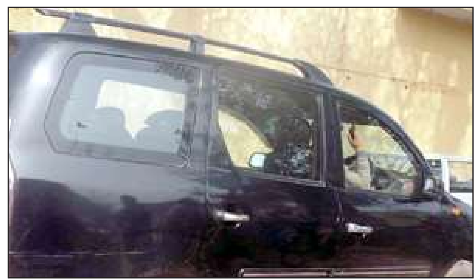
बेखौफ घूम रही लम्जरी गाड़ियां।

लम्बे समय से चित्रकूट जिला डकैतों से प्रभावित रहा है। आज भी कुछ सफेदपोश काले कारोबार में जुटे हैं। 2007 के विधानसभा व 2009 के लोकसभा चुनाव को छोड़ दें तो यहां दस्तु दुदुआ के हुबमनामे से ही विधायक व सांसद बनते रहे हैं। ये बात राष्ट्रीय स्तर पर आठवें दशक में चर्चा का विषय बन चुकी है। ऐसे में चित्रकूट जिला कालेधन की खपत की सबसे बड़ी मण्डी के तौर पर मानी जा रही है। इसके बावजूद यहां किसी के कब्जे से कोई रकम