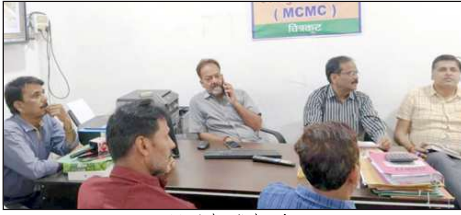
समिति की बैठक में मौजूद लोग।