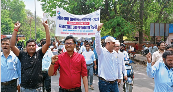
मतदाता जागरूकता कार्यक्रम के तहत निकाली गई रैली