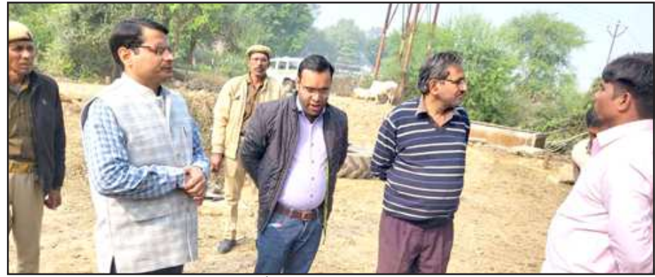
अवैध कब्जे हटवाती टीम।