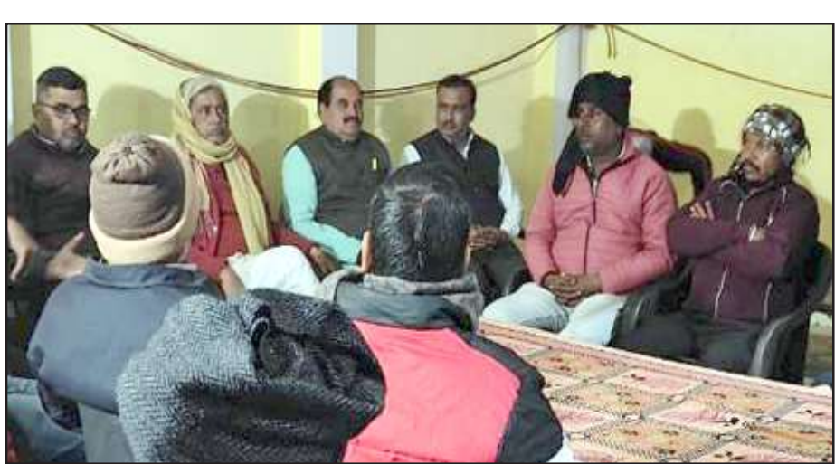
राम मंदिर प्राण प्रतिष्ठा अभियान समिति की बैठक में मौजूद पदाधिकारीगण

यदि हम इसके पीछे के कालखंड को देखें तो निश्चित रूप से हमें ज्ञात होता है कि हिंदू समाज ने सैंकड़ों वर्ष लगातार संघर्ष किया। भगवान राम हम सबके आराध्य