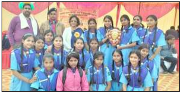
ट्रॉफी के साथ जनता इंटर कालेज की छात्राएं।