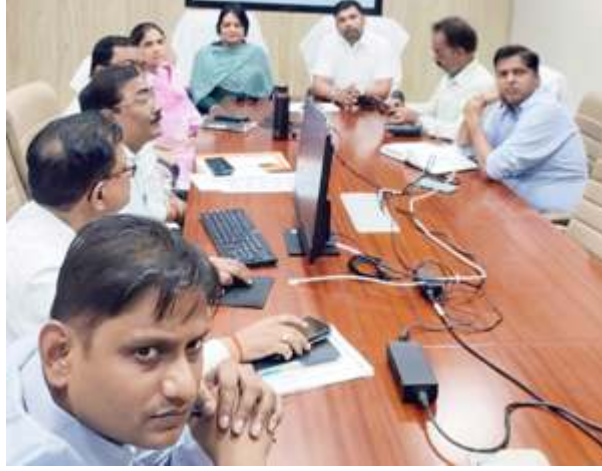
प्रेक्षक को जानकारी देते डीएम।

चित्रकूट। अपर जिला मजिस्ट्रेट/उप जिला निर्वाचन अधिकारी उमेश चन्द्र निगम ने बताया कि लोकसभा चुनाव की मतगणना चार जून को 236 चित्रकूट विधानसभा व 237 मानिकपुर विधानसभा क्षेत्र की समापन मेला परिसर में सवेरे आठ बजे से होगी। सोमवार को उन्होंने बताया कि मतगणना केन्द्र से सी मीटर परिधि को पैदल जेन चिह्नित किया है। किसी भी प्रकार के वाहनों का आवागमन प्रतिबन्धित रहेगा। मतगणना स्थल में प्रवेश को चुनाव लड़ने वाले उम्मीदवारों या उनके नियुक्त मतगणना अधिकारियों तथा मतगणना कार्य में लगे कर्मियों के वाहनों की पार्किंग चिह्नित स्थलों पर की जायेगी। समस्त सम्बन्धित से कहा कि मतगणना स्थल पर किसी भी प्रकार के इलेक्ट्रॉनिक उपकरण, मोबाइल, लैपटॉप, इलेक्ट्रॉनिक वाच, इलेक्ट्रॉनिक उपकरण ले जाना प्रतिबन्धित रहेगा।