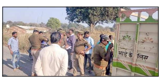
घटना स्थल पर जुटी भीड़ व जांच में जुटी पुलिस।

लालगंज, प्रतापगढ़। बुधवार को दोपहर बाद ग्रामीणों ने एक वृद्ध का शव सई नदी में देखा लोगों ने घटना की जानकारी पुलिस को दी। मौके पर पहुंची पुलिस ने शव को बाहर निकाला। मृतक की पहचान पांच दिन पहले गायब एक वृद्ध के रूप में की गई शव का