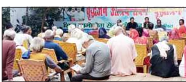
वृद्धाश्रम में आयोजित क्षय रोग जागरूकता कार्यक्रम में बोलते अधिकारी।

भारद्वाज अस्पताल पहुंचे और गम्भीर रूप से झुलसी युवती को इलाज के लिए रेफर होने की दशा में पुलिस सुरक्षा में प्रयागराज मेडिकल कॉलेज ले गए। वहां बर्न युनिट में युवती का इलाज जारी बताया जाता है। घटना को लेकर चौकी ईजांच निकेत का कहना है युवती का उपचार कराया जा रहा है। घटना के सभी तहल्लों की जांच की जा रही है। तहल्लो मिलने पर केस दर्ज कर मामले में कड़ी कार्यवाही की जाएगी।