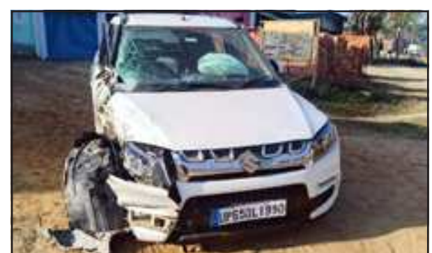
तिना गांव के समीप हाइवे पर हादसे के बाद क्षतिग्रस्त कार।

लीलापुर थाना क्षेत्र के तिना गांव के समीप लखनऊ वाराणसी हाइवे पर अनियंत्रित ट्रक से कार