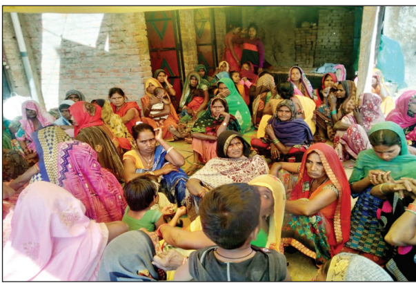
घटना के बाद रोते बिलखते परिवार

कौशाम्बी। पिपरी थाना क्षेत्र के परभा गांव से दावत खाकर वापस लौट रहे बाइक सवारों को तेज रफतार ट्रक चालक ने टक्कर मार दी है जिससे बाइक सवार सभी सड़क पर गिरकर तड़पने लगे हैं बाइक सवारों को टक्कर मारने के बाद अनियंत्रित ट्रक चालक ट्रक से कूदकर फरार हो गया जिससे ट्रक सड़क पर पलट गई है सूचना पाकर आसपास के लोग मौके पर पहुंचे हैं घायलों को इलाज के लिए अस्पताल में भर्ती कराया है इलाज के दौरान एक युवक की मौत हो गई है सूचना पाकर पहुंचे लोगों ने मृतक के शव को कब्जे में लेकर पोस्टमार्टम के लिए भेज दिया है हादसे की जानकारी मिलते ही परिवार में कोहराम मच गया है दुर्घटना की जानकारी के