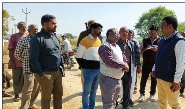
नहर का निरीक्षण करते जिलाधिकारी