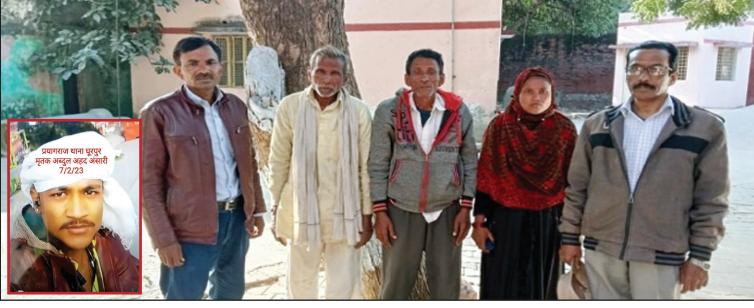
घूरपुर थाने पहुंचे मृतक के परिजन व मृतक का फाइल फोटो

शनिवार की रात इरादतगंज रेलवे ट्रेक किनारे बोरे में सड़ी गली मिली थी लाश