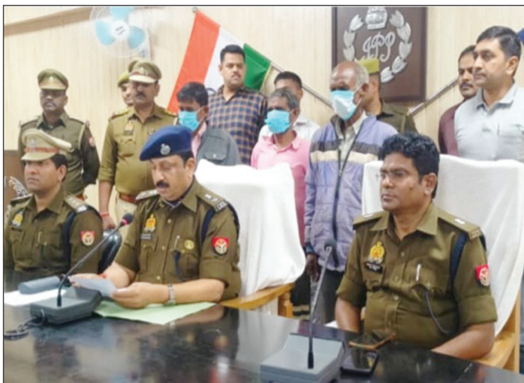
बालिका की हत्या के खुलासे की जानकारी देते पुलिस अधीक्षक