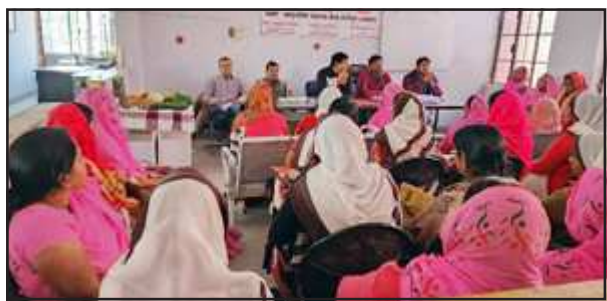
सांगीपुर सीएससी में प्रशिक्षण के दौरान मौजूद आशा कार्यकर्त्रियों।