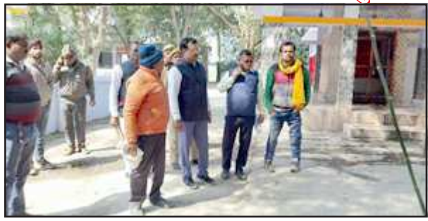
भयहरणाथ धाम का जायजा लेते एसडीएम व तहसीलदार।

समुचित कार्य कराये जाने का निर्देश दिया।