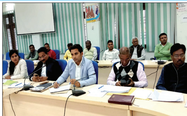
समीक्षा बैठक में उपस्थित विभिन्न विभाग के अधिकारी

अधिकारियों को लक्ष्य के सापेक्ष राजस्व वसूली में प्रगति एवं सम्बन्धित अधिकारियों को और अधिक प्रवर्तन कार्य सुनिश्चित करने के निर्देश दिये। उन्होंने सभी उप जिलाधिकारियों एवं वन अधिकारियों को अवैध खनन के विरुद्ध निश्चित रूप से कार्यवाही करने सुनिश्चित के निर्देश दिये। उन्होंने वाणिज्यकर, परिवहन, आबकारी, विद्युत