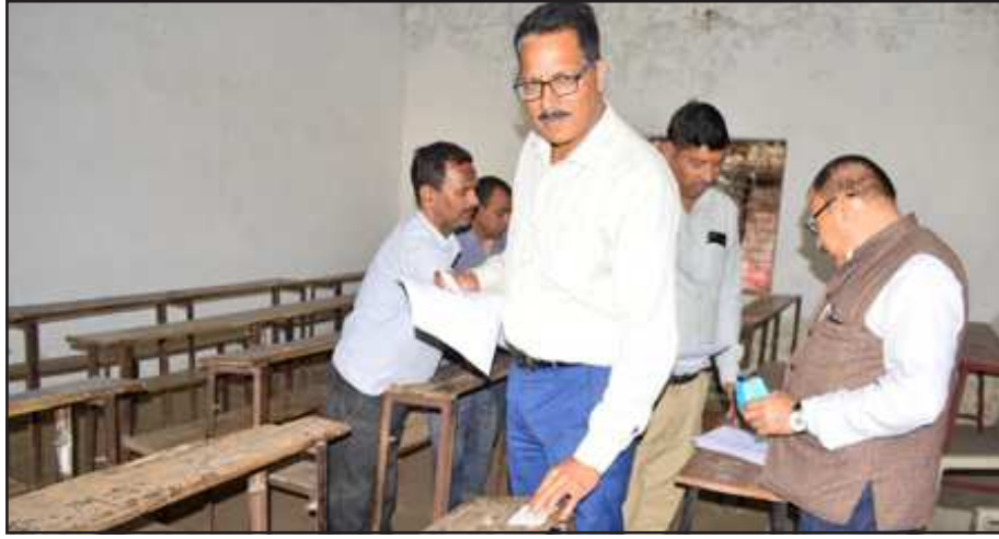
परीक्षा केंद्र पर डेस्क पर स्लिप चस्पा करते अध्यापकगण।

गत वर्ष जनपद में हाईस्कूल एवं इंटर की बोर्ड परीक्षा में एक लाख 13 हजार 772 परीक्षार्थी शामिल हुए थे। इनके लिए 214 परीक्षा केंद्र बनाए गए थे। इस बार 11 हजार 476 परीक्षार्थी बढ़ गए हैं। हाईस्कूल की परीक्षा में इस बार 62028 तथा इंटरमीडिएट में 63220 परीक्षार्थी शामिल हो रहे हैं। जीआइसी में बनाए गए कंट्रोलरूम से सभी परीक्षा केंद्रों को जोड़ दिया गया है। यहां पर 16 कंप्यूटर लगाए गए हैं। डीएम