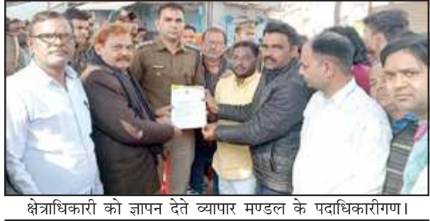
क्षेत्राधिकारी को ज्ञापन देते व्यापार मण्डल के पदाधिकारीगण।

बाजार के पदाधिकारियों व व्यापारियों ने जिलाध्यक्ष को घटना की पूरी जानकारी देते हुए पुलिस प्रशासन से समुचित सुरक्षा के साथ, अबिलंब सख्त से सख्त कार्रवाई कर अपराधियों को जेल के सलाखों के अंदर पहुंचाने के मांग का पुलिस-अधीनस्थ संबोधित ज्ञापन जिलाध्यक्ष एवं बाजार