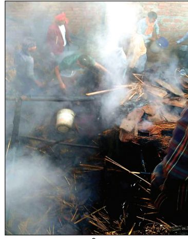
आगजनी का दृश्य

बैरमपुर कौशाम्बी। पश्चिम शरीरा थाना क्षेत्र के कोरीपुर गांव में बुधवार की सुबह अचानक आग लग गई देखते देखते आग ने विकराल रूप ले लिया आग की तेज लपट देखकर परिजनों ने घर से भागकर जान बचाई है लेकिन अफिमांड के विकरालता के चलते घर के अंदर बंधी 10 बकरियां जलकर मौत के मुंह में चली गईं हैं दलित के घर में रखा कई कुंठल गेहूं चावल अनाज नगद रुपया साइकिल कपड़ा बर्तन और अन्य सामान जल खाक हो गया है विकराल आग ने पड़ोसी के घर को भी अपने आगोश में ले लिया जिससे उसके घर का भी अनाज कपड़ा आदि सामान जल गया है ग्रामीणों ने कड़ी मशकत के बाद आग पर काबू पाया है सूचना तहसील और थाना पुलिस को पीड़ित परिजनों ने दे दी है आग बुझाने के दौरान गांव के 2 लोग झुलस गए हैं जिन्हें इलाज के लिए अस्पताल पहुंचाया गया है। घटनाक्रम के मुताबिक पश्चिम शरीरा थाना क्षेत्र के कोरीपुर गांव निवासी