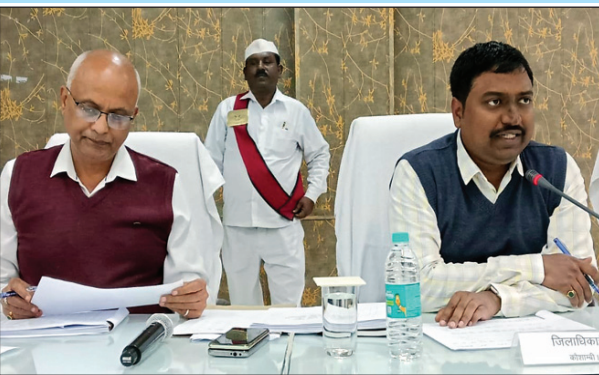
समीक्षा बैठक को संबोधित करते डीएम

लक्ष्य के सापेक्ष राजस्व वसूली में प्रगति न पाये जाने पर स्पष्टीकरण प्राप्त करने के लिए निर्देश