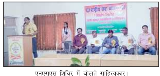
एनएसएस शिविर में बोलते साहित्यकार।