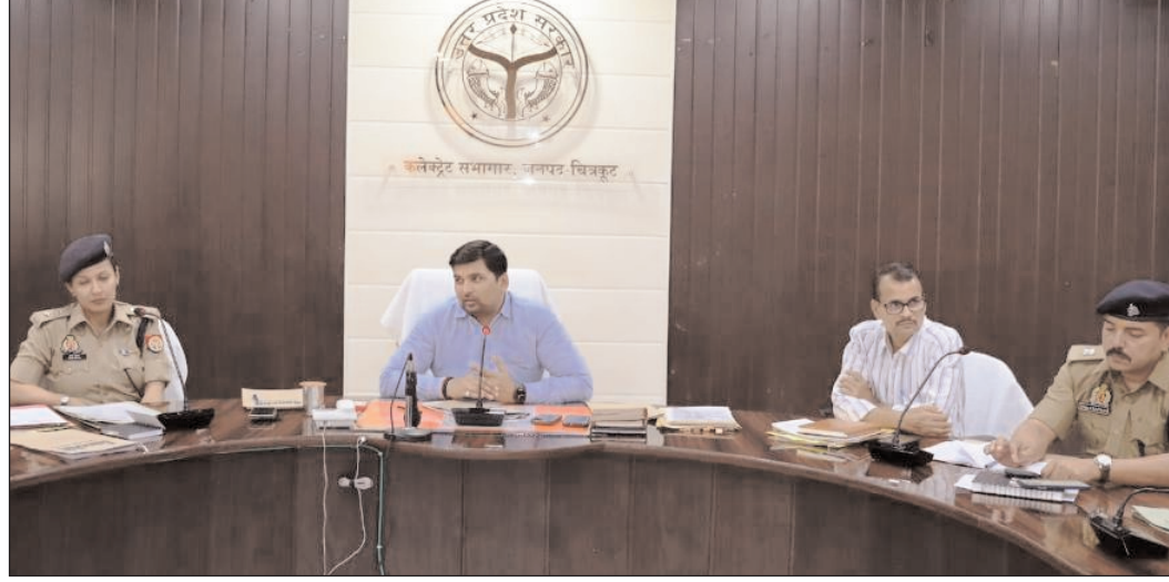
निरीक्षक से कहा कि विद्यालयों को पत्र जारी करें कि कोई भी छोटा बच्चा वाहन न चलाए। ईओ नगर पालिका तथा कर्वाी कोतवाली से कहा कि पुरानी कोतवाली के पास एवं स्टेशन रोड में अतिक्रमण चलाकर जो दुकानदार सड़क