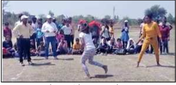
सांसद खेल स्पर्धा में प्रतिभाग करते खिलाड़ी।

सुबह 10 बजे से ही खिलाड़ियों ने मैदान में पहुंच कर अपनी उपस्थिति दर्ज कराई। मंगलवार को कुंडा, बिहार,