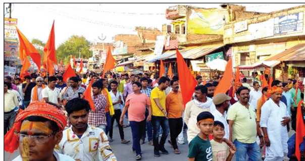
श्रीराम भक्तों द्वारा निकाली गई भव्य शोभायात्रा व शामिल लोग