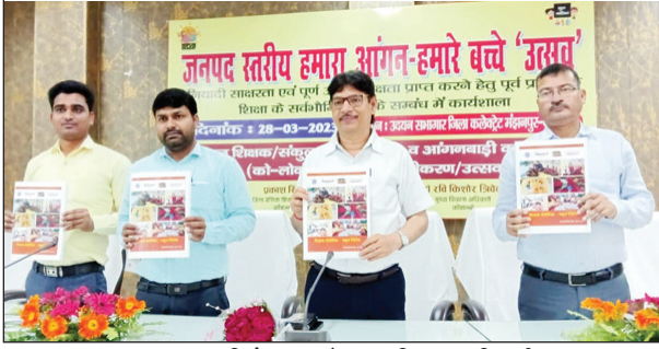
पुस्तक का विमोचन करते मुख्य विकास अधिकारी