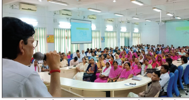
कार्यक्रम में उपस्थित लोगों को संबोधित करते मुख्य विकास अधिकारी

विभिन्न गतिविधियों के आयोजन से बच्चों में सीखने की क्षमता विकसित हो सके। सीडीओ ने आंगनवाड़ी कार्यकर्त्रियों एवं शिक्षक/ शिक्षिकाओं से अपेक्षा की कि आप लोग समाज के लिए रूचि रखें। दिवसवार-मासिक सर्कल टाइम, स्वतंत्र खेल, भाषा और साक्षरता, कला, गणित/ ईवीएस/ वैज्ञानिक सोच, बाहरी खेल एवं गुड बाय सर्कल गतिविधियों के अन्तर्गत शिक्षण कार्य करना है। उन्होंने सभी