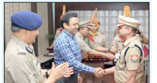
एसपी को प्रशंसा चिन्ह से अलंकृत करते गृह सचिव।