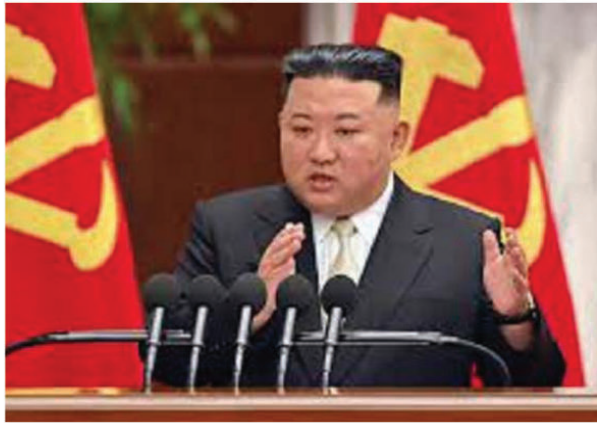
शुरुआत में चीन सीमा पर तैनात होने के बाद सेना को वापस बुलाया गया था। कोरोना संकट समाप्त होने के बाद सेना को वापस बुलाया गया। बटालियन की वापसी के

प्योंगयांग। उत्तर कोरिया के तानाशाह किम जोंग उन अपने आदेशों से दुनिया भर में चर्चा का मुद्दा रहते हैं। अब एक बार फिर उन्होंने एक ऐसा ही आदेश करके दो लाख लोगों को घरों में कैद कर दिया है। दरअसल, एक सैनिक के पास से गायब 653 गोलियां ढूँढने के लिए एक पूरे हेसन शहर में लॉकडाउन लगा दिया गया है। उत्तर कोरिया के उत्तरी इलाके रियांग के हेसन शहर से बीते सात मार्च को कोरियाई पीपुल्स आर्मी की सातवीं बटालियन वापस लौटी थी। इस बटालियन को 2020 में कोरोना महामारी की