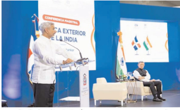
भारत ने पूरे क्षेत्र में संपर्क और सहयोग में बड़े पैमाने पर विस्तार देखा है। हालांकि, सीमा पर आतंकवाद के मद्देनजर पाकिस्तान इसका अपवाद बना हुआ है। उन्होंने कहा कि

सैंटो डोमिंगो। भारतीय विदेश मंत्री एस. जयशंकर ने कहा है कि सीमा समझौतों की अवहेलना के कारण ही चीन से भारत के रिश्ते बिगड़े हैं। उन्होंने सभी देशों के साथ बिना शर्तों के संबंध आगे बढ़ाने की बात कही।