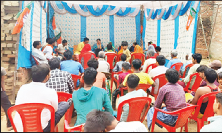
कार्यक्रम में उपस्थित ग्रामीण