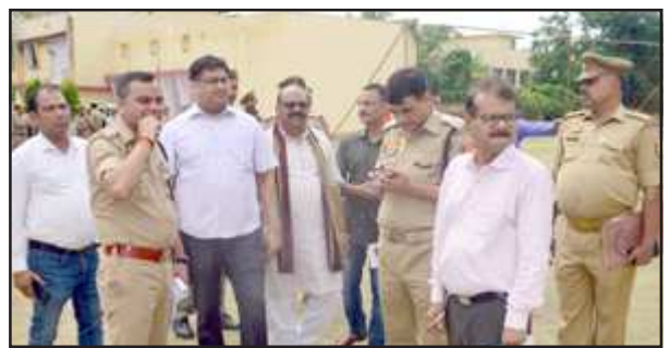
राजकीय इंटर कालेज का निरीक्षण करते डीएम-एसपी।