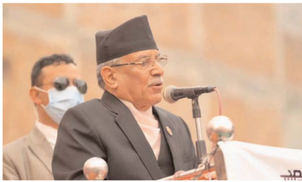
प्रधानमंत्री प्रचंड अब जून महीने में भारत जा सकते हैं। उल्लेखनीय है कि इस बार प्रधानमंत्री बनने के करीब पांच

कहा है कि वह मई महीने के बाद ही भारत का दौरा करेंगे। महीने के बाद भी प्रचंड अभी तक किसी देश के दौरे पर नहीं गए हैं।