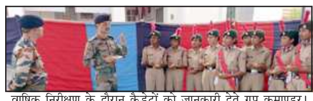
वार्षिक निरीक्षण के दौरान कैडेटों को जानकारी देते गुप कमाण्डर।

इस दौरान कैडेटों ने उन्हें बटालियन के इतिहास से परिचित कराया और समाज सेवा अभियान के अन्तर्गत किये गये प्रयासों पर प्रकाश डाला। गुप