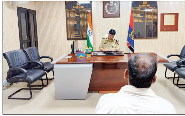
जनसुनवाई करते पुलिस अधीक्षक