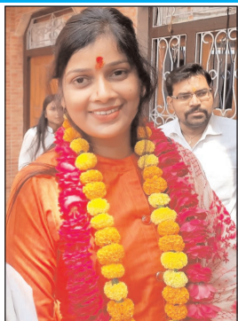
भाजपा जिलाध्यक्ष ने पार्टी से