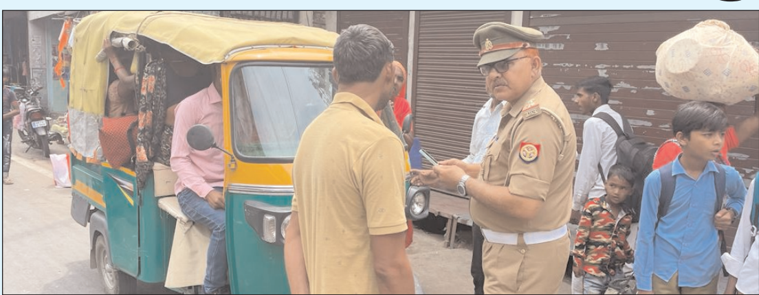
स्थान की जानकारी लेकर उनका निरीक्षण किया गया। कस्बा चौकी गुरसहायगंज पुलिस टीम व प्रभारी यातायात कन्नौज

कन्नौज। आटो, टैक्सी ई-रिक्शा जागरूकता अभियान के अंतर्गत थाना गुरसहायगंज क्षेत्र में यातायात प्रभारी कन्नौज/कस्बा चौकी थाना गुरसहायगंज पुलिस द्वारा चेकिंग अभियान चलाया गया। थाना गुरसहायगंज क्षेत्र में नगर पालिका गुरसहायगंज की अधिशाषी अधिकारी द्वारा 04 स्थानों को आटो, टैक्सी, ई-रिक्शा स्टैण्ड हेतु चिह्नित किया गया है जो निम्नलिखित हैं। फरखाबाद रोड, मिलिट्री ग्राउण्ड के सामने, जी0टी0रोड छिब्रामऊ की तरफ नंगापुरवा सड़क के सामने, तिवाँ रोड, ब्रम्हदेव मन्दिर के सामने और जी0टी0रोड कन्नौज, पावर हाउस के पास। उक्त चिह्नित आटो, टैक्सी, ई-रिक्शा