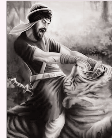
लगातार अफगानों से लोहा लेते रहे। अफगानों के विशुद्ध लड़ाई जीतकर उन्होंने कसूर, मुल्तान, कश्मीर और पेशावर में सिख शासन की स्थापना की। काबुल बादशाहत के तीन परतून

जैसा व्यवहार करते , वे मुसलमानों के साथ वैसा ही व्यवहार करते थे। उन्होंने मुसलमान बन चुके सैकड़ों बंधुओं की घर वापसी भी की। जिससे बिना किसी संकोच के बड़ी संख्या में लोगो की घर वापसी होने लगी, लेकिन हिन्दुओं की नासमझी और रूढ़ियों के कारण ऐसा हो न सका , आज उसका परिणाम कश्मीरी पंडित झेल रहे है। 1837 में जामरोद पर अफगानों ने आक्रमण किया। रणजीत सिंह के बेटे का विवाह लाहौर में था हरिसिंह पेशावर में वीमार थे। आक्रमण का समाचार सुनते ही वे जामरोद पहुँचे। जबरदस्त मुकाबले के बाद अफगानों सैनिक पराजित हो भाग निकले नलवा और सरदार निधन सिंह उनका पीछा करने लगे। रास्ते में सरदार समसखान एक घाटी में छिपा हुआ था। घाटी में पहुँचते ही नलवा पर आक्रमण हुआ और हरिसिंह नलवा को धोखे से पीछे से गोली मार दी इसके बाद भी हरिसिंह दुश्मनों से लड़ते रहे जब वे जामरोद पहुँचे तो उनका निष्पण शरीर ही छोड़े पठा था। महाराजा रणजीत सिंह के शासनकाल में 1807 ई. से लेकर 1837 ई. तक हरि सिंह नलवा