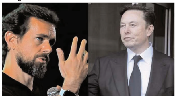
बेचने के लिए बोर्ड को जबरदस्ती करनी चाहिए थी। लेकिन सब खराब हो गया। अब केवल इतना कर सकते हैं कि इसे दोबारा होने से बचाने के लिए हम कुछ बना सकते हैं। मैं खुश हूँ कि मेरे पास जे और टीम और नोस्टर देक्स

खराब होने का एहसास होने के बाद ही उन्होंने सही काम किया। न ही मुझे लगता है कि कंपनी को