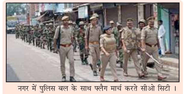
नगर में पुलिस बल के साथ फ्लैग मार्च करते सीओ सिटी ।