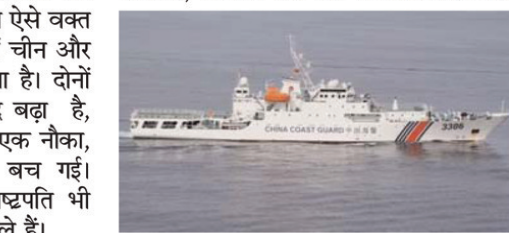
वजह है कि दोनों देशों के बीच विवाद बना हुआ है। दोनों देशों के बीच अब क्यों बढ़ा है तनाव दरअसल रविवार को फिलिपींस कोस्ट गार्ड ने दुनियाभर के कई पत्रकारों को अपने जलक्षेत्र में द्वीप और जलीय सीमा दिखाने के लिए आमंत्रित किया है। जब पत्रकारों को लेकर जा रही फिलिपींस की नौका स्प्रेटली द्वीप के पास पहुंची तो सामने से चीन के कोस्ट गार्ड का जहाज आ रहा था, जो साइज में

पर अपना दावा करता है, जबकि कई अन्य देश भी दक्षिण चीन सागर पर अपना दावा करते हैं, जिनमें फिलिपींस भी शामिल है। यही