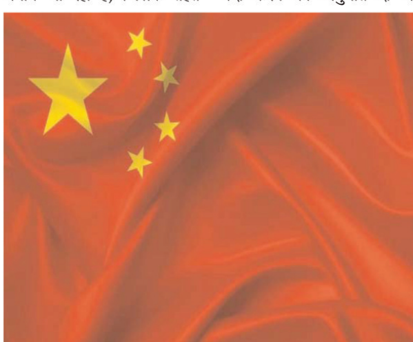
अविवाहित महिलाएं न सिर्फ बच्चे पैदा कर सकेंगी, बल्कि कोई चिकित्सकीय समस्या होने की स्थिति में कानूनी तौर पर उपचार भी करा सकेंगी। चीन के सिचुआन प्रांत में तो

है। अब चीन एक और नया नियम बनाने जा रहा है, जिसके तहत अविवाहित महिलाओं को बच्चे पैदा करने की अनुमति दी जा