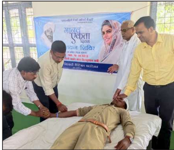
रक्तदान करते लोग।