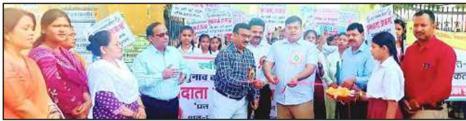
मतदाता जागरूकता रैली का फीता काटकर शुभारंभ करते डीएम।