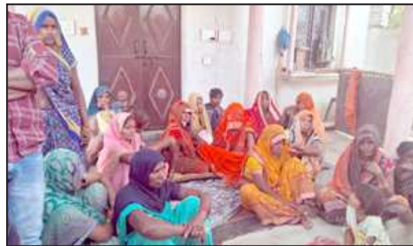
युवती की मौत पर रोते-बिलखते परिजन।

प्रतापगढ़। युवती का शव मिलने के बाद गांव में लोग आपस में चर्चा करते रहे कि सभी जानते हैं दोनों में दो साल से प्रेम चल रहा है। प्रेमी के बुलाने के बाद वह घर से निकली तो प्रेमी को उसे भ्रमला दे जाना था, किंतु कौन सी नौबत आ गई कि उसने प्रेमिका को गोली मार दी। घर पर आई महिलाएं भी यही कहकर रो रही थी कि उसको भगा ले जाना था, मारने की क्या जरूरत थी।