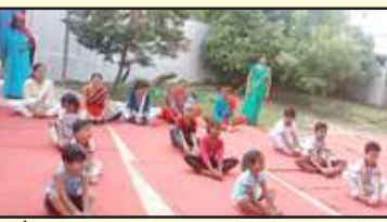
हैप्पी टाइम स्कूल में योगा करते नन्हे-मुन्ने बच्चे

प्रतापगढ़। शहर के नया माल गोदाम रोड स्थित हैप्पी टाइम प्ले वे स्कूल में छोटे-छोटे बच्चों ने प्राणायाम, बटरफ्लाई जैसे योगा किये। इस