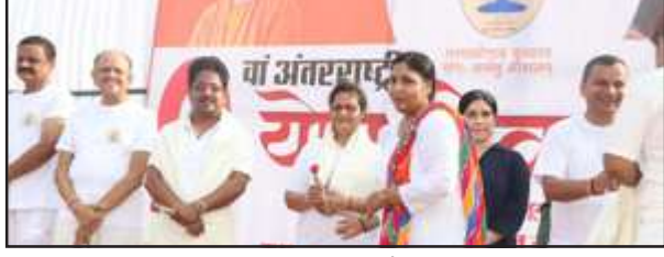
राजकीय इंटर कालेज में आयोजित कार्यक्रम में मौजूद डीएम, एसपी व जनप्रतिनिधि

पुलिस लाइन में दो हजार से अधिक लोगों ने किया योगा, डीएम, एसपी, विधायक, नपाध्यक्ष सहित अधिवक्ताओं, व्यापारियों ने किया योगा