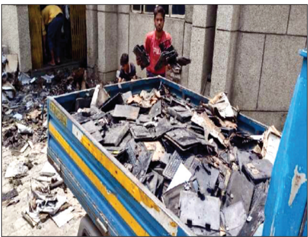
जले हुए टैबलेट को बाहर निकालते कर्मचारी