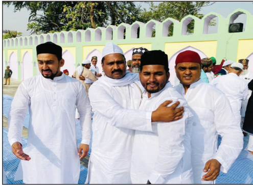
भरवारी नगर में ईद की मुबारकबाद देते लोग