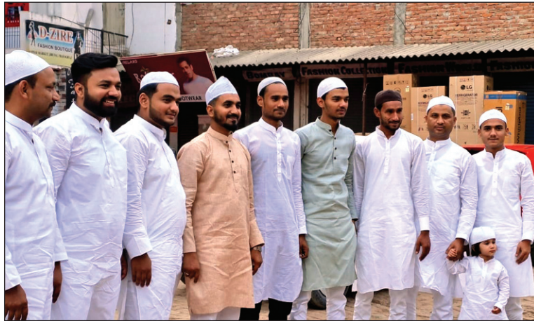
ईद की नमाज अदा करने निकली युवाओं की टोली