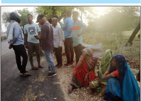
भरवारी नगर में ईद की मुबारकबाद देते लोग