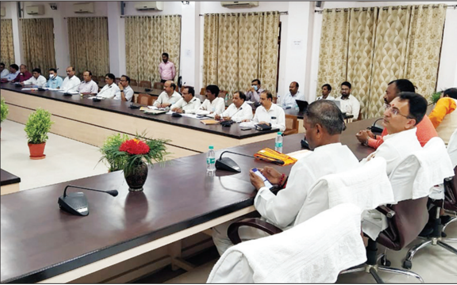
अधिकारियों के साथ बैठक करते पीडब्लूडी मंत्री