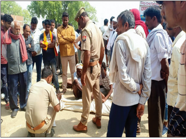
घटनास्थल पर पुलिस व लोगों की भीड़