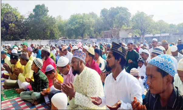
ईद पर नमाज अदा करते लोग

शांति पूर्वक नमाज अदा करने के बाद लोगों ने एक दूसरे से गले मिलकर मुबारकबाद दी