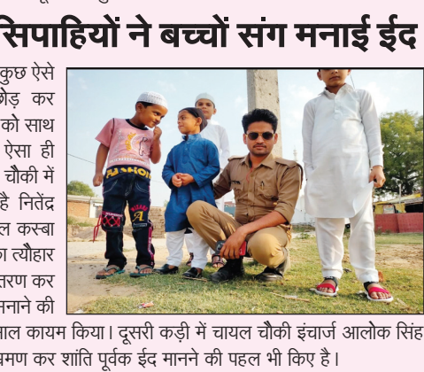
भरवारी नगर में ईद की मुबारकबाद देते लोग