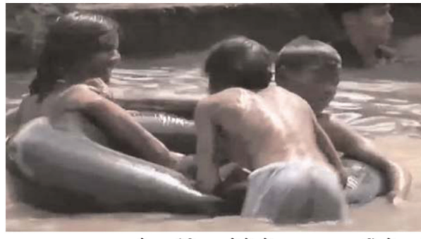
खाइबर-पख्तुनख्वा के पर्वतीय क्षेत्रों में असाधारण गर्मी से बर्फ

में तापमान 48 डिग्री के भी पार पहुंच गया है। इसके चलते अचानक बढ़ी बिजली की मांग के सामने पावर सिस्टम फेल हो गया है। नतीजतन देहातों में 18 घंटे, जबकि शहरों में 12 घंटे तक बिजली गुल हो रही है। पाकिस्तान के मौसम विभाग का कहना है कि देश के अनेक हिस्सों में दिन का तापमान औसत से 5एच से 8एच ऊपर रहने की सम्भावना है। गिलागिट-बाल्टिस्तान और