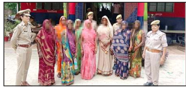
पुलिस द्वारा गिरफ्तार की गई महिलाएं।

कुण्डा, प्रतापगढ़। हथिंगवां थाना क्षेत्र के इब्राहिमपुर कुड़ा में रविवार को हुयी शर्मशार करने वाली घटना में पुलिस अधीक्षक के निर्देश पर बड़ी कार्यवाही को अंजाम देते हुए 17 लोगों को गिरफ्तार कर लिया है। गिरफ्तार किए गये लोगों में 9 महिला और 8 पुरुष आरोपी हैं। सोमवार को न्यायिक अधिकारी कुण्डा के सामने प्रस्तुत करके जेल भेज दिया गया है। पुलिस ने कुल 20 ज्ञात और 25