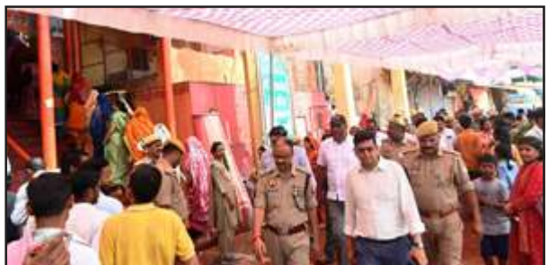
रामघाट का जायजा लेते डीएम-एसपी।

सोमवार को डीआईओएस ने बताया कि परीक्षा के पुनः आयोजन को चयनित छह परीक्षा केन्द्र का