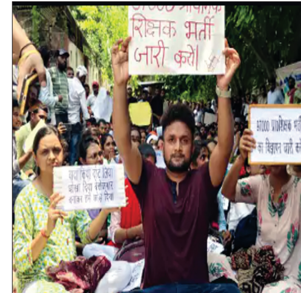
करने के बाद भी 51,112 पद अभी भी खाली हैं। ये पद आगे भरेंगे। इसके बाद डेटा है कि हर साल 12 से 15 हजार शिक्षक रिटायर हो रहे हैं। 5-6 साल से प्राथमिक शिक्षक भर्ती नहीं आई। इसी को जोड़कर हम लोग कम से कम 97000 प्राथमिक शिक्षक भर्ती की मांग कर रहे हैं।