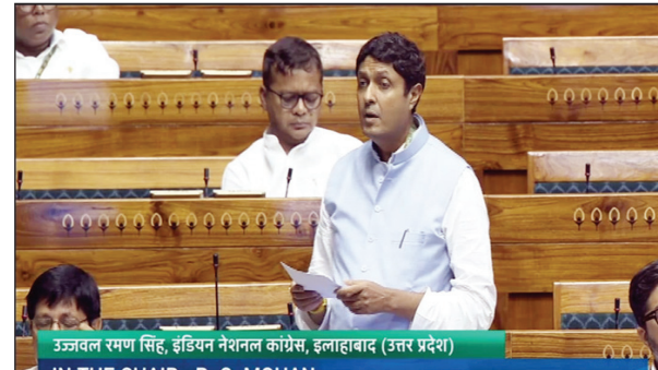
उज्जवल रमण सिंह, इंडियन नेशनल कांग्रेस, इलाहाबाद (उत्तर प्रदेश) IN THE CHAIR : P. C. MOHAN