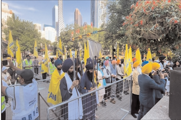
इस रिपोर्ट के मुताबिक, इसका आयोजन खालिस्तान समर्थक

कैलगरी (कनाडा)। कनाडा में भारत विरोधी गतिविधियां थमने का नाम नहीं ले रही। अब यहां के कैलगरी में खालिस्तान पर जनमत संग्रह का तमाशा देखने को मिला। इसमें हिस्सा लेने के लिए कनाडा में रह रहे हजारों सिख कैलगरी के म्यूनिसिपल प्लाजा पहुंचे। यह प्लाजा स्थानीय संयुक्त राज्य राजनयिक मिशन के सामने है। पाकिस्तान के जियो चैनल ने 28 जुलाई को अपनी वेबसाइट पर इस बारे में विस्तार से रिपोर्ट जारी की है।