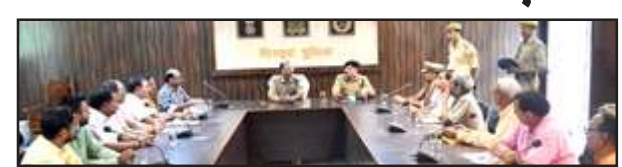
व्यापारियों से चर्चा करते एसपी-एसपी।