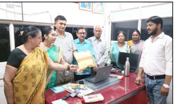
प्रवर डाकपाल को राखियों का पैकेट देते एलायंस क्लब के पदाधिकारी।

प्रतापगढ़। एलायंस क्लब इंटरनेशनल प्रतापगढ़ द्वारा पावन पर्व रक्षाबंधन के उपलक्ष्य में विगत 25 वर्षों से सैनिक भाइयों को प्रेषित की जाने वाली पवित्र राखियों के क्रम में इस वर्ष भी 2100 बेल्हा की बहनों के हाथों से निर्मित राखियों का पैकेट महामहिम राष्ट्रपति के