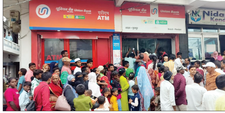
यूनियन बैंक की फूलपुर शाखा में आधार अपडेट करवाने के लिए लाइन में लगे ग्रामीण