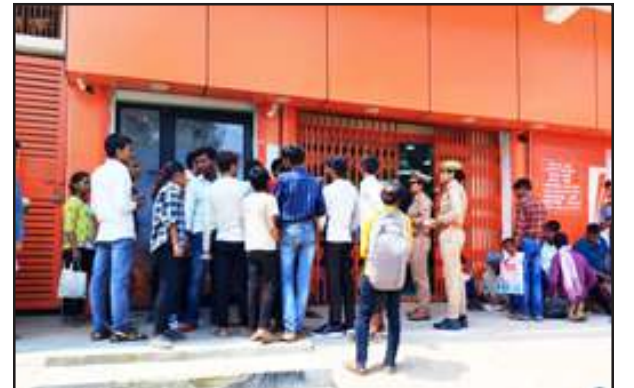
बैंकों की सुरक्षा देखते सीओ।

सोमवार को जिले के क्षेत्राधिकारियों ने क्षेत्र के बैंकों की जांची की। जांच दौरान सतर्कता से ड्यूटी करने के निर्देश दिये। बैंकों में लगे अलार्म/सायरन, सीसीटीवी कैमरों को देखा। सही ढंग से कार्य कर रहे है या नहीं। शाखा प्रबंधकों से सुरक्षा बाबत