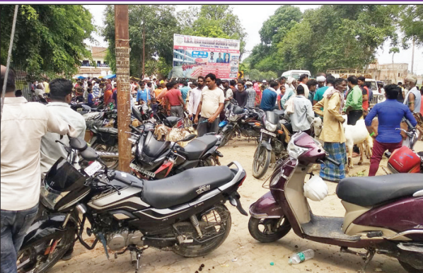
सड़क पर लगी बकरा बाजार की भीड़

चारो तरफ बकरा बांध देते है। दुर्घटना को दावत देता है बकरा बाजार : सराय अकिल के बकरा बाजार के कारण सड़क पर बेहोरी तरीके से वाहन खड़ा कर देते है जो कि किसी दिन बड़े हादसे का कारण बन सकता है। वादस यह उठता है