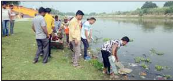
सई नदी से पालीथिन निकालते अधिशासी अधिकारी व अन्य।

नगर पालिका के ईओ व कर्मचारियों ने सई नदी से भी निकाली पालीथिन