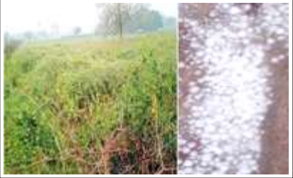
ओला गिरने से क्षतिग्रस्त सरसों की फसल।

अखंड भारत संदेश चित्रकूट। बीती रात अचानक मौसम के मिजाज बिगड़ गया। जोरदार बारिश के साथ ओले पड़े। ज्यादातर गांवों में बारिश के साथ ओले गिरे। इससे रबी की फसल सरसों, मसूर, अरहर, चना, मटर के साथ गेहूँ को क्षति पहुंची है। सोमवार की रात बारिश व ओला गिरने की सम्भावना थी, आधी रात बाद तेज गर्जना के साथ बारिश-ओले गिरने शुरू हो गये। रात ढाई बजे तेज हवा के साथ ओले गिरे। जिला मुख्यालय में दस मिन्ट तक लगभग बीस ग्राम वजन के ओले गिरने से क्षेत्र में फसलों को क्षति पहुंची। भरतकूप क्षेत्र में दो दर्जन गांवों में बड़े-बड़े ओले गिरने से सरसों फसल पूरी तरह बर्बाद हो गई। यही हाल मानिकपुर के मारकुण्डी में हल्की बारिश होने से फसलें बच गईं। ओलावृष्टि से दस मिन्ट तक ओले गिरे। मऊ गुरदरी में ओलावृष्टि हुई।