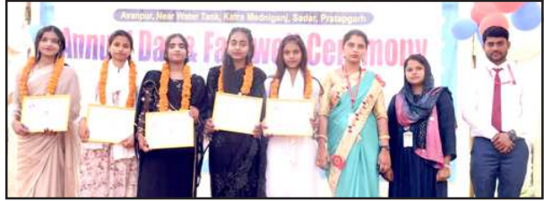
विद्यालय में आयोजित विदाई समारोह में मौजूद छात्राएं।