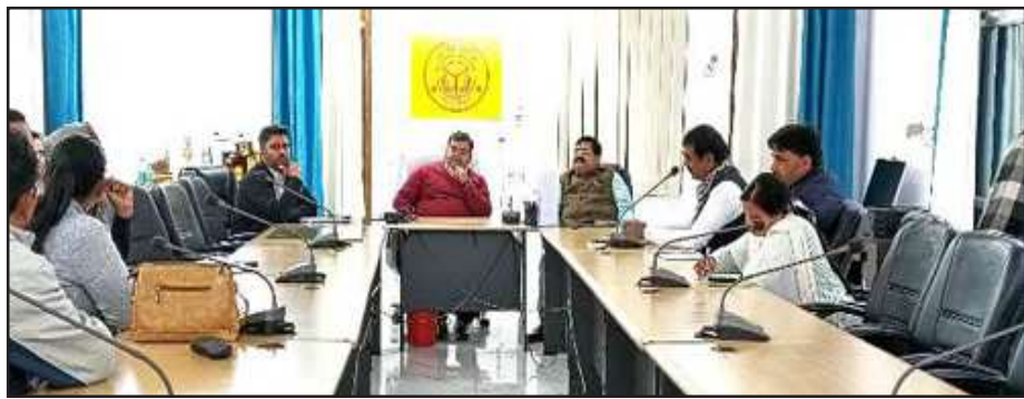
सांसद महिला खेल स्पर्धा सम्बन्धी बैठक में मौजूद सांसद व डीएम।

उन्होंने बताया है कि प्रतियोगिता में 800 मीटर दौड़, कुश्ती, वालीबॉल, कबड्डी, लम्बी कूद का आयोजन किया गया है।