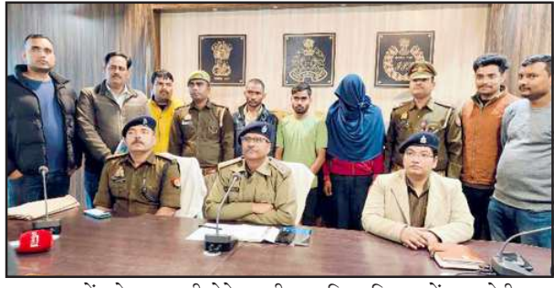
पत्रकारों को जानकारी देते एस्पपी व पुलिस गिरफ्त में हत्यारोपी।