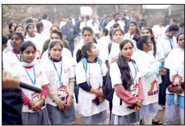
वाक करती छात्राएँ।

मंगलवार को योगा में बेसिक विद्यालय कम्पोजिट के सभी ब्लॉकों के 50 छात्र व 50 शिक्षकों समेत दो सौ लोगों ने योगाभ्यास किया। गणेश बाग की हेरिटेज वाक समेत रामघाट में वाक, तुलसीदास स्नातक कॉलेज के 50 विद्यार्थी युवा पर्यटन क्लब के मेबर, सेन्ट थामस के 15 विद्यार्थी, बेसिक विद्यालय