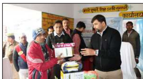
सामग्री देते डीएम।