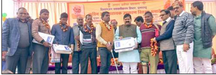
दिव्यांगों को उपकरण वितरित करते सांसद संगम लाल गुप्ता।

आज के वितरण में 501 ट्राई साइकिल, बैशाखी 332 जोड़ी, व्हीलचेयर 25, स्मार्ट केन नेत्रहीन छड़ी 42, एम0 आर0 कीट 14, सी0पी0 चेर 18, कृत्रिम हाथ पैर 395, का वितरण किया गया। सांसद प्रतापगढ़ एवं राष्ट्रीय महामंत्री ओबीसी मोर्चा भाजपा संगम लाल