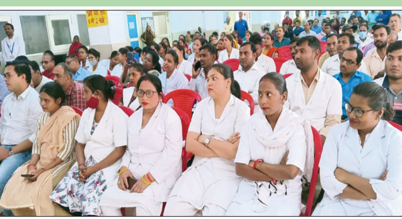
कार्यक्रम में उपस्थित स्वास्थ्य कर्मी

किया गया जिलाधिकारी ने कहा कि आप लोगों का कार्य बहुत पुर्य का कार्य होता है उन्होंने कहा कि आप लोग अपने दायित्वों का निर्वहन करते हुए मरीजों को बेहतर चिकित्सीय सुविधा उपलब्ध कराये उन्होंने कहा कि आप लोगों की शासन द्वारा स्वास्थ्य से सम्बन्धित संचालित विभिन्न योजनाओं-