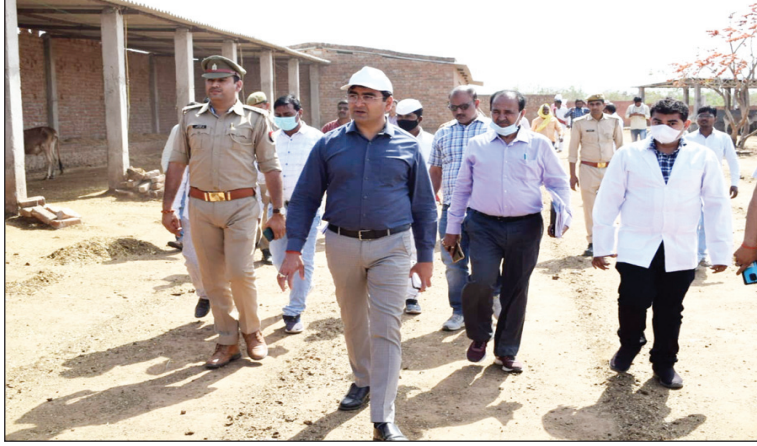
निरीक्षण करते जिलाधिकारी

साफ-सफाई ठीक न मिलने पर सचिव के खिलाफ कार्यवाही के जिलाधिकारी ने दिए निर्देश, गोवंश आश्रय में पशुओं के लिए पर्याप्त चारा, चोकर उपलब्ध रहें-जिलाधिकारी