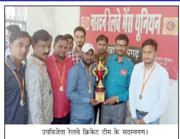
उपविजेता रेलवे क्रिकेट टीम के सदस्यगण।