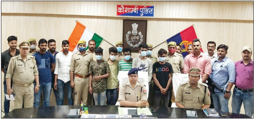
लूट कांड का खुलासा करते पुलिस अधीक्षक