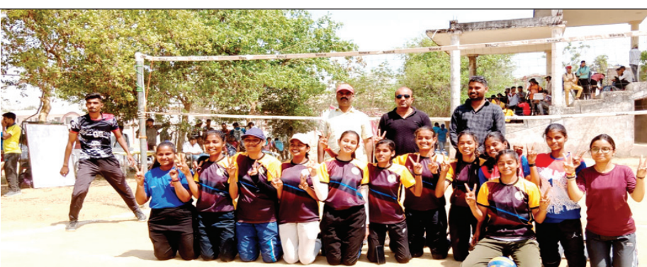
खिताब जीतने के पश्चात खुशी व्यक्त करते छात्राएं