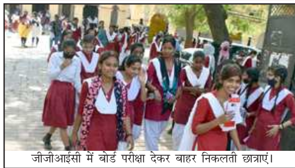
जीजीआईसी में बोर्ड परीक्षा देकर बाहर निकलती छात्राएं।

अनुपस्थित रहे। केवल 369 परीक्षार्थियों ने परीक्षा दी। परीक्षा देने वालों में 59 छात्र व 310 छात्राएं शामिल रहीं। हाईस्कूल व इंटर की परीक्षा में आंतरिक सचल दल भी सक्रिय दिखाई दिया। गेट पर ही छात्र-छात्राओं की तलाशी करी जा रही थी। शिक्षा विभाग के अधिकारी भी परीक्षा केंद्रों का निरीक्षण कर रहे थे।