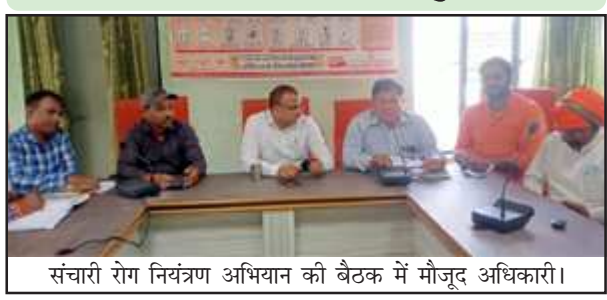
संचारी रोग नियंत्रण अभियान की बैठक में मौजूद अधिकारी।

उन्होंने हैण्डपम्पों का निरीक्षण कर उथले हैण्डपम्पों को चिन्हित कर लाल निशान लगाने का निर्देश दिया। बैठक में शुद्ध पेयजल के लिये नगर पालिका के पानी को