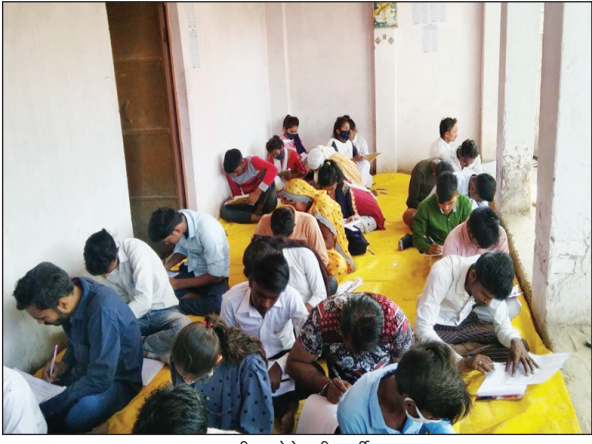
परीक्षा देते परीक्षार्थी

लेडियारी। आजादी के बाद पहली बार खीरी में उत्तर प्रदेश सरकार द्वारा संचालित शिक्षा बोर्ड द्वारा संस्कृत भाषा को प्राथमिकता देते हुए श्री हनुमन्त संस्कृति उच्च माध्यमिक विद्यालय को परीक्षा का सेंटर बनाया गया जिससे अभिवावकों समेत परीक्षार्थियों में खुशी का लहर है। इसकी जानकारी देते हुए स्कूल के प्रधानाचार्य ने बताया कि पहली बार में ही पांच स्कूल का सेंटर मिला है। जिसमें करपिया, चांदी, सिकरो, कोलसरा, खिखली के संस्कृत भाषा का स्कूल सामिल है। इस पांच स्कूलों से कुल 230 परीक्षार्थी शामिल हैं। जिसमें पहली पाली में 120 परीक्षार्थी हैं। जिसमें 40 अनुपस्थित हैं। दुसरी पाली में 110 परीक्षार्थी परीक्षा देंगे। बताते चलें कि