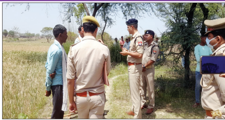
मौके पर उपस्थित पुलिस बल पूछताछ करती