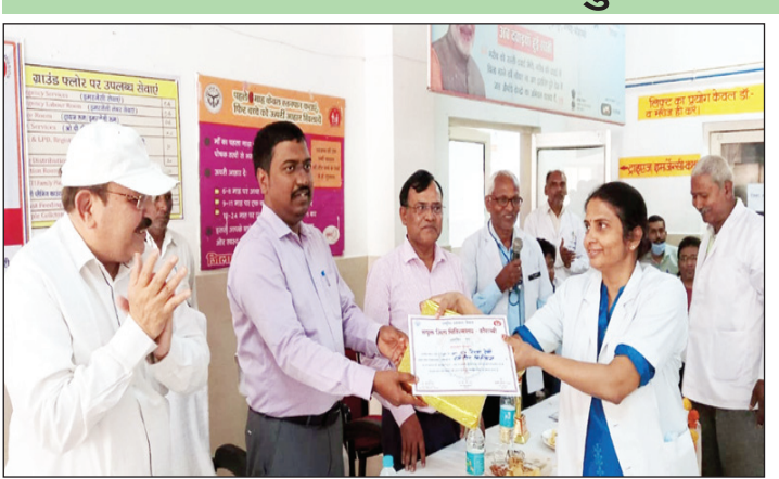
स्वास्थ्य कर्मियों को सम्मानित करते जिलाधिकारी

मरीजों को बेहतर चिकित्सीय सुविधा उपलब्ध कराये जाने के जिलाधिकारी ने दिये निर्देश