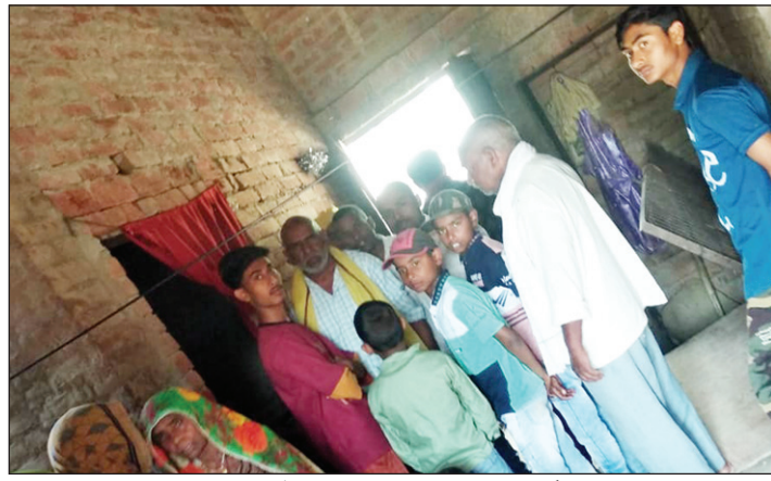
महिला की हत्या के बाद घटनास्थल पर लगी ग्रामीणों की भीड़