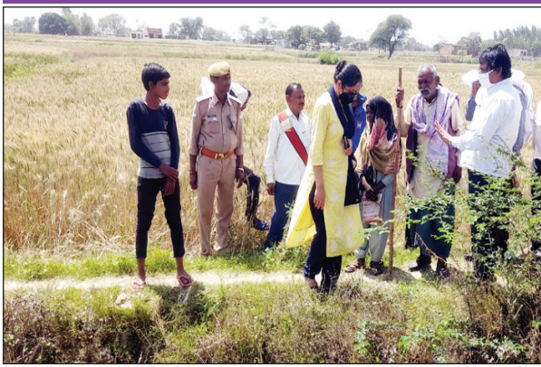
एसपी यमुनापार व एसडीएम बारा पीड़ित को जमीन दिलाते

जसरा में एसपी यमुनापार, एसडीएम बारा की उपस्थिति में पीड़ित को एकबीघा सात बिस्वा जमीन दिलाया गाटा संख्या 509 पर पीड़ित परिवार को दिलाया गया कब्जा, गाटा संख्या 214 की पैमाइस होगी दस दिन बाद