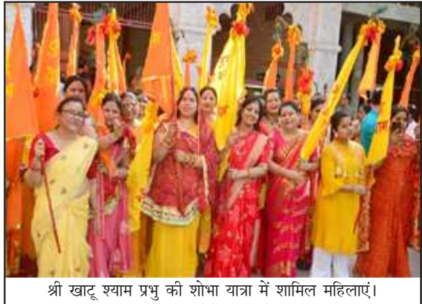
श्री खाटू श्याम प्रभु की शोभा यात्रा में शामिल महिलाएं।

प्रतापगढ़। श्री खाटू श्याम महोत्सव की शोभा यात्रा विगत वर्षों की भांति इस वर्ष भी गोपाल मंदिर से श्याम भक्तों द्वारा निकाली गई। शोभायात्रा में महिलाएं निशान लेकर तथा पुरुष भक्तगण झंडे लेकर शोभायात्रा में आगे आगे चल रहे थे। रास्ते में भक्तों के लिए जगह-जगह स्वागत द्वार बनाया गया था और भक्तों के लिए जगह-जगह जलापान की व्यवस्था नगरवासियों ने की थी। श्याम प्रभु की शोभायात्रा चैक होते हुए किशोरी सदन