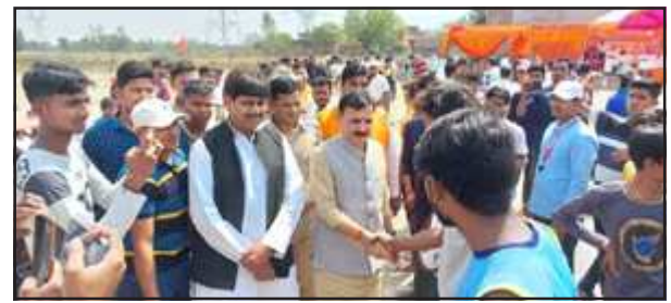
खिलाड़ियों से परिचय प्राप्त करते सांसद विनोद सोनकर।

कुण्डा प्रतापगढ़। सांसद खेल स्पर्धा कार्यक्रम में बुधवार को तीसरे दिन बिहार, कुंडा व कालाकांकर में वालीबाल एवं बाबागंज में खो खो प्रतियोगिता का आयोजन किया गया। कौशाम्बी सांसद, संसदीय आचार समिति लोकसभा के चैयर्मैन, भारतीय जनता पार्टी के राष्ट्रीय सचिव, दादरा नगर हवेली एवं दमन दीव के प्रभारी विनोद सोनकर बुधवार को अपरान्ह 12 बजे बिहार ब्लाक के पुवासी सिया मोड़