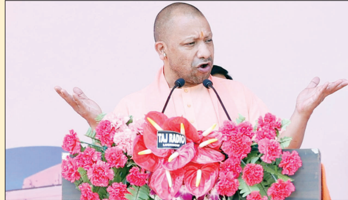
नौकरी व रोजगार मिलेगी। गोरखपुर के निवेश प्रस्तावों को जमीन पर उतारने में लिए भी कई प्रस्ताव हैं। बिना बाधा डाले सबकी सहभागिता होनी चाहिए।

के लिंक एक्सप्रेसवे से जुड़ रहा है। लिंक एक्सप्रेसवे के किनारे बड़े-बड़े उद्योग लगे। धुरियापार इंडस्ट्रियल टाउनशिप में बंजर जमीन खरीद कर उद्योग लगाए जाएंगे। उद्योगों के अनुरूप युवाओं को नौकरी उपलब्ध कराई जाएगी। अब यहां के नौजवानों को रोजगार के लिए बाहर नहीं जाना पड़ेगा। बेटियों को भी यहीं शिक्षा की व्यवस्था होगी।