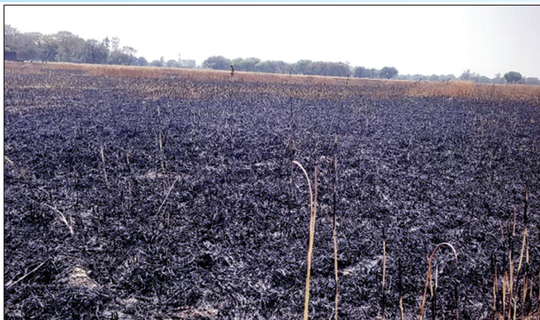
खेत में जली फसल का दृश्य

कौशाम्बी। सिराथू तहसील के ग्रामसभा नारा में बुधवार की दोपहर अचानक किसानों के खेतों में आग लग गयी देखते-देखते तेज लपटों के साथ किसानों के खेत की फसलें जलने लगी चारों ओर हाहाकार मच गया आग की विकरालता बढ़ती जा रही थी सूचना देने के बाद भी अग्निशमन दल के यंत्र मौके पर नहीं पहुंच सके ग्रामीणों ने कड़ी मशकत से आग बुझाना शुरू किया कई घंटे बीत गए लेकिन जिले का कोई अधिकारी भी किसानों की मदद के लिए घटनास्थल पर नहीं पहुंच सका तमाम अधिकारियों के मोबाइल स्वच ऑफ बता रहे थे जिससे अधिकारियों तक सूचनाएं नहीं पहुंच सकी और तमाम अधिकारियों के मोबाइल उनके कर्मचारी लिए घूम रहे थे और साहबों को मीटिंग में बता कर वात करने से इंकार कर रहे थे इससे अग्निकांड की घटना की जानकारी अधिकारियों तक भी नहीं पहुंच सकी अधिकारी पूरे दिन मीटिंग में व्यस्त रहें एक तरफ किसानों के खेत की फसल जलती रही जिससे दर्जनों किसानों को भूखे मरने की नौबत आ गई है लेकिन देर रात तक किसानों का हाल लेने अधिकारी उनके घर नहीं पहुंच