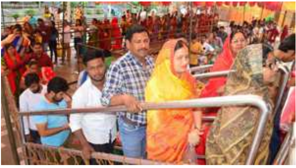
बेल्हा देवी मंदिर में दर्शन करने वाले श्रद्धालुओं की लगी भीड़।

बेल्हा देवी, चौहर्जन व चंदिकन देवी मंदिरों में रही भारी भीड़