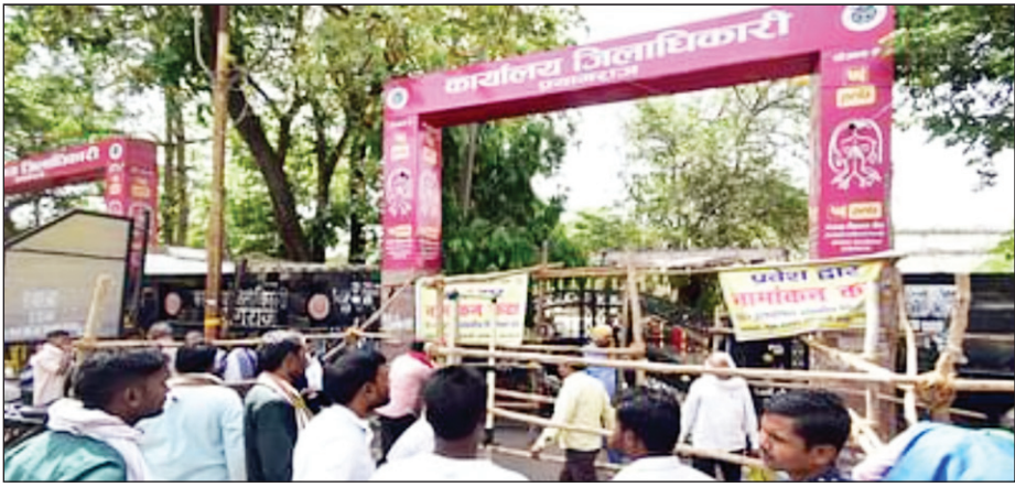
तहर से इस सीट के लिए अब तक नौ शुक्रवार को नौ लोग नामांकन फार्म भी प्रत्याशी नामांकन कर चुके हैं। ले गए। इस तरह से फूलपुर के लिए अब तक 49 लोग फार्म ले जा चुके हैं।