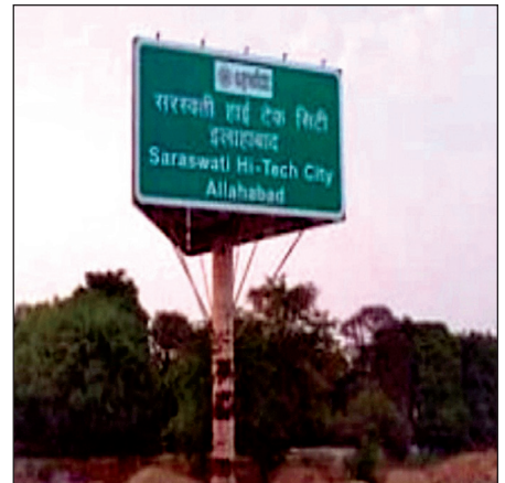
पिलर पर तैयार किया जाएगा। वहीं पुल की समाप्ति पर करीब आधा किलोमीटर का अंडर पास होगा। ऐसे में फ्लाईओवर के निर्माण से यातायात सुगम हो जाएगा। इसके अलावा हाईटेक सिटी के निवासियों को किसी प्रकार की परेशानी का सामना नहीं करना पड़ेगा।

नैनी। नैनी स्थित सरस्वती हाईटेक सिटी में मिर्जापुर रोड के पास। महाकुंभ- 2025 के तहत नैनी और फूलपुर में बन रही इनरिंग रोड पर नैनी की तरफ एक नए फ्लाईओवर का निर्माण शुरू हो गया है। यह फ्लाईओवर नैनी स्थित सरस्वती हाईटेक सिटी में मिर्जापुर रोड के ऊपर बनाया जा रहा है। इसकी लंबाई 1.1 किलोमीटर होगी। इस फ्लाईओवर के निर्माण से हाईटेक सिटी को किसी प्रकार की हानि नहीं होगी। इसके अलावा लोगों को यातायात में काफी सहूलियत मिलेगी। वहीं प्लाईओवर का निर्माण दिसंबर 2024 तक पूरा होना है। दरअसल इनरिंग रोड के निर्माण में सरस्वती हाईटेक सिटी का निम्माण कर रही यूपीसीडी की तरफ से आपत्त दाखिल की गई थी। उसका कहना था कि इनरिंग रोड के निर्माण से हाईटेक सिटी दो खंडों में बंट जाएगी। इसकी वजह से काफी नुकसान होगा। वहीं इस आपत्ति पर भारतीय राष्ट्रीय राजमार्ग प्राधिकरण ने एक सिक्स लेन पुल का प्रस्ताव साल की शुरूआत में भेजा था, जिसे आचार संहिता लगने से पहले ही मंजूरी मिल गई। जिसके बाद फ्लाईओवर का निर्माण शुरू कर दिया गया। यह फ्लाईओवर सरस्वती हाईटेक सिटी के ऊपर से होकर गुजरेगा। यह पुल सिंगल