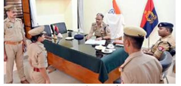
पुलिस लाइन में अर्दली रूप करते एसपी।