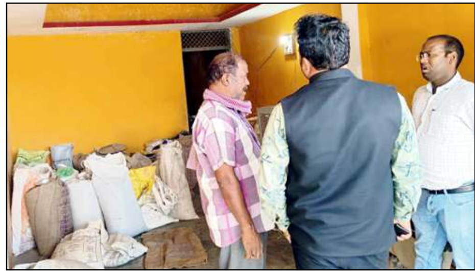
गैर लाइसेंसी गल्ला दुकान की जांच करते एसडीएम।