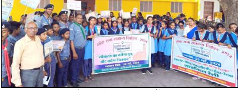
रैली निकालते स्काउट व एनसीसी कैडेट।

चित्रकूट। लोकसभा चुनाव को आयोग की निर्धारित मतदान तिथि 20 मई को 70 फीसदी से अधिक मतदान के लक्ष्य पाने को जिला निर्वाचन अधिकारी/जिलाधिकारी अधिकार आनंद व नोडल अधिकारी स्वीप/सीडीओ अमृतपाल कौर के निर्देश पर मतदाता जागरूकता को स्काउट गाइड, रोवर रेंजर्स व एनसीसी की संयुक्त भव्य साइकिल रैली निकाली। शुक्रवार को मतदाता जागरूकता साइकिल रैली पटेल तिराहा से शुरू