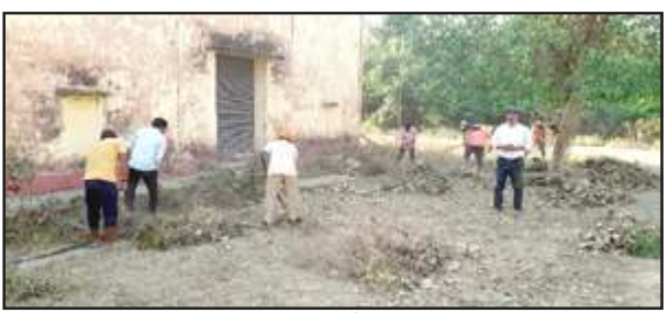
मतगणना स्थल की सफाई करते नगर पालिका कर्मचारी।

आज पहले दिन पूरे परिसर में उगी घासों को फावड़े से काटकर हटाया गया। यह जानकारी देते