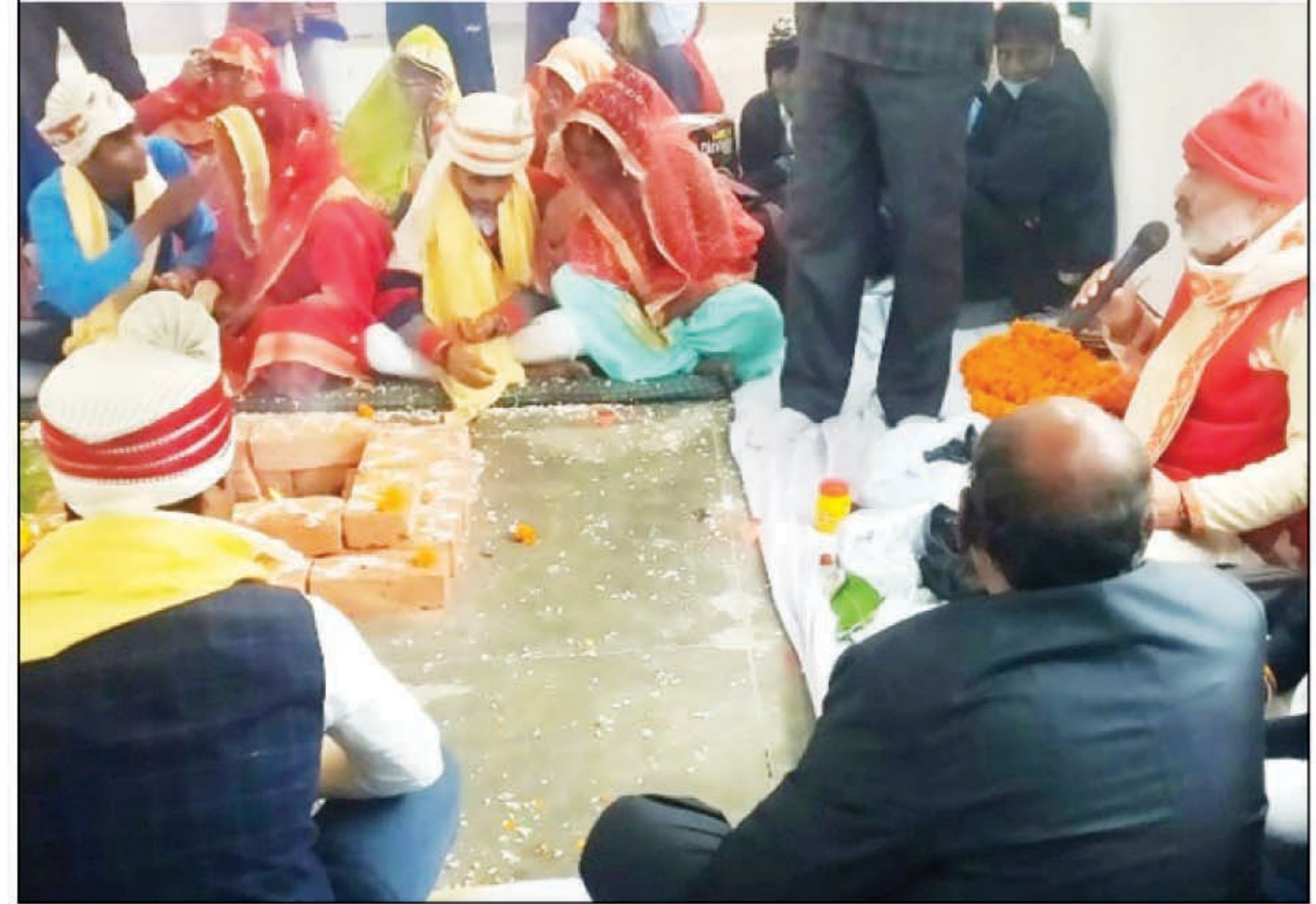
वैदिक मंत्रोच्चार के साथ परिणय सूत्र में बंधते वर-वधु

शंकरगढ़। यमुनापार के विकास खंड शंकरगढ़ परिसर में मंगलवार को सामूहिक विवाह का आयोजन किया गया, जिसमें पांच जोड़ों का एक साथ विवाह संपन्न करवाया गया। ब्लाक प्रमुख की मौजूदगी में सरकार की तरफ से सभी जोड़ों को नये जीवन की बधाई देने के साथ सरकार की तरफ से उपहार भी प्रदान किया गया।