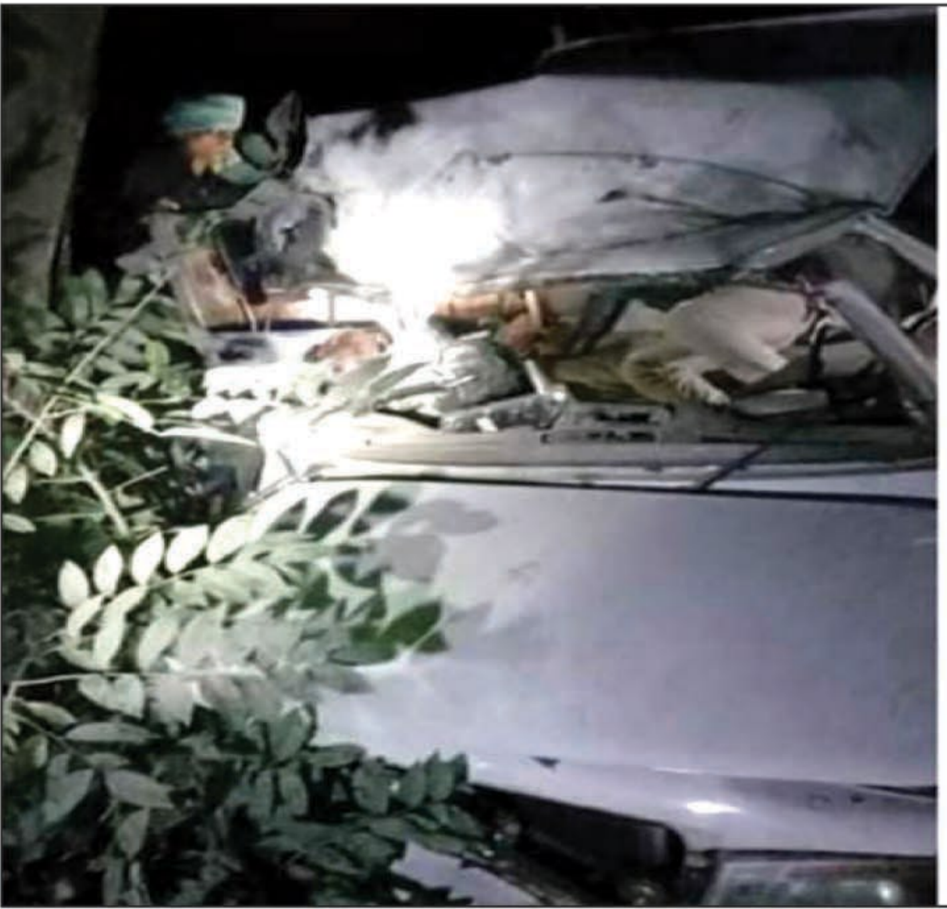
अनियंत्रित बोलैरो पेड़ से टकराने के बाद हुई क्षतिग्रस्त