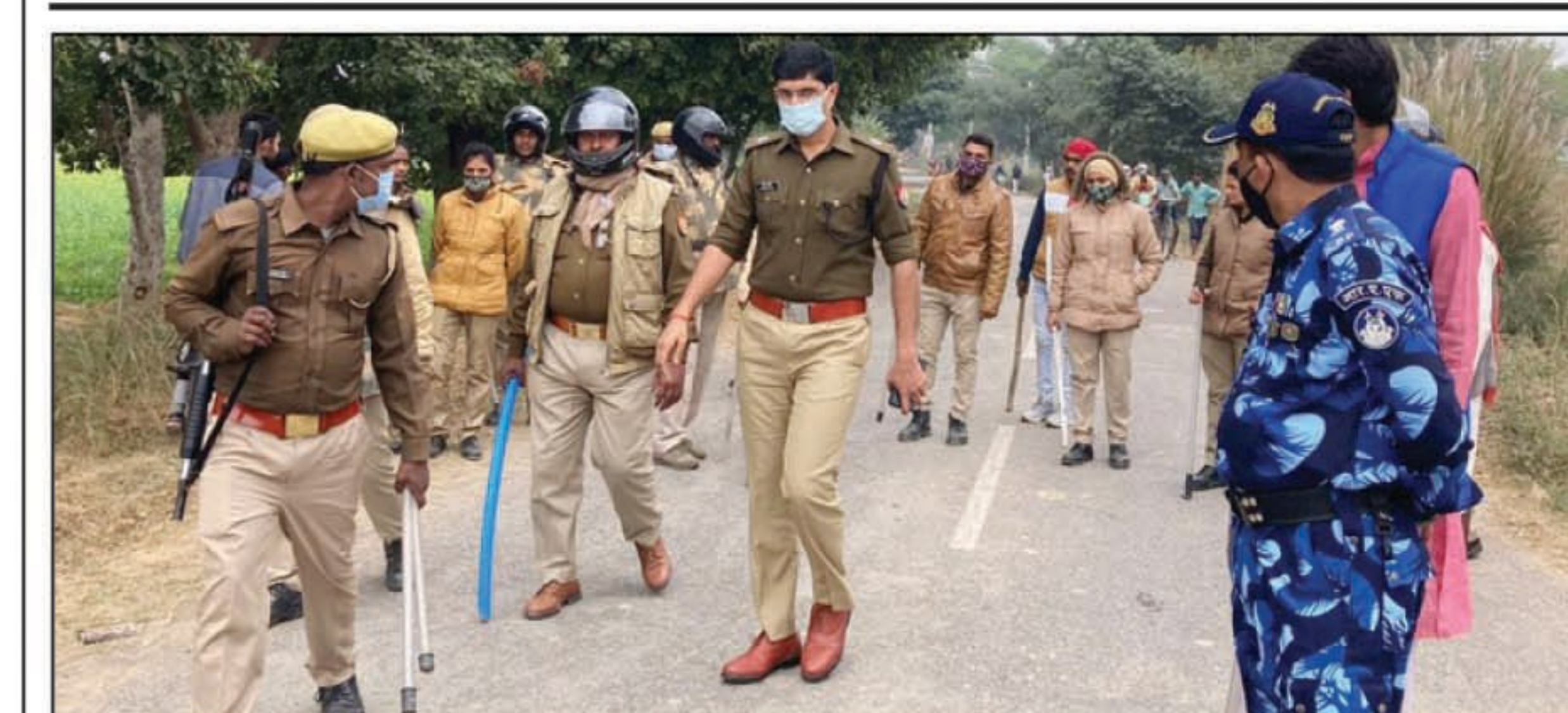
सूचना के बाद मौके पर पहुंचे एसपी यमुनापार

लालापुर। सोमवार को किसानों के समर्थन व अपनी मांगों को लेकर सैकड़ों की संख्या में लाल सलाम के कार्यकर्ता लालापुर थाने पहुंच गए सैकड़ों की संख्या देख थानाध्यक्ष लालापुर ने अधिकारियों को तुरंत अवगत कराया कुछ ही देर में एसपी यमुनापार क्षेत्राधिकारी बारा,शंकरगढ़ थाने की फोर्स के साथ पहुंच गए और आपनी मांगों व अभिलिया तरहार मजदूरों अल्पसंख्यक समाज के लोगों के लिए दमनकारी बताया व उन्होंने पुलिस की बदसलूकी का जम कर विरोध किया। अली अली यही नहीं रुके उन्होंने खाद पानी बिजली की मार झेल रहे किसानों के अनाज के गिरते दामों पर व काला बाजारी पर भी उंगली उठाई। वहीं पुलिस की तमाम घेरा बंदी के बावजूद भी किसान बिल के विरोध में समाजवादी पार्टी कई दर्जन कार्यकर्ता जिला कचहरी पर नियोजित आंदोलन में पहुंचने में सफल रहे।