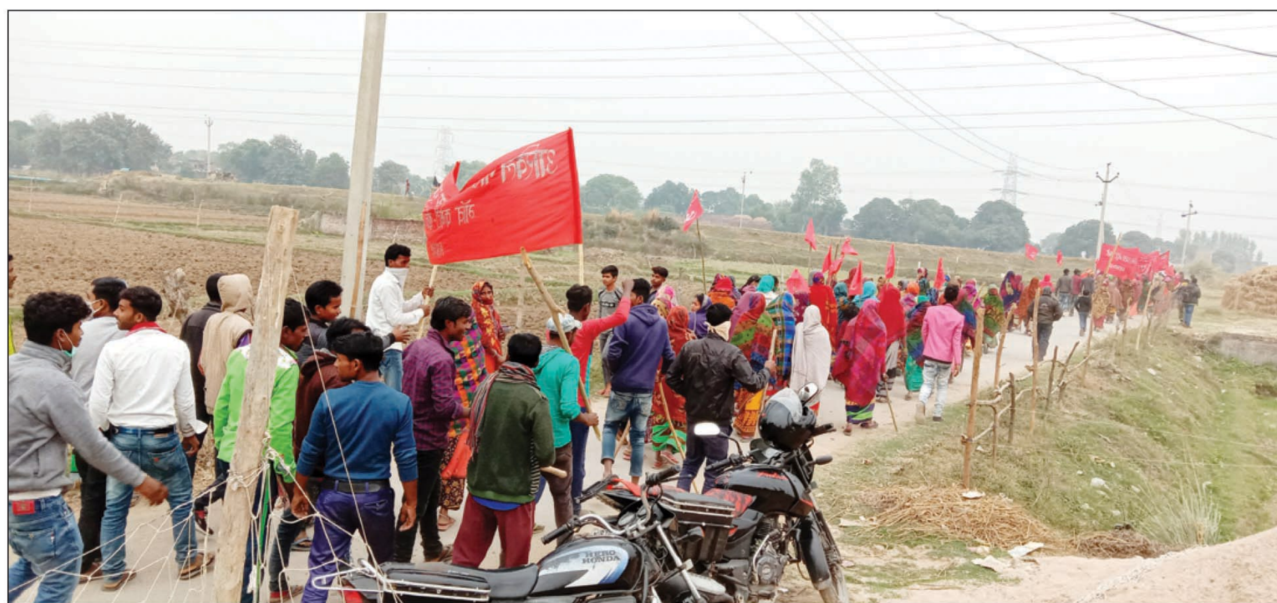
गिरफ्तार किसान नेताओं की रिहाई के लिए जुलूस निकालते आक्रोशित किसान व मजदूर तथा जुलूस में शामिल महिलाओं को समझाने का प्रयास करती पुलिस