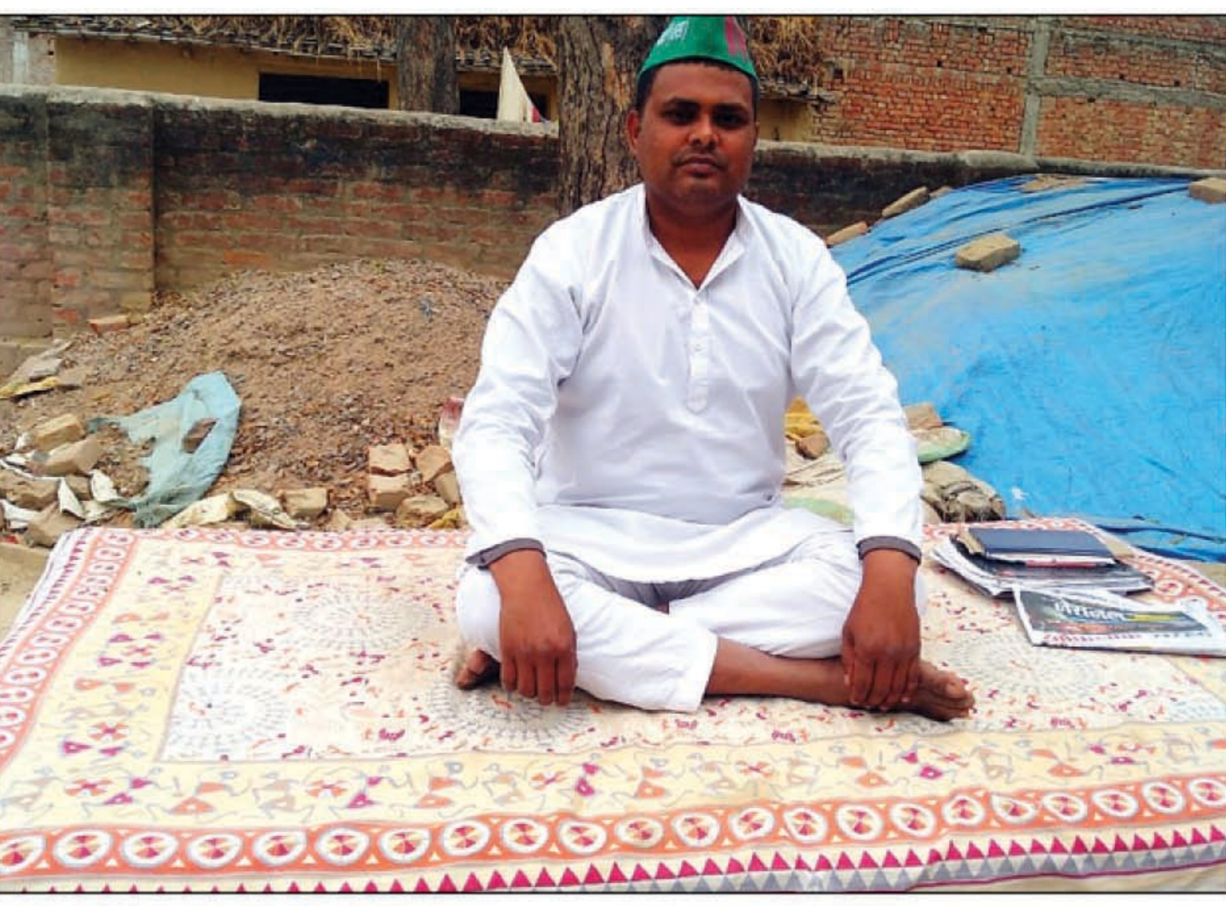
एक दिवसीय अनशन पर बैठे राष्ट्रीय प्रवक्ता।