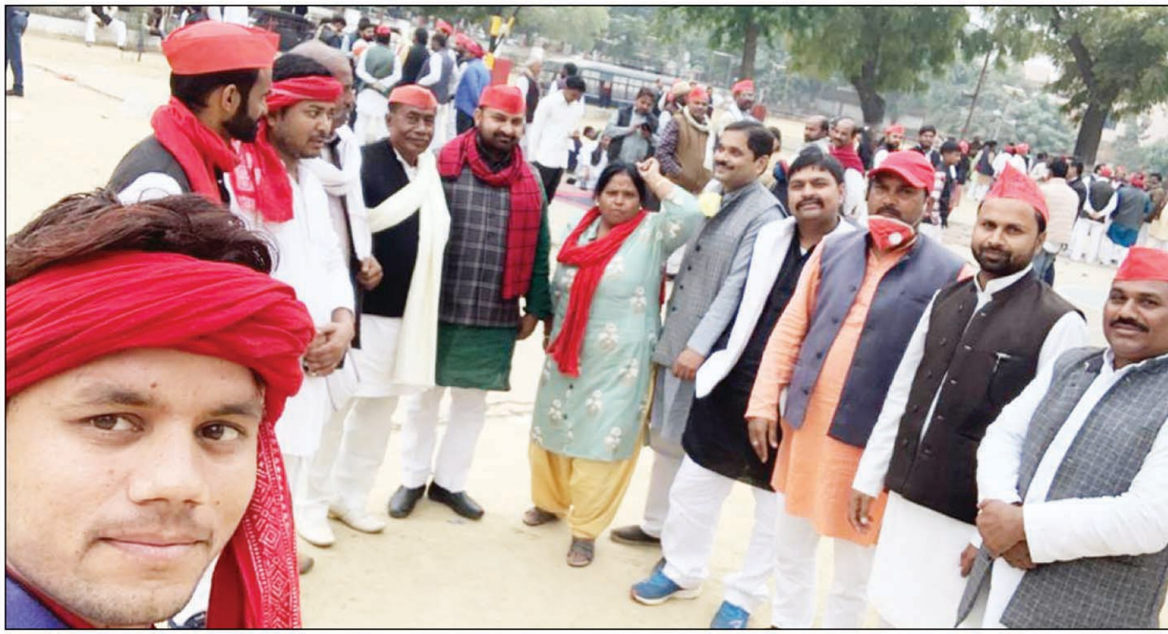
धरने में शामिल सपाई