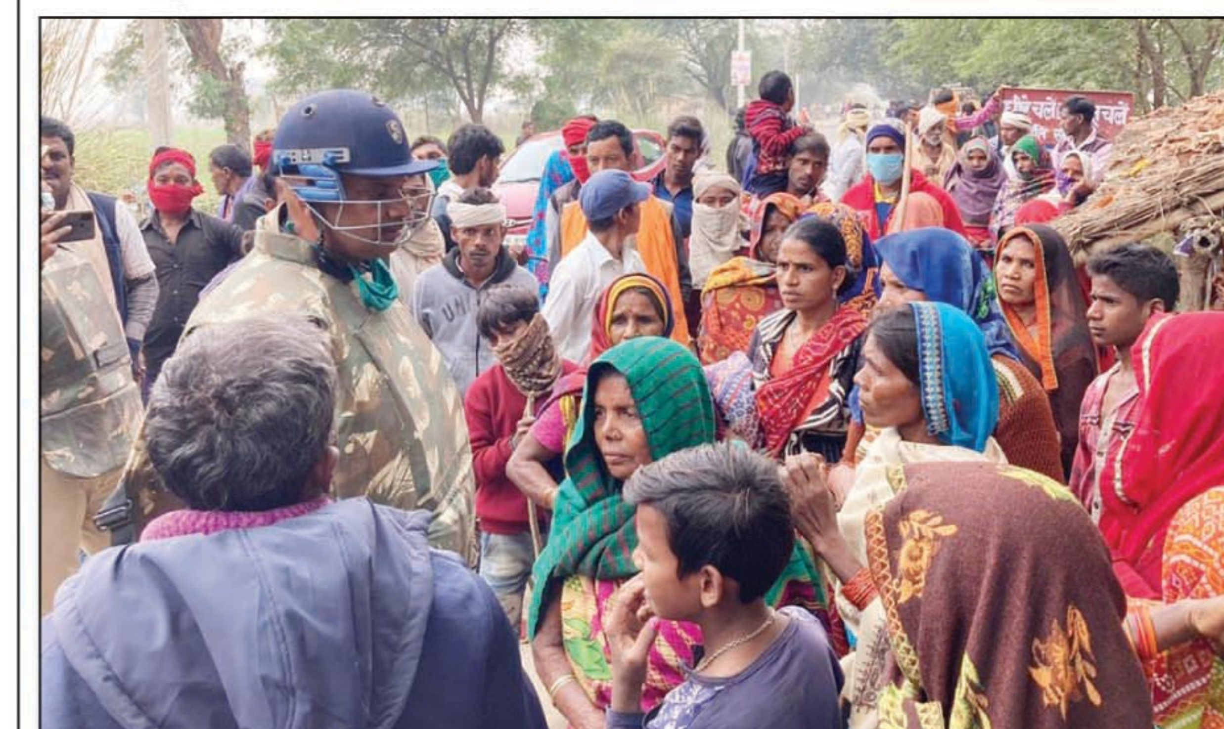
लाल सलाम के कार्यकर्ताओं को समझाती पुलिस