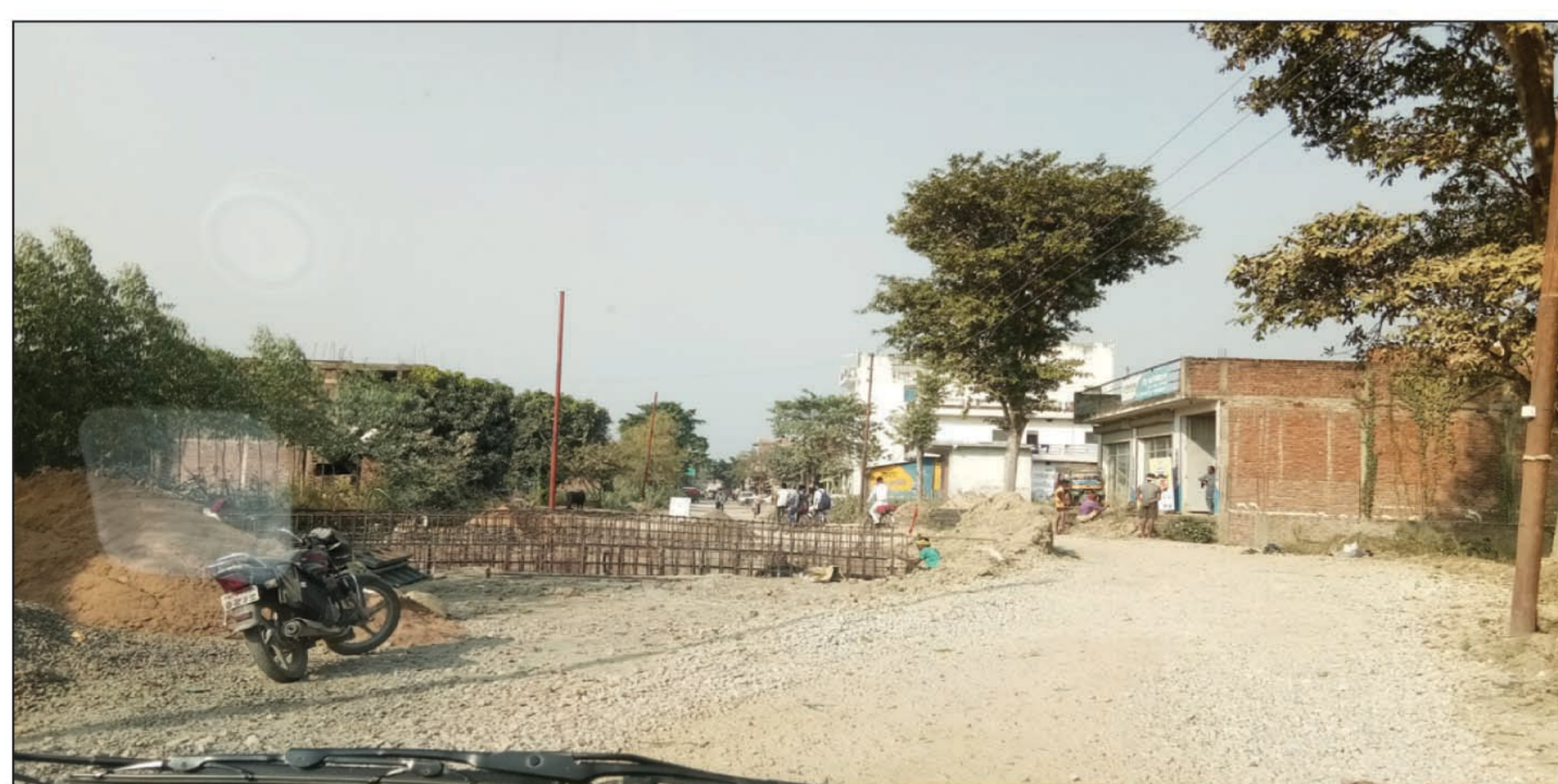
केडी मुख्य स्टेट हाइवे मार्ग अद्यवस्था का शिकार दृश्य

बताते की उक्त मुख्य मार्ग कोराव से महुली रंगनाथ संसारपुर चौराहा तक चौड़ी करण हो रही है, लेकिन निर्माण कार्य दार्इ संस्था कॉन्ट्रैक्टर निर्माण कार्य में प्रयोग होने वाले सामग्री ही नहीं परचेजिंग कर पा रहा। और जो निर्माण कार्य भी हो रहा वह घटिया किस्म का हो रहा। लोग धूल भारी जंजीगी गुजारने को बिबस हैं। कई बार शिकायत विभागीय व शासन स्तर पर की गई किन्तु कोई अमलीजामा नहीं