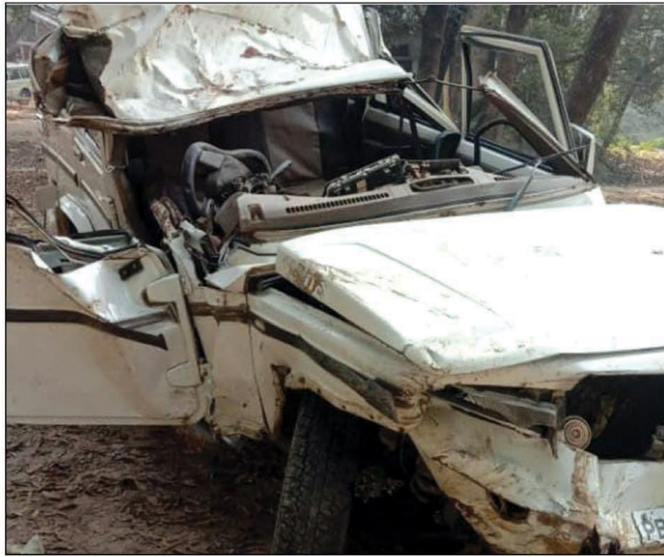
दुर्घटना के बाद इस तरह चकनाचूर बोलैरो

मांनों पहाड़ टूट पड़ा। टक्कर इतनी भीषण थी कि बोलैरो को काटकर लोगों को निकाला गया।