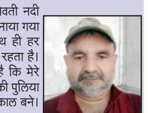
शहजादे ग्राम प्रधान अल्हावा कोरांव, प्रयागराज

की पुलिया को यदि ऊंचाई में नहीं बनाया गया तो आवागमन ठप रहता ही है, साथ ही हर साल कोई न कोई जन से जाता ही रहता है। इस लिए जिला प्रशासन से मांग है कि मेरे ग्राम सभा छेत्र में स्थित सेवती नदी की पुलिया ऊंची बनाई जाए, इसका स्टीमेट तत्काल बने।