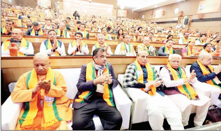
चुनावी रण में भाजपा की कमान संभालेंगे नड्डा

प्रधानमंत्री मोदी ने भाजपा नेताओं को नसीहत भी दी। उन्होंने कहा कि मुस्लिम समाज के बारे में गलत बयानबाजी न करें। कई के बयान अमर्यादित होते हैं। ऐसा नहीं करना चाहिए। किसी भी जाति-संप्रदाय के खिलाफ बयान नहीं देना चाहिए। प्रधानमंत्री ने चुनाव को लेकर यह भी कहा कि हमें सक्रिय रहना है और आत्मविश्वास नहीं होना है। कोई यह नहीं समझें कि मोदी आएगा और जीत दिला देगा। हमें इस मानसिकता से बाहर निकलना होगा। प्रधानमंत्री ने राजस्थान और छत्तीसगढ़ का जिक्र करते हुए यह भी कहा कि पिछली बार हम अतिआत्मविश्वास के कारण हार गए थे। इस बार हमें इससे बचना होगा। लोगों के बीच रहना होगा और मिलकर मेहनत करनी होगी।