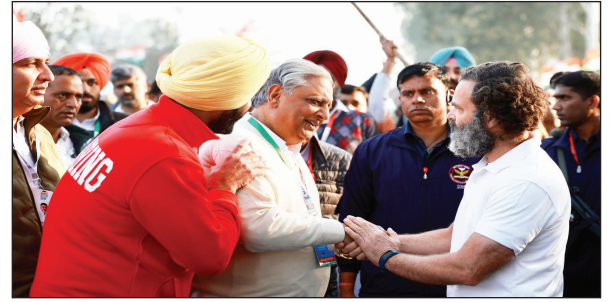
को लेकर भी सवाल पूछा गया था। इस पर राहुल ने अपना जवाब दिया।

नई दिल्ली: भाजपा सांसद वरुण गांधी क्या कांग्रेस में शामिल होंगे। इसको लेकर कांग्रेस के पूर्व अध्यक्ष राहुल गांधी ने बड़ा बयान दिया है। राहुल ने कहा कि वरुण की विचारधारा अलग है और मेरी विचारधारा अलग है। उन्हें यहां दिक्कत होगी। गौरतलब है कि राहुल गांधी की भारत जोड़ो यात्रा मंगलवार को पंजाब के होशियारपुर पहुंची। इस दौरान उन्होंने पत्रकारों के साथ बातचीत की। पत्रकारों ने राहुल से कई सवाल किए। राहुल से वरुण गांधी की कांग्रेस में एंट्री