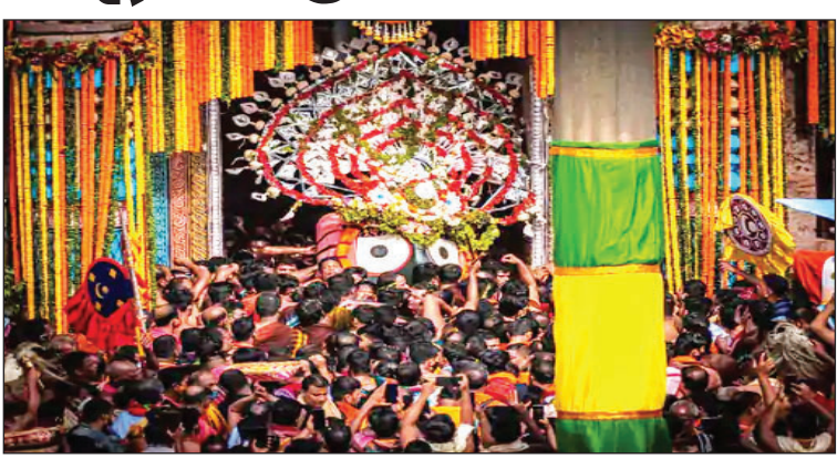
देगे। चूहे ही नहीं, बिच्छू भी हैं। हम उन्हे बाहर निकालने की व्यवस्था करेंगे। हमें मंदिर के अंदर जानवरों को मारने या जहर देने की