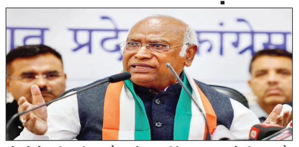
फीसदी से अधिक हिस्सा है। वहीं आधी आवादी के पास सिर्फ तीन फीसदी ही हिस्सा बचा है। उन्होंने कहा कांग्रेस देश में बढ़ रही

खड़गो ने मंगलवार को ट्वीट कर कहा कि भाजपा ने आर्थिक असमानता की खाई को इतना गहरा कर दिया है कि देश का आम इंसान उसमें धंसता जा रहा है। भारत में सबसे अमीर एक फीसदी लोगों के पास देश की कुल संपत्ति का 40