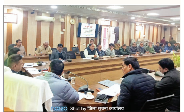
श्रीरंगपुर में गौवंशों के रख-रखाव के लिए विशेष सचिव का बैठक।

श्रीरंगपुर में गौवंशों के रख-रखाव के लिए विशेष सचिव का बैठक। विशेष सचिव ने स्पष्ट निर्देश दिए कि गौ आश्रय स्थल एवं गौवंशों के रख-रखाव की मंगलवार को समीक्षा की। उन्होंने निर्देश दिए कि गौवंशों की सदी से बचाव के लिए पुआल एवं बारदाना आदि बैठने के लिए पर्याप्त मात्रा में डाला जाये, साथ ही लाइट आदि की व्यवस्था भी सुनिश्चित की जाये। उन्होंने सभी संबंधितों को निर्देशित किया कि शासन द्वारा जारी दिशा निर्देशों का पूरी इमानदारी के साथ पालन करते हुए गौवंशों को गौशाला में सुरक्षित रखा जाये। इसमें किसी भी स्तर पर बरती गई लापरवाही अनियमितता के लिए संबंधित को जिम्मेदारी निर्धारित करते हुए उसके विरुद्ध कार्रवाई की जाएगी। उन्होंने अधिकारियों को निर्देश दिए कि गौ आश्रय स्थलों का सतत निरीक्षण किया जाए और निरीक्षण टिप्पणी