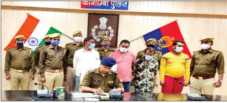
पुलिस गिरफ्तार की में गांजा तस्क़र

22 किलो 600 ग्राम गांजा तीन मोबाइल फोन रुपए व चार पहिया वाहन किया गया बरामद