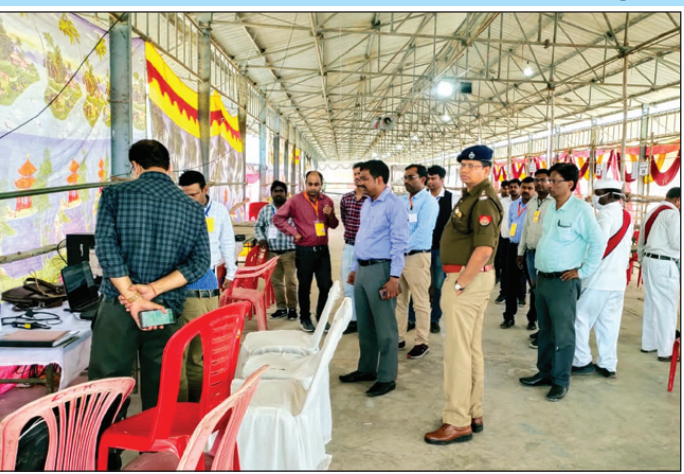
मतगणना स्थल का निरीक्षण करते डीएम एसपी व अन्य

मतगणना को शांतिपूर्ण पारदर्शी एवं सुरक्षा व्यवस्था के बीच कराये सम्पन्न