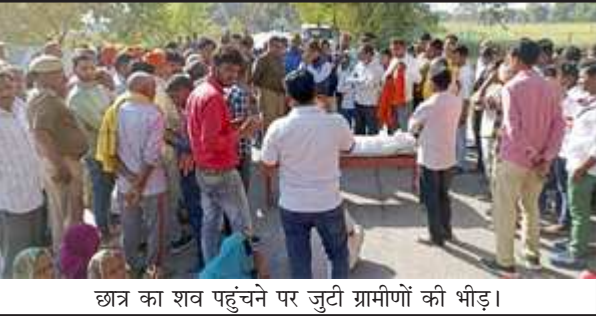
छात्र का शव पहुंचने पर जुटी ग्रामीणों की भीड़।