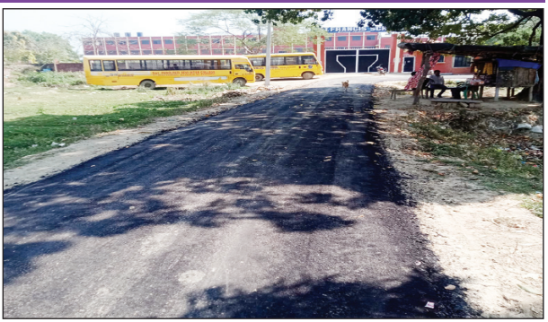
बनी सड़क का दृश्य

भरवारी कौशाम्बी। जनपद के बेरुआ गाँव स्थित सेंट फ्रांसिस इंग्लिश मीडियम स्कूल के ठीक सामने सड़क गड्ढे में तब्दील हो गई थी जिसकी वजह से आय दिन स्कूली बच्चों को गड्ढे भरी सड़कों पर गिरकर घायल हो जाया करते थे अखंड भारत संदेश के पत्रकार ने खबर को अखबार में प्रमुखता से प्रकाशित किया था। जिसके चलते बच्चों के अभिभावकों में भी जबर्दस्त आक्रोश था इसी बीच