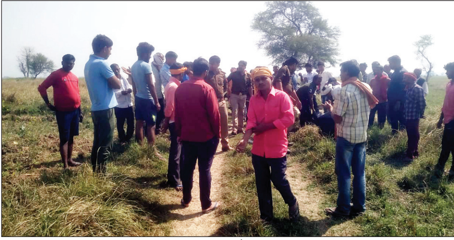
घटनास्थल पर मौजूद भीड़