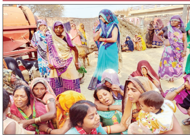
मौत के बाद रोते बिलखते परिजन

छह दिन बीत जाने के बाद भी अपहरणकर्ताओं को पकड़ने में नाकाम रही पिपरी पुलिस, आक्रोशित परिजनों ने पिपरी पुलिस के ऊपर आरोपियों को संरक्षण देने का लगाया आरोप