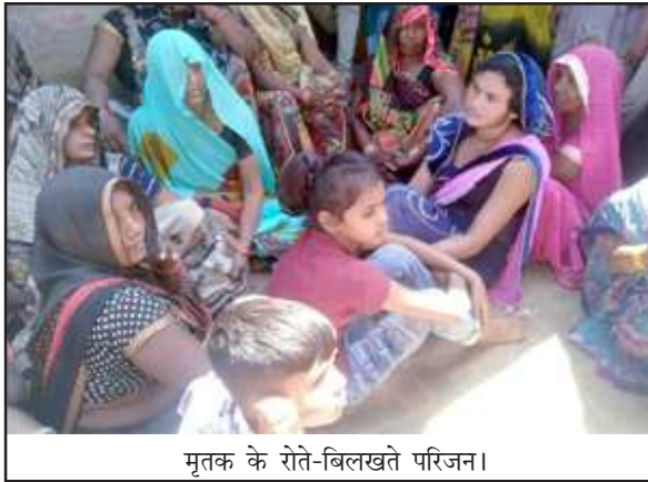
मृतक के रोते-बिलाखते परिजन।