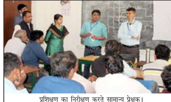
प्रशिक्षण का निरीक्षण करते सामान्य प्रेक्षक।

जिला निर्वाचन अधिकारी एवं सामान्य प्रेक्षक द्वारा किया गया निरीक्षण