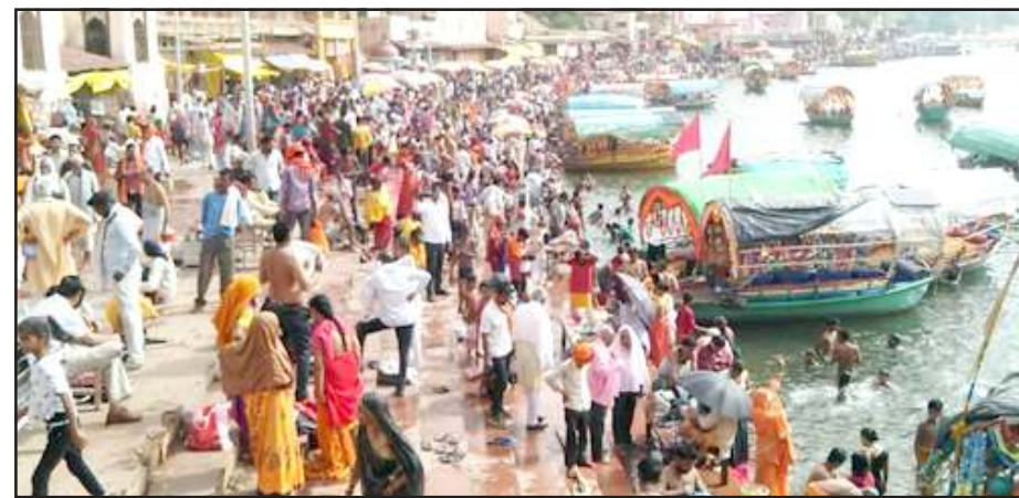
अमावस्या मेला में मन्दाकिनी में स्नान करते श्रद्धालु।

गुरुवार को बरगदी अमावस्या पर श्रद्धालुओं का तांता सवरे से रामघाट में उमड़ पड़ा। लाखों श्रद्धालुओं ने एक साथ डुबकी लगाकर कामतानाथ के दर्शन कर परिक्रमा लगाकर धर्मनगरी के जानकीकुण्ड, अनुसुइया आश्रम, हनुमानधारा, भरतकूप आदि के दर्शन किये।