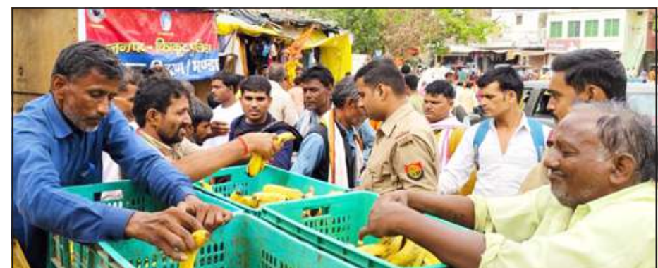
श्रद्धालुओं को केला बांटी पुलिस।