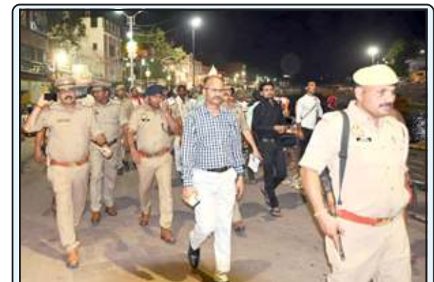
मेला क्षेत्र में भ्रमण करते पुलिस अधीक्षक।