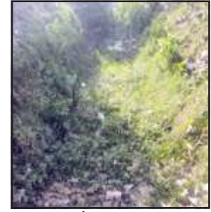
अरखा रजबहा में पानी की जगह उड़ रही धूल।

उनकी धान की नर्सरी पड़ गयी जो किसान नहर का पानी व ईश्वर के पानी के भरोसे है वह पानी का इंतजार कर रहे हैं जब कि 1 जून से 25 जून के अंदर धान की नर्सरी तैयार होकर खेतों में लग जानी चाहिए लेकिन अभी तक नहर में पानी न छोड़े जाने से किसान परेशान दिखाई पड़ रहे हैं नहर व ऊपर वाले से पानी की आस लगाकर