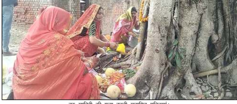
वट सावित्री की पूजा करती सुहागिन महिलाएं।

महिलाओं ने बरगद के पेड़ के नीचे बैठकर वट सावित्री की पूजन अर्चन के बाद ही जल ग्रहण