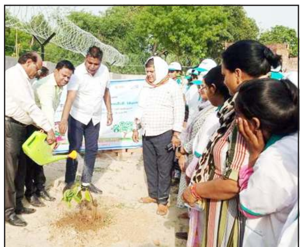
पर्यावरण दिवस पर पौधरोपण करते अतिथिगण।

इनके द्वारा पर्यावरण संरक्षण पर गोष्ठी के रूप में प्रेरणादायक