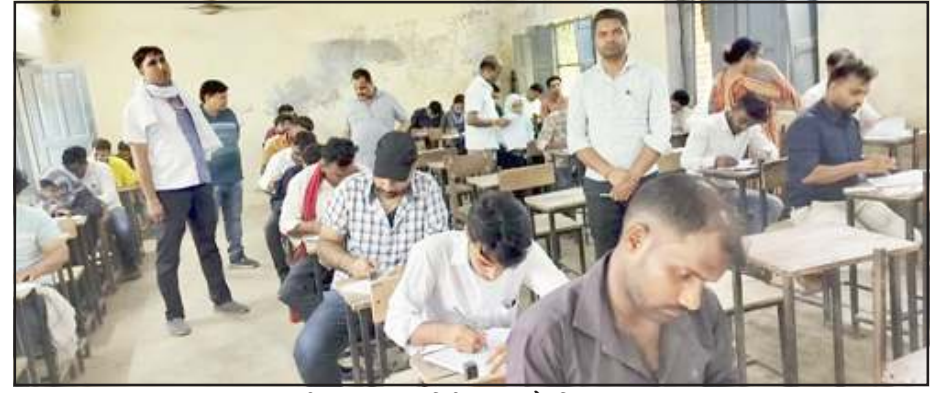
परीक्षा कक्ष का निरीक्षण करते शिक्षकगण।

आंतरिक सचल दल ने मुख्य द्वार एवं कमरों में ली तलाशी, आज की परीक्षा में 24 परीक्षार्थी अनुपस्थित रहे