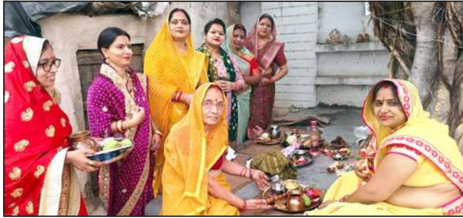
बरगद पेड़ की पूजा करती महिलाएँ।

ये जानकर भी सावित्री ने फैसला नहीं बदला। एक वर्ष बाद जब यमराज सत्यवान के प्राण लेकर जाने लगे तो सावित्री भी साथ जाने लगी। सावित्री की सत्यता व पतिव्रता से प्रभावित होकर यमराज ने सत्यवान को जीवन दान दिया। माता-पिता की आखे व पुनः राजा बनने का वरदान