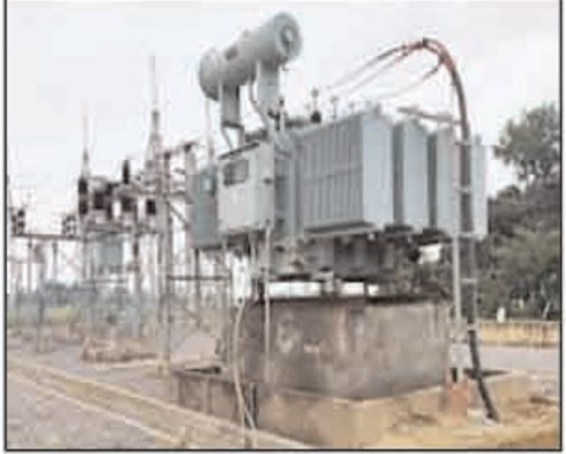
फेडरेशन के अध्यक्ष शैलेंद्र दुबे ने बताया कि केंद्र सरकार विद्युत विधेयक में संशोधन करके जरिये बिजली सेक्टर में निजीकरण की तैयारी कर रही है। इससे बिजली कर्मियों और अभियंताओं में भारी

रायपुर, राज्य ब्यूरो। छत्तीसगढ़ में सरकारी बिजली कंपनी के इंजीनियर और कर्मचारियों ने मंगलवार को काली पट्टी लगाकर काम किया। डंगनिया स्थित मुख्यालय से लेकर सब स्टेशनों तक दोपहर में भोजनावकाश के दौरान उन्होंने नरिबाजी कर विरोध प्रदर्शन भी किया। बिजली कर्मचारियों और इंजीनियरों की राष्ट्रीय समन्वय समिति के आह्वान पर छत्तीसगढ़ के साथ ही देशभर के बिजली कर्मचारियों ने मंगलवार को विरोध दर्ज कराया। अखिल भारतीय पावर इंजीनियर्स