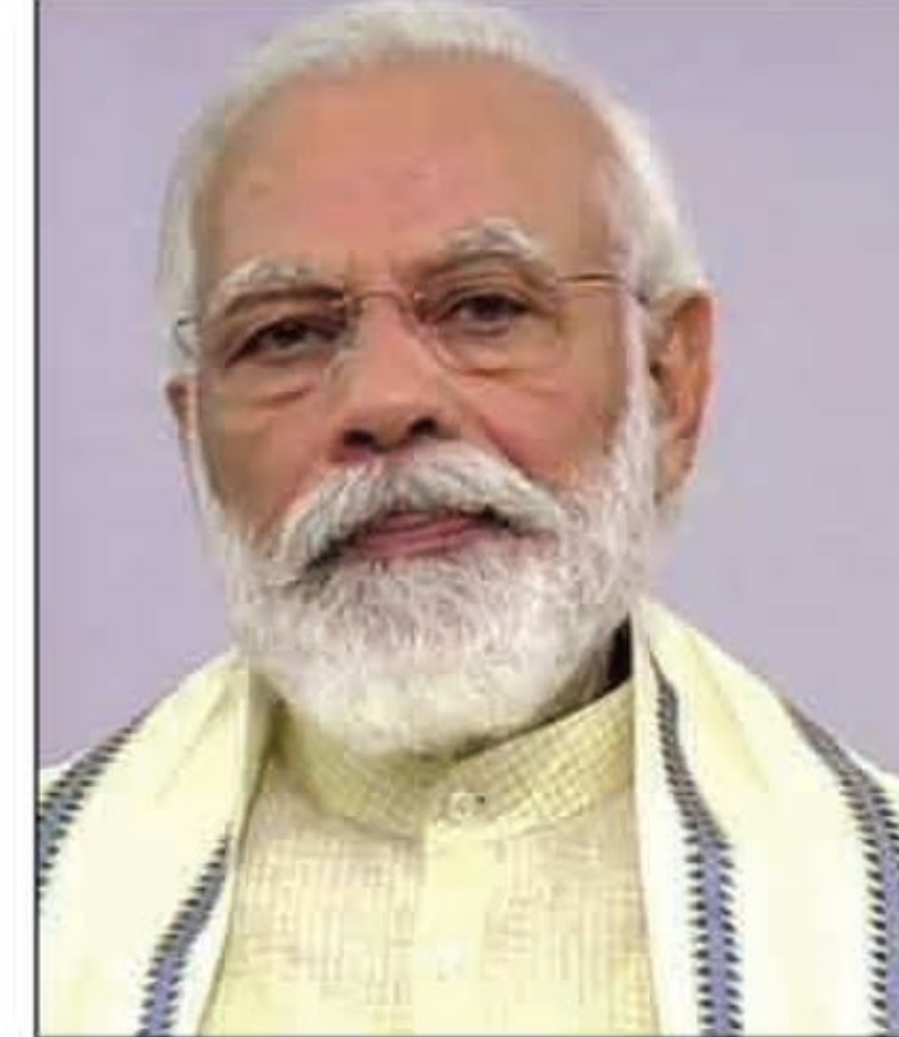
भारत के सबसे स्वच्छ शहर बनने की दिशा में शहरों के बीच स्वस्थ प्रतिस्पर्धा की भावना पैदा हुई। MoHUA ने जनवरी 2016

कहा कि वह इस अवसर पर स्वच्छ सर्वेक्षण 2020 के परिणाम डैशबोर्ड पर लॉन्च करेंगे। स्वच्छ सर्वेक्षण 2020 दुनिया का सबसे बड़ा स्वच्छता सर्वेक्षण है, जिसने कुल 4,242 शहरों, 62 छावनी बोर्डों, और 92 गंगा शहरों की रैंकिंग की और 1.87 करोड़ नागरिकों ने भागीदारी की। यह आयोजन भारत सरकार के आवास और शहरी मामलों के मंत्रालय (MoHUA) द्वारा आयोजित किया जा रहा है। स्वच्छ सर्वेक्षण को सरकार द्वारा बड़े पैमाने पर नागरिक भागीदारी के उद्देश्य के साथ पेश किया गया था, इससे