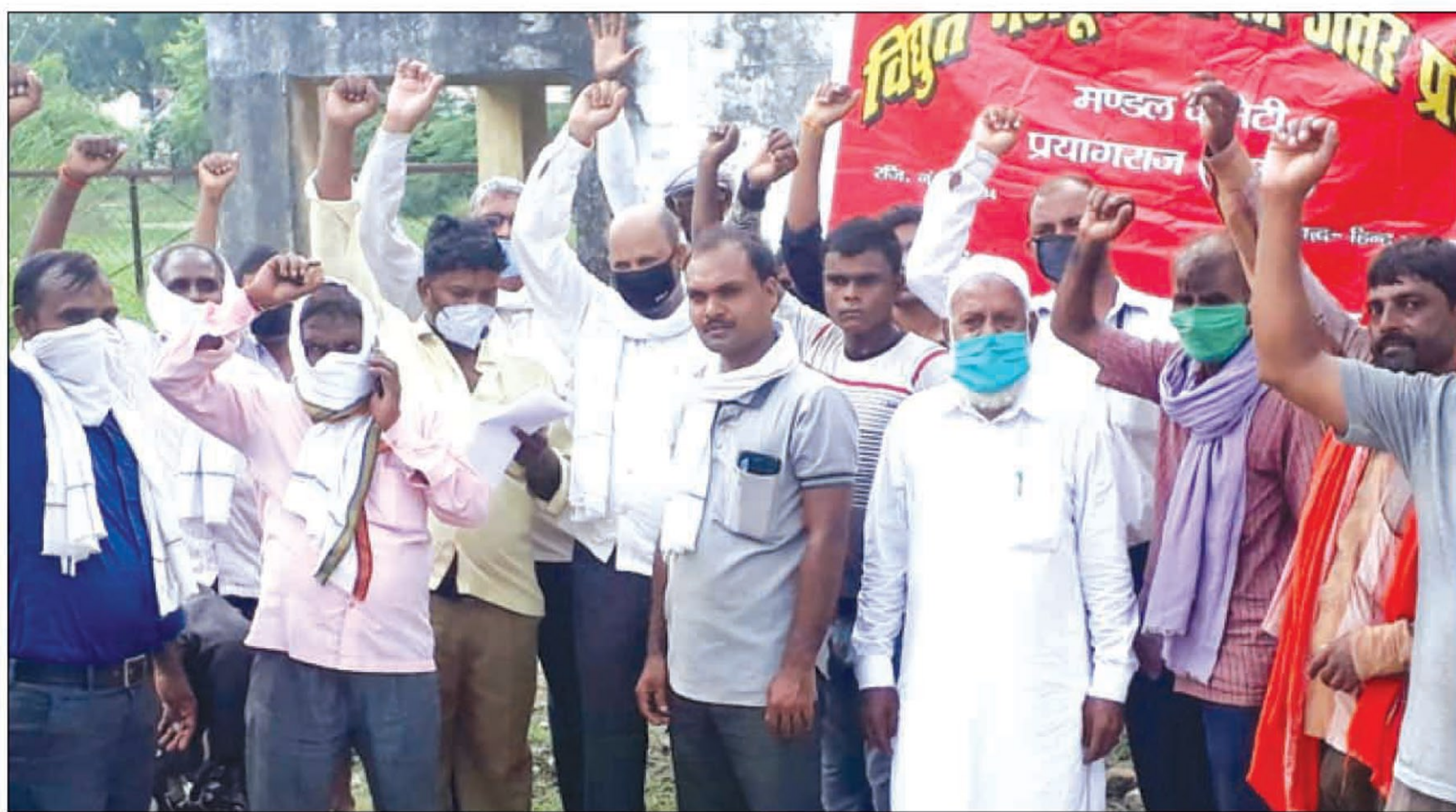
हंडिया बिजली दफ्तर पर प्रदर्शन करते कर्मचारी