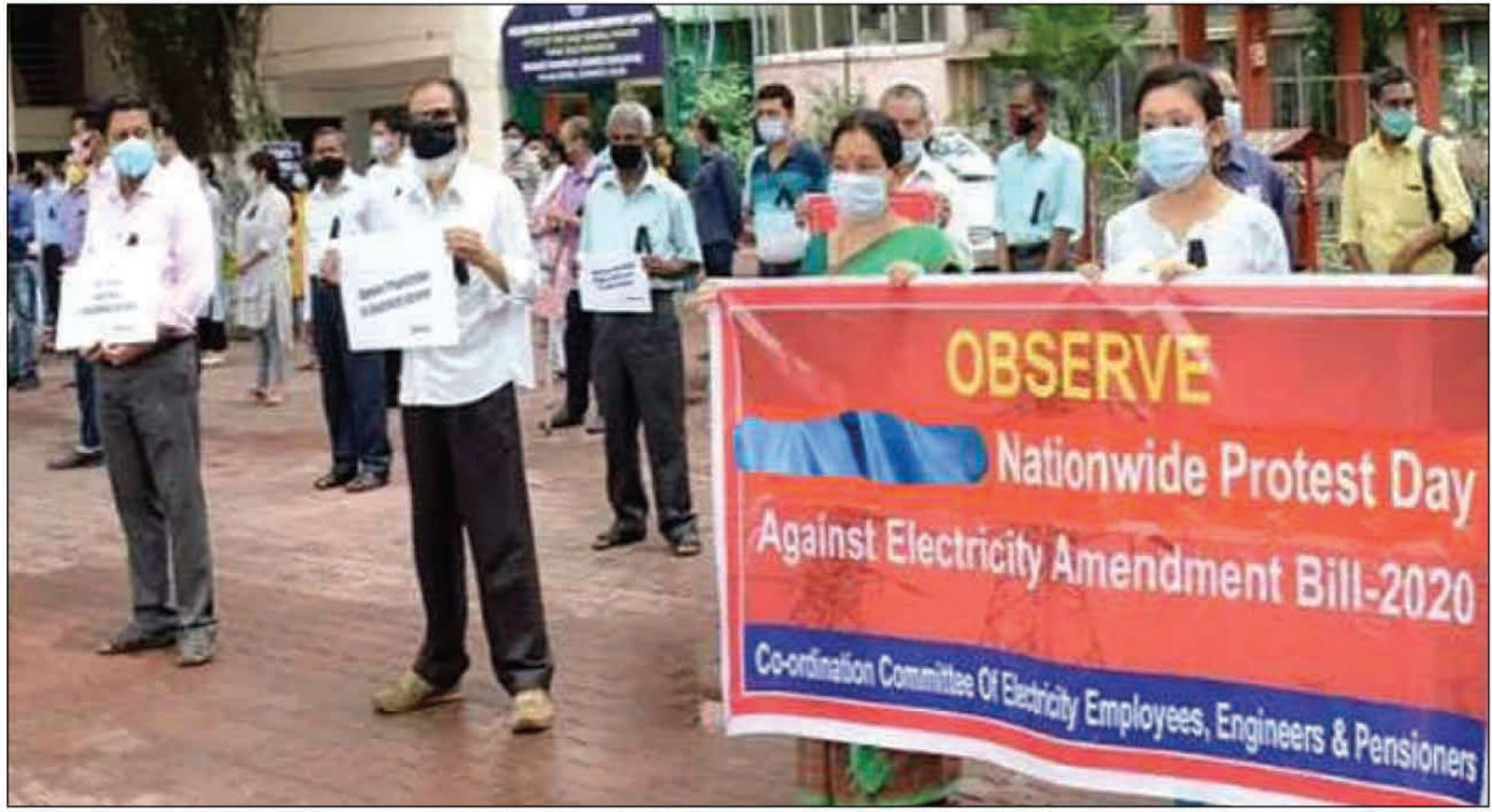
उड़ीसा में बिजली के निजीकरण को लेकर प्रदर्शन करते लोग

गुस्सा है। उन्होंने कहा कि विरोध प्रदर्शन से भी केंद्र सरकार विधेयक में बदलाव नहीं करती है तो फिर से आंदोलन किया जाएगा। बिजली इंजीनियरों के अनुसार निजीकरण का यह प्रयोग ओडिशा, दिल्ली, ग्रेटर नोएडा, औरंगाबाद, नागपुर, जलगांव, आगरा, उज्जैन, ग्वालियर, सागर, भागलपुर, गया, मुजफ्फरपुर आदि कई स्थानों पर पूरी तरह से विफल साबित हुए हैं। इसके बावजूद केंद्र सरकार निजीकरण थोप रही है।