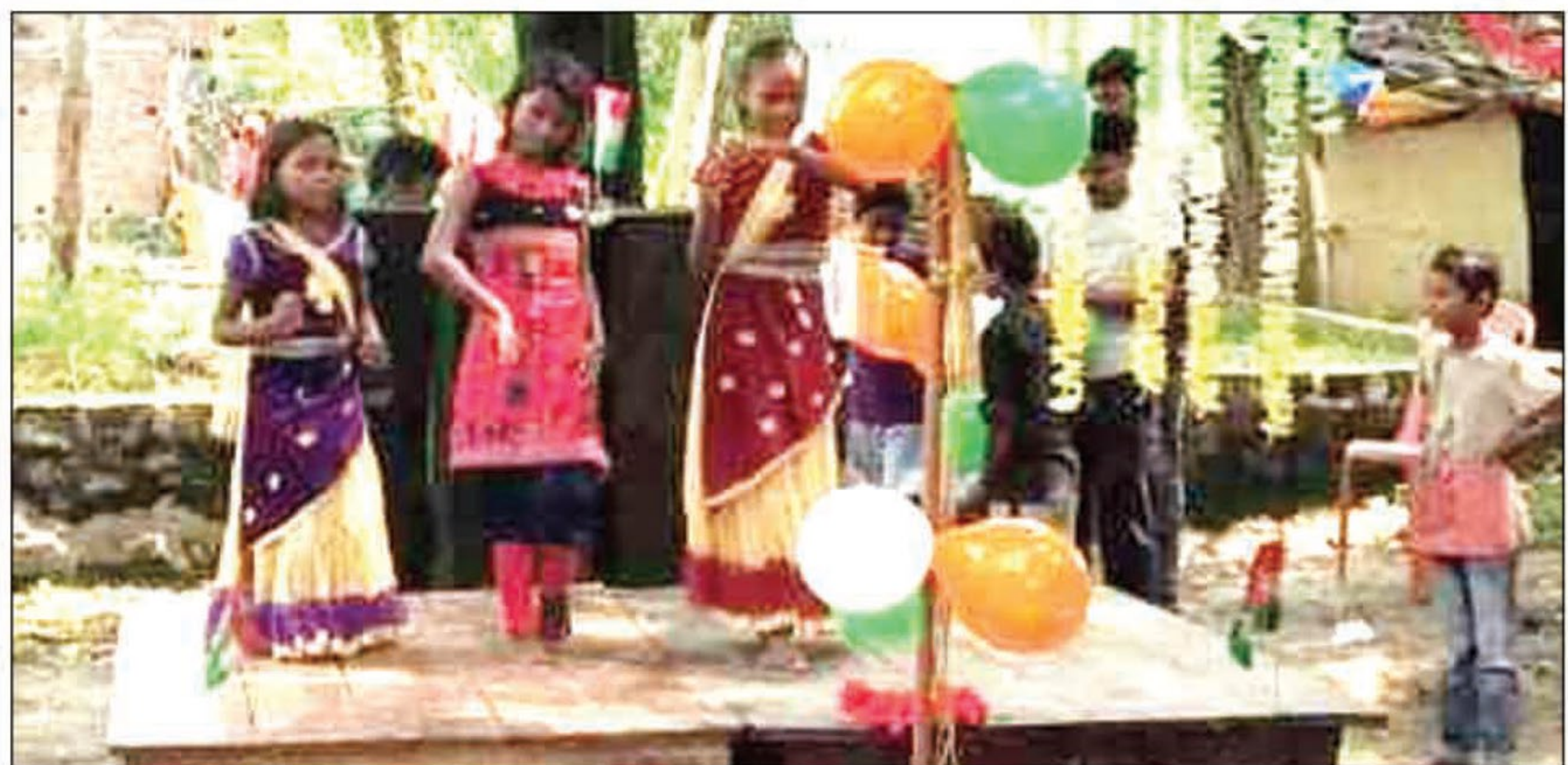
सांस्कृतिक कार्यक्रम प्रस्तुत करते बाल कलाकार