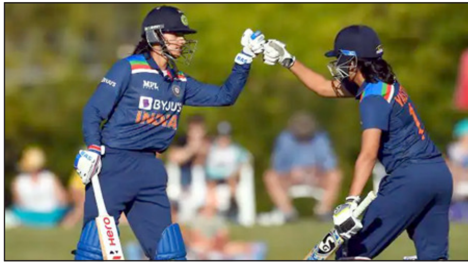
अबतक किसी भी टीम द्वारा बनाया सर्वाधिक स्कोर है।

वनडे में लगातार 25 जीत दर्ज कर चुकी मेग लेनिंग की टीम को इस मुकाम को जीतने के लिए 275 रन बनाने होंगे। ऑस्ट्रेलियाई टीम के खिलाफ खेलते हुए 2018 से लेकर