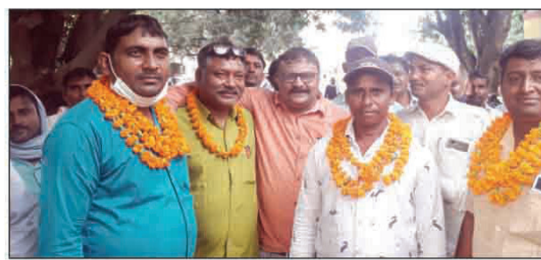
निर्वाचित पदाधिकारी व अधिकारी