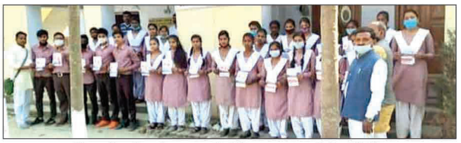
मिशन शक्ति अभियान के तहत छात्राओं को निःशुल्क पाठ्य सामग्री की गयी वितरित