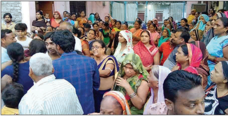
मौत के बाद रोते बिलखते परिजन

पहुंची पुलिस ने युवक के शव को कब्जे में लेकर पोस्टमार्टम के लिए भेज दिया है घटना के बाद से परिवार में कोहराम मचा हुआ है।