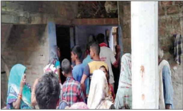
घटना के बाद वहां लगी लोगों की भीड़