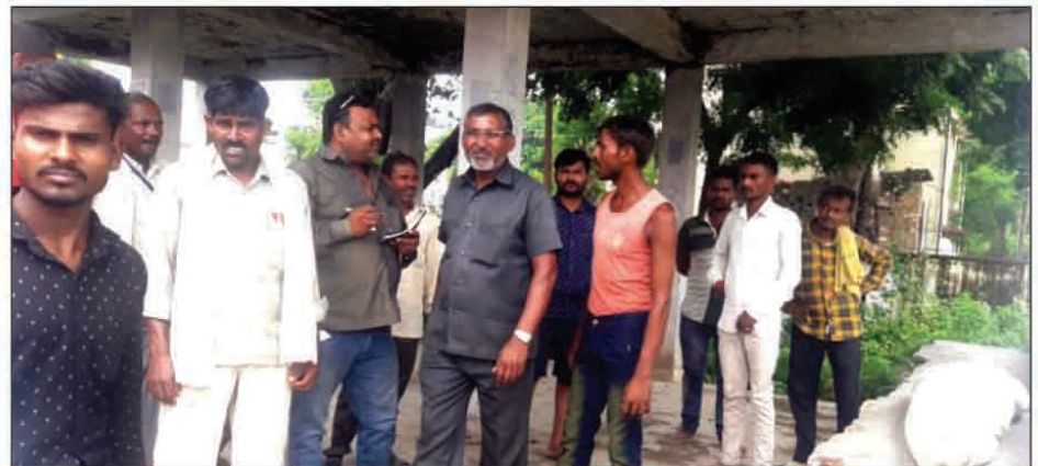
घटना स्थल पर मौजूद ग्रामीण।