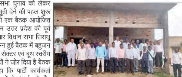
बहुजन समाज पार्टी की समीक्षा बैठक सम्पन्न