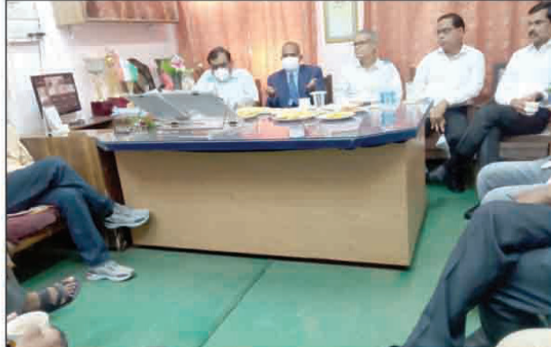
सहयोगियों की टीम गठित करते मेहता कॉलेज के निदेशक

भरवारी कौशांबी। विद्यालय प्रबंधन को और बेहतर बनाने के लिए मेहता कॉलेज के निदेशक ने टीचरों की टीम गठित कर विद्यालय के व्यवस्था को सुधारने की पहल की है उन्होंने टीचरों की टीम गठित कर विद्यालय के प्रबंधन में सुधार में सलाह मांगा है मेहता कॉलेज में यह पहली बार हुआ है और उम्मीद जताई जा रही है कि निदेशक के इस पहल से मेहता कॉलेज की व्यवस्थाओं में बेहतर सुधार होगा। नगर पालिका परिषद भरवारी अंतर्गत भव्यस मेहता विद्यालय के नवनिर्वाण प्रबंधक व निदेशक तथा प्रयागराज