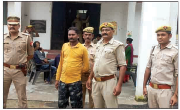
सफेद शातिर चोर पुलिस गिरफ्तार में