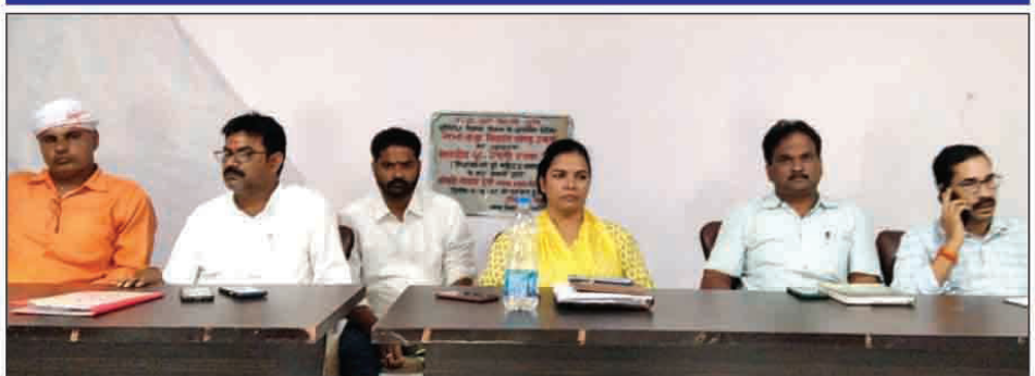
ब्लाक सभागार में बैठक करते संगठन के पदाधिकारी

मेजा रोड। अखिल भारतीय ग्राम प्रधान संगठन उरुवा ब्लाक के प्रधानों की मांग पर शुक्रवार को ब्लॉक सभागार में बैठक कर वेवजह दखल पर प्रमुख उरुवा को खुली चुनौती दी। प्रमुख उरुवा पंचायत विकास और प्रधानों के कार्य में टांग नहीं अड़ाए वरना प्रधान संगठन आंदोलन के लिए वाध्य होगा। संगठन ने ब्लॉक के अधिकारियों को भी पंचायत विकास में सहयोग करने के लिए चेतावा।