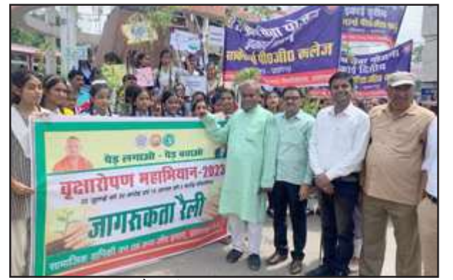
जागरूकता रैली में शामिल प्रबंधक व छात्रागण।

रैली के अन्त में छात्राओं ने मानव श्रृंखला बनाकर हरे-भरे स्वस्थ प्रतापगढ़ बनाने के लिए जनमानस को जागृत किया। वृक्ष धरा के भूषण हैं आदि नारों के उद्घोष से सम्पूर्ण वातावरण गुंजमान हो उठा। इस अवसर पर एलायंस क्लब इण्टरनेशनल