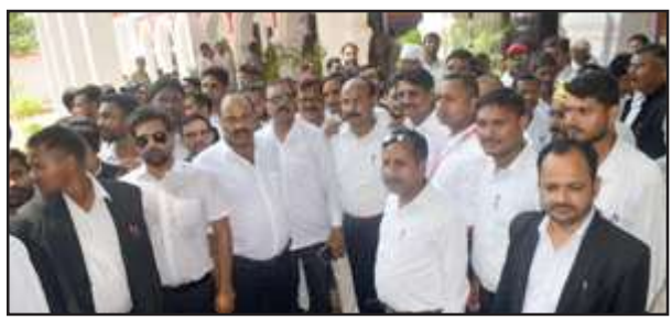
एसपी दफ्तर पर प्रदर्शन करते अधिवक्तागण।

और डाक्टरों की तरफ से आरोपी लोगों के खिलाफ रिपोर्ट दर्ज करने की मांग की। छात्रों ने कहा है कि न्याय न मिलने पर वो जिला और महिला अस्पताल की ओपीडी भी बंद कराएंगे। इसके लिए उन्होंने अस्पताल के डाक्टरों से समर्थन मांगा है। छात्रों के समर्थन में डाक्टर भी उतर पड़े हैं। वहीं दूसरे गुट के अधिवक्ताओं ने भी पीड़ित