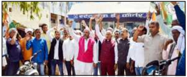
स्टेट बैंक के सामने प्रदर्शन करते कांग्रेसजन।

अडानी लूटकांड पर नारे लगा रहे थे कांग्रेसजन