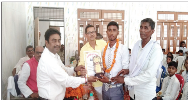
छात्रों को सम्मानित करते शिक्षक