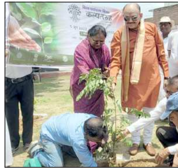
रानी लक्ष्मीबाई पार्क में वृक्षारोपण करती नगर पालिकाध्यक्षा व पूर्व विधायक