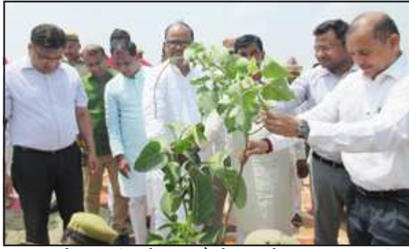
वृहद वृक्षारोपण कार्यक्रम के तहत पौधरोपण करते प्रमुख सचिव व डीएम

में सहायक है, इसलिये सभी लोगों को अधिक से अधिक वृक्ष लगाने चाहिये जिससे पर्यावरण का