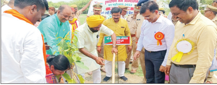
पौधे को पानी देते राज्यमंत्री

राज्यमंत्री ने पुलिस लाइन में किया पौधारोपण आमजन को भी अधिक से अधिक पौधारोपण करने के लिए किया प्रेरित, मंडलायुक्त ने कहा कि पौधे, जब पेड़ के रूप में तैयार हो जायेंगे तो यह हम सब के लिए वरदान साबित होंगे