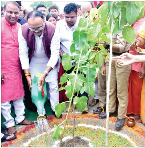
पौधरोपण करते डिप्टी सीएम बृजेश पाठक

झुसी। हम अक्सर वृक्षारोपण करते हैं लेकिन उन वृक्षों को बचाने के लिए हम क्या करते हैं हमें वृक्षों को बचाने के लिए उन्हें गोद लेना चाहिए वृक्ष को गोद लेने का मतलब अपने पुत्र पुत्री को गोद लेने जैसे है वृक्ष तभी बचेंगे जब समाज का हर वर्ग हर व्यक्ति वृक्षों को बचाने के लिए आगे आएगा। उक्त बातों मंगलावर को कनिहार झुसी स्थित आजादी के अमृत महोत्सव के अवसर पर वृहद वृक्षारोपण कार्यक्रम में बतौर मुख्य अतिथि उपमुख्यमंत्री बृजेश पाठक ने कही। उपस्थित लोगों को संबोधित करते हुए उपमुख्यमंत्री जिले के प्रभारी बृजेश पाठक ने कहा कि वृक्षारोपण का पुण्य गंगा स्नान से अधिक है। आज जो वृक्षारोपण किया गया है इसको हम लोग सुरक्षित रखेंगे समाज और पर्यावरण के लिए नया काम करेंगे। उन्होंने कहा कि मुख्यमंत्री जी के नेतृत्व में उत्तर प्रदेश एक बार फिर इतिहास रचने जा रहा है प्रदेश में कुल