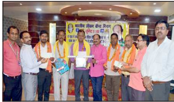
नवनियुक्त अभिकर्ताओं को सम्मानित करते अतिथिगण।