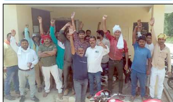
जेठवारा उपकेंद्र पर नारेबाजी करते उपभोक्ता।

उपकेंद्र से आपूर्ति 10 घण्टे भी नहीं मिल पा रही है। गमी के इस मौसम में हो रही मनमानी कटौती से उपभोक्ता आंजिज आ चले हैं। सरकार भले ही ग्रामीण क्षेत्रों में 18 घण्टे की आपूर्ति देने की बात कर रही है, पर यहां इस उपकेंद्र पर शासन व प्रशासन का कोई आदेश