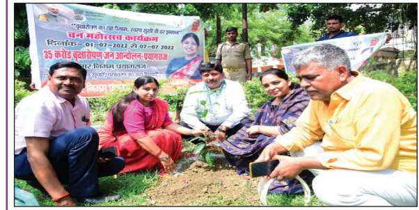
कर्मचारियों संग पौधरोपण करती महापौर