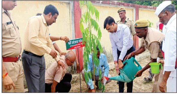
पौधारोपण करते कमिश्नर