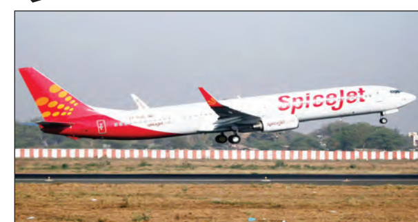
फ्यूल लीक का भी दावा: डायरेक्टोरेट जनरल ऑफ सिविल एविएशन के मुताबिक एयरक्राफ्ट के फ्यूल टैंक से लीकेज की भी

नई दिल्ली: दिल्ली से दुबई जा रहे स्पाइसजेट के विमान की मंगलवार को पाकिस्तान के कराची में इमरजेंसी लैंडिंग करानी पड़ी। फ्लाइट में मौजूद सभी पैसेंजर सेफ हैं। एयरलाइन ने अपने बयान में कहा-स्पाइसजेट बी737 की फ्लाइट नंबर एसजी-11 दिल्ली से दुबई जा रही थी। इसी दौरान विमान के इंजिन में खराबी का पता लगा। इसके बाद फ्लाइट को कराची डायवर्ट किया गया। हालांकि स्पाइसजेट ने इसे इमरजेंसी लैंडिंग नहीं माना है।