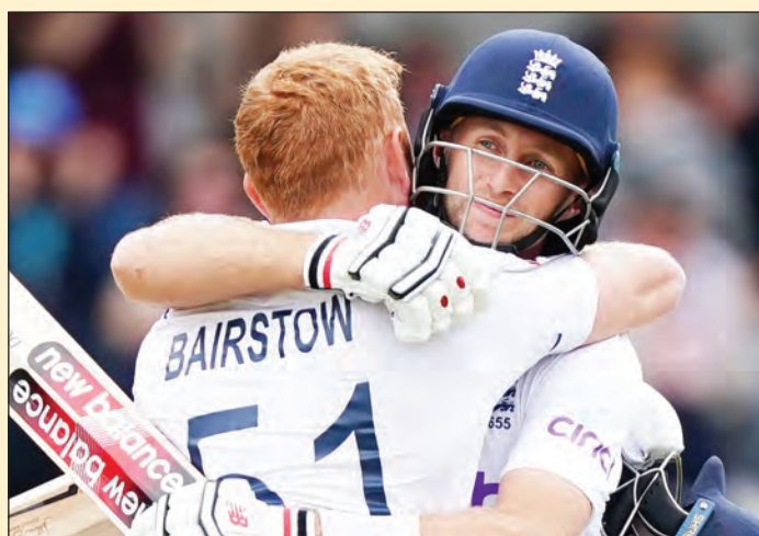
लेकिन अंपायर ने नॉट-आउट दे दिया। भारतीय खिलाड़ियों को लगा रूट आउट

दिया। बुमराह ने दो विकेट लिए, फिर भारत ने दो रिव्यू गंवा दिए: टीम इंडिया के कप्तान जसप्रीत बुमराह ने मैच के चौथे दिन इंग्लैंड के शुरूआती दोनों विकेट झटके। टी से पहले उन्होंने जैक क्रॉली को 46 रन के निजी स्कोर पर बॉलड किया। वहीं, टी के बाद पहली ही गेंद पर ओली पोप को विकेट के पीछे कैच आउट कराया। इंग्लैंड दोनों झटकों से अभी संभल भी नहीं पाया था, तभी मोहम्मद शमी के एक शानदार थ्रो ने एलेक्स लीस को रन आउट कर पवेलियन भेज दिया। इसके बाद भारत ने दो ओवर में 2 रिव्यू गंवा दिए। पहले रवींद्र जडेजा की गेंद पर जो रूट के लिए एलबीडब्ल्यू की अपील हुई,