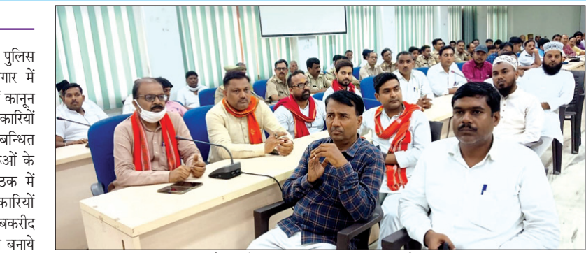
बैठक में उपस्थित आम जनमानस धर्मगुरु

कौशांबी। जिलाधिकारी सुजीत कुमार एवं पुलिस अधीक्षक हेमराज मीणा द्वारा उदयन सभागार में इंदुजुहा बकरीद काँवड़ यात्रा सावन मेला में कानून व्यवस्था बनाये रखने हेतु सभी उप जिलाधिकारियों व क्षेत्राधिकारियों सहित अन्य सम्बन्धित अधिकारियों तथा सम्भान नागरिकों धर्मगुरुओं के साथ पीस कमेटी की बैठक की गयी बैठक में जिलाधिकारी ने सभी उप जिलाधिकारियों क्षेत्राधिकारियों एवं थानाध्यक्षों से इंदुजुहा बकरीद काँवड़ यात्रा सावन मेला में कानून व्यवस्था बनाये रखने हेतु अत्यंत आवश्यकता पर विशेष सतर्कता बरती जाय तथा सम्बन्धित स्थानों पर विशेष निगरानी की जाय जिससे किसी भी प्रकार की अप्रिय घटना न होने पाये उन्हीं सभी अधिशासी अधिकारियों को अपने-अपने क्षेत्र में विशेष