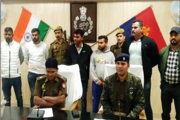
गांजा तस्करों की गिरफ्तारी की जानकारी देते पुलिस अधीक्षक

कौशाम्बी। लंबे समय से गांजा के व्यवसाय में लगे अंतर्जनपदीय गाँजा तस्करों को 22 किलो गांजा के साथ एसओजी टीम एवं मंझनपुर कोतवाली पुलिस ने गिरफ्तार किया है 22 किलो गांजा बरामद कर दो तस्करों की गिरफ्तारी के मामले की जानकारी पुलिस अधीक्षक ने दी है। गांजा कारोबार की रीढ़ तोड़ने में एसओजी और थाना पुलिस को बड़ी सफलता मिली है, मुखबिर की सूचना पर शुक्रवार को पुलिस ने घेराबंदी कर मंझनपुर कोतवाली क्षेत्र के पतौना पुल के पास से 2 गांजा तस्करों को 22 किलोग्राम