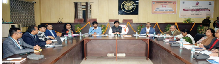
अधिकारियों के साथ बैठक करते जिलाधिकारी प्रयागराज

प्रगति खराब पाये जाने पर वहां के प्रभारी चिकित्साधिकारी से स्पष्टीकरण प्रस्तुत करने एवं पूर्ण टीकाकरण के कार्य में तेजी लाये जाने का निर्देश दिया है। जिलाधिकारी ने अभियान चलाकर वीसीजी, मिजल्स रूबेला टीकाकरण कराये जाने का निर्देश दिया है साथ ही साथ प्रभारी चिकित्साधिकारियों को ड्यू लिस्ट अपडेट रखने एवं ड्यू लिस्ट के अनुसार कार्रवाई किए जाने का निर्देश दिया है। उन्होंने परिवार नियोजन कार्यक्रम के तहत कैम्प चलाकर नसबंदी कराये जाने का निर्देश दिया है। उन्होंने मंत्रा एए, ई-कवच, आरसीएच पोर्टलों पर फीडिंग का कार्य शत-प्रतिशत रूप से कराये जाने हेतु निर्देशित किया है। जिलाधिकारी ने हेल्थ एटीएम एवं वेल्नेस सेंटर के निर्माण कार्य में तेजी लाये जाने का निर्देश दिया है। जिलाधिकारी ने सभी चिकित्साधिकारियों को