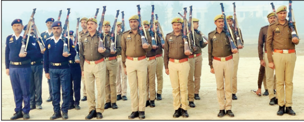
परेड की सलामी देते पुलिसकर्मी