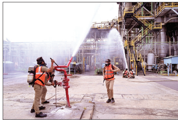
पूर्वाभ्यास में बचाव कार्य में लगे कर्मी व स्थित का जायजा लेते इफको के अधिकारी