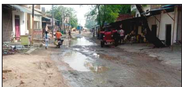
परियावां मद्रसा के सामने सड़क पर भरा पानी।

परियावां, प्रतापगढ़। एक तरफ प्रदेश की योगी सरकार प्रदेश की सड़क को गड्डा मुक्त करने के लिए पानी की तरह पैसा बहा रही है तो दूसरी तरफ लोक निर्माण विभाग के जिम्मेदार अधिकारी सरकार की सही मेहनत पर पानी फेर रहे हैं जिसका ताजा उदाहरण विधान सभा बाबागंज के निर्वाचन क्षेत्र परियावां मुस्लिम बस्ती है जहां की गड्डा युक्त सड़क अपनी बदहाली पर आंसु बहा रहा है। हल्की सी बारिश होने पर सड़क में बने गड्डे पर पानी भर जाता है जिस पर नैनिहाल बच्चे व बुजुर्ग लोग गिरकर चोटिल हो रहे हैं। इतना ही नहीं सड़क पर बने जान लेवा गड्डों से गुजर कर छात्र छात्राएं कालेज पढ़ने