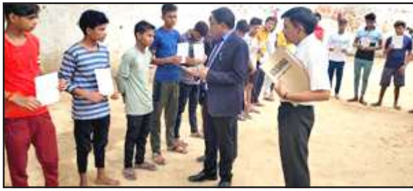
जिला कारागार का निरीक्षण करते न्यायिक अधिकारी।

सचिव द्वारा जिला कारागार में स्थित महिला बैरक, बाल चक्र, पाकशाला, जेल अस्पताल, लौगल एण्ड क्लीनिक एवं वीडियो कान्फ्रेंसिंग रूम सहित जेल परिसर की साफ-सफाई, महिला बन्दियों की तलाशी रूम का निरीक्षण किया गया। प्रत्येक बैरक में मनोरंजन के लिये टीवी0 लगी