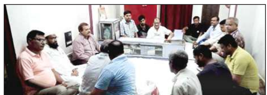
उद्योग व्यापार मण्डल की बैठक में बोलते जिलाध्यक्ष।

करने के लहजे से व्यापारियों में असंतोष है। व्यापारियों का कहना है की वे समय से बिल जमा करते हैं, लगता है जैसे व्यापारी चोर हैं। इस प्रकार के बावत जब से बात करनी चाहा तो उन्होंने फोन नहीं उठाया जेई से बात करने पर उन्होंने ने कहा लो वोल्टेज समस्या है सही अर्थ न मिलने से ऐसी समस्या आ जाती है। अब बरसात हो गयी है तो स्वतः ये समस्या दूर हो जाएगी फिर भी यदि समस्या बनी रहती है दिखवा लिया जायेगा।