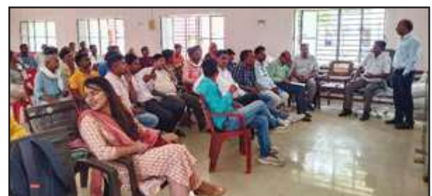
सभागार कक्ष में आयोजित प्रशिक्षण में मौजूद पंचायत सहायक व ग्राम प्रधान।

प्रशिक्षण हर जल जीवन मिशन 2024 के तहत घर घर जल योजना में पानी की पाइप लाइन द्वारा सप्लाई के लिए जल निगम द्वारा ज्यादा से ज्यादा