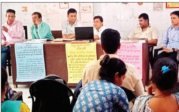
मलेरिया दिवस पर आयोजित कार्यक्रम में उपस्थित चिकित्सक