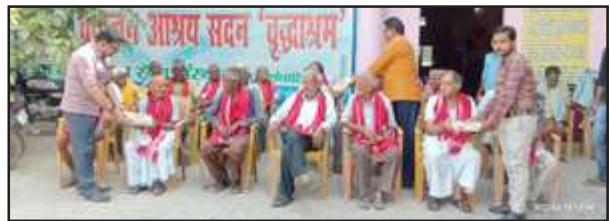
वृद्धजनों को सम्मानित करते एलायंस क्लब के पदाधिकारी।