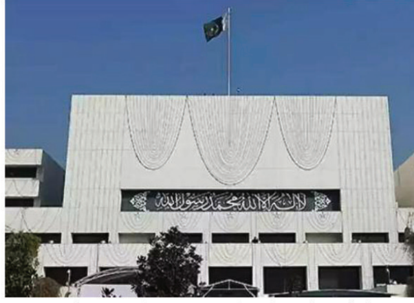
पाकिस्तान के प्रधानमंत्री शहबाज शरीफ द्वारा अपने बड़े भाई नवाज शरीफ से स्वदेश लौटने, आम चुनाव के लिए पार्टी के प्रचार

नवाज शरीफ इलाज के लिए नवंबर 2019 से लंदन में रह रहे हैं। लंदन जाने से पहले वह अल-अजीजिया भ्रष्टाचार केस में सात साल की कैद की सजा काट रहे थे। स्थानीय मीडिया रिपोर्ट में कहा गया है कि संसद ने सांसदों की अयोग्यता को पांच साल तक सीमित करने संबंधी विधेयक पारित किया है यह घटनाक्रम