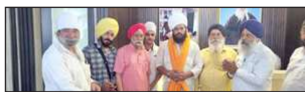
गुरुधाम यात्रा के जल्ये में मौजूद पदाधिकारीगण।