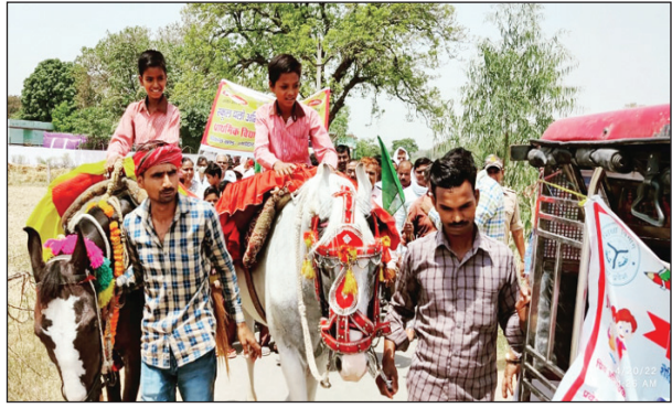
कौड़हार में घोड़े पर सवार होकर रैली निकालते छात्र।