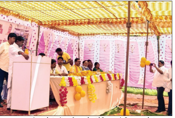
स्वास्थ्य मेला कोरांव में कार्यक्रम को संबोधित करते विधायक कोरांव

कोरांव। सरकार की मंसानुसार आजादी के अमृत महोत्सव मनाए जाने के क्रम में स्वास्थ्य विभाग द्वारा जिला स्वास्थ्य समिति के सौजन्य से आयोजित सीएचसी कोरांव में बीस अप्रैल को विशाल कैम्प लगा, जिसमें स्वास्थ्य देखभाल सेवाएं, योग और ध्यान, निःशुल्क जांच, निःशुल्क दवा वितरण, टेली कॉन्सल्टेशन, मुख रोग, मौतिया बिंद, मधुमेह, रक्त चाप, स्वास्थ्य आइडी, आवुष्मान भारत कार्ड, आदि सुविधा सेवाएं प्रदान की गईं। जिसमें समस्त विभाग के अधिकारियों ने अपने अपने विभाग के कल्याणकारी योजनाओं के बारे में जानकारी दी।