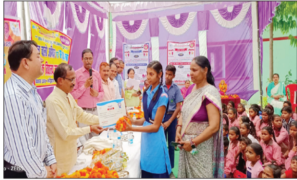
कौड़हार में मेधावी छात्र को सम्मानित करते फाफामऊ विधायक।