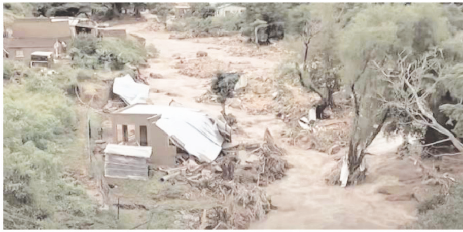
रामफोसा ने जलवायु परिवर्तन को जिम्मेदार ठहराया है।

क्राजुलु-नेटल। दक्षिण अफ्रीकी राष्ट्रपति सिरिल रामफोसा ने देश में भीषण बाढ़ के प्रकोप के चलते राष्ट्रीय आपदा की स्थिति और इससे निपटने के लिए कई उपायों की घोषणा की है। बाढ़ के कारण तटीय प्रांत क्राजुलु-नेटल प्रांत (केजेडएन) में 400 से अधिक लोगों की मौत हो गई है और कई लोग लापता हैं। जानकारी के मुताबिक देश में 40,000 से अधिक लोग बेघर भी हुए हैं। कोविड-19 के चलते पिछले दो साल से देश में लगे प्रतिबंधों को हटाने के एक पखवाड़े बाद ही रामफोसा ने राष्ट्रीय आपदा स्थिति की घोषणा की है। चार दिन से जारी भीषण बारिश और बाढ़ के लिए