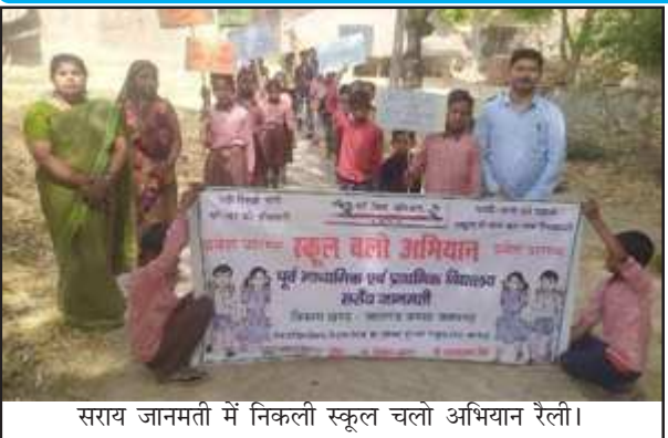
सराय जानमती में निकली स्कूल चलो अभियान रैली।