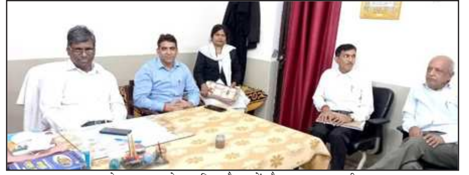
लोक अदालत से सम्बन्धित बैठक में मौजूद प्रधान न्यायाधीश।