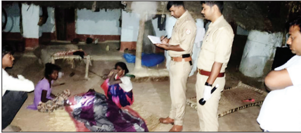
वृद्ध महिला की हत्या के बाद घटनास्थल पर जांच करती पुलिस

सनकी युवक ने किया बुजुर्ग महिला की हत्या, क्षेत्र में मची सनसनी