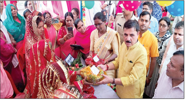
स्वास्थ्य मेले का शुभारंभ करते सांसद

कौशाम्बी। सरकार के निर्देशानुसार जनपद के सभी ब्लॉक स्तरीय स्वास्थ्य इकाईयों में स्वास्थ्य मेले का आयोजन दिनांक 18 अप्रैल से 23 अप्रैल तक किया जा रहा है सांसद विनोद सोनकर ने सामुदायिक स्वास्थ्य केन्द्र आलमचन्द्र में आयोजित स्वास्थ्य मेले का गांव की ही उपस्थित बुजुर्ग महिला को सम्मान देते हुए बुजुर्ग महिला से फीता कटवाकर शुभारम्भ करवाया। इसी प्रकार विकास खण्ड परिसर कड़ा में आयोजित स्वास्थ्य मेले का गांव के ही उपस्थित बालिका को सम्मान देते हुए बालिका से ही फीता कटवाकर शुभारम्भ करवाया। सांसदों द्वारा स्वास्थ्य विभाग व अन्य विभागों द्वारा विभागीय योजनाओं से सम्बन्धित लगाई गयी स्टालों का अवलोकन किया तथा गर्भवती महिलाओं को पोषण पोस्टरों देकर पोषण युक्त खान-पान की जानकारी दी। सांसद ने कार्यक्रम को सम्बोधित करते हुए कहा कि उ0प्र0 सरकार के निर्देशानुसार प्रदेश के सभी ब्लॉक स्तरीय स्वास्थ्य इकाईयों में स्वास्थ्य मेले का आयोजन 18