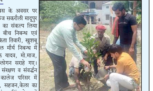
पौधरोपण करते एलायंस क्लब के पदाधिकारी।