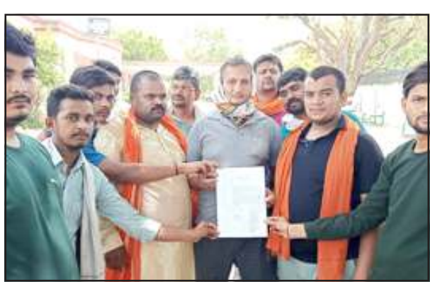
डीएम को ज्ञापन देने जाते व्यापारी।