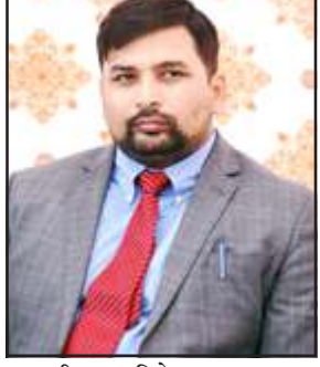
डीएम अभिषेक आनन्द।

उन्होंने विभिन्न विभागों से समुचित व्यवस्था करने के निर्देश