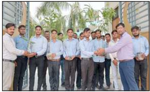
छात्रों को पौधरोपण के लिये पौधा देते शिक्षकगण।