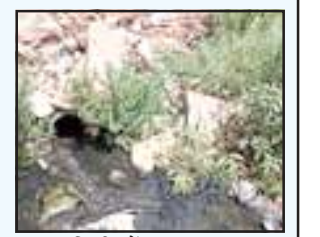
मन्दाकिनी में बहता नाला।