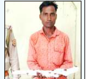
पुलिस गिरफ्त में आरोपी।

चित्रकूट। जीवनदायिनी मंदाकिनी नदी में होटल, लाज, मठ-मंदिर, धर्मशाळा व रिहायसी घरों से निकला मल- मूत्र नदी में जा रहा है। अवसरवादी लोग सफाई के नाम पर फोटो खिंचाकर सोशल मीडिया डालकर शोहरत हासिल कर रहे हैं। मंदाकिनी नदी कुछ दिनों में आचमन लायक नहीं बचेगी। बुधवार को मन्दाकिनी नदी में चूड़ों में खड़े होकर लोग फोटो खिंचते हैं। सफाई का ढोंग करते हैं। मन्दाकिनी में दो दर्जन से अधिक गंदे नालों का सीवर बहता है। प्रदूषण की चपेट से मंदाकिनी कराह रही है। शर्म की बात है कि सफाई के नाम पर फोटो खिंचने के बाद लोग दिखाई नहीं देते। लोगों को भरोसा होता है कि जल्द नदी स्वच्छ-निर्मल होने वाली है। ऐसे लोगों को मंदाकिनी में गिरने वाले नाले दिखाई नहीं देते। मंदाकिनी मल-मूत्र की बदबू से कराह रही है। यही हाल रहा तो 10-15 साल में मन्दाकिनी का अस्तित्व खत्म हो जायेगा। मंदाकिनी नदी प्रदूषण के प्रति लोगों को जरा सी भी चिन्ता है तो मन्दाकिनी में गिरने वाले नालों को बन्द कराने को अभियान चलायें।