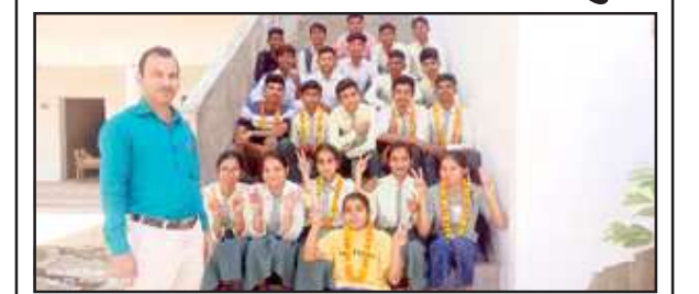
सम्मान पाकर खिले मेधावियों के चेहरे।