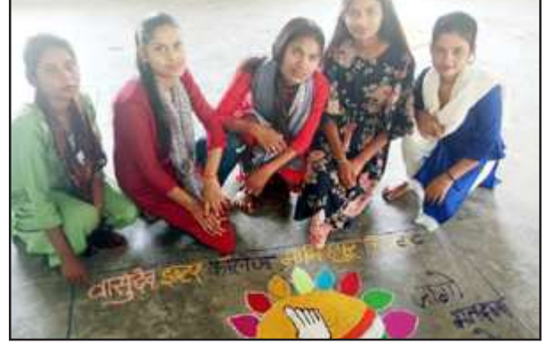
रंगोली प्रतियोगिता से मतदाताओं को जागरूक करती छात्रायें।