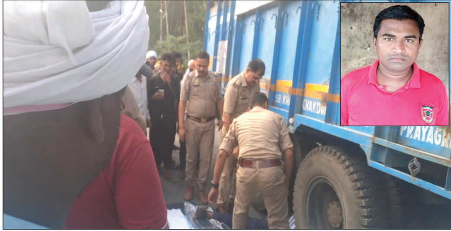
अखंड भारत संदेश

झुंसी। वाराणसी प्रयागराज मार्ग पर सिलेंडर लदी ट्रक की चपेट में आने से बाइक सवार युवक की दर्दनाक मौत हो गई। ट्रक में फंस कर युवक कुछ दूर तक घिसटते हुए चला गया। शरीर का आधा हिस्सा सड़क में चिपक गया कालेजा निकल कर बाहर आ गया। वही चालक ट्रक छोड़ कर फरार हो गया।