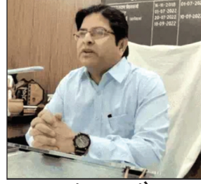
अखंड भारत संदेश

मृत शिक्षक की सर्विस निधि के हेराफेरी का मामला, शिक्षक के पिता ने दी तहरीर