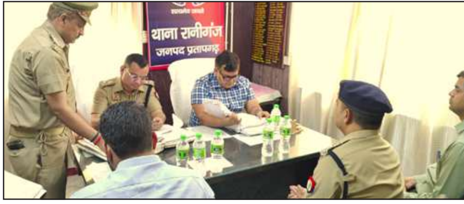
थाना रानीगंज का निरीक्षण करते जिलाधिकारी व पुलिस अधीक्षक।

प्रतापगढ़। लोकसभा सामान्य निर्वाचन-2024 को निष्पक्ष, शान्तिपूर्ण, पारदर्शी एवं सुकुशल ढंग से सम्पन्न कराने हेतु जिलाधिकारी/जिला निर्वाचन अधिकारी संजीव रंजन, पुलिस अधीक्षक सतपाल अंतिल एवं मुख्य विकास अधिकारी नवमीत सेहारा ने थाना रानीगंज का निरीक्षण किया। थाना रानीगंज में डीएम एवं एसपी ने उपजिलाधिकारी रानीगंज, सीओ रानीगंज से अति संवेदनशील बूथों पर होनी वाली घटनाओं व निर्वाचन के दृष्टिगत अब तक की गयी तैयारियों के सम्बन्ध में जानकारी प्राप्त की। निरीक्षण के दौरान गुण्डा एक्ट रजिस्टर, अपराध रजिस्टर, हिस्ट्रीशीटर रजिस्टर, लोकसभा चुनाव रजिस्टर आदि का अवलोकन किया एवं की गयी कार्यवाहियों के सम्बन्ध में जानकारी ली।