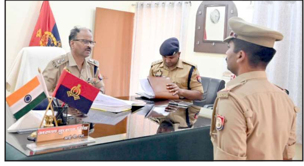
पुलिस लाइन में अर्दली रूम करते एसपी।