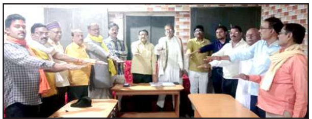
मतदाता जागरूकता अभियान के तहत शपथ दिलाते पदाधिकारी।