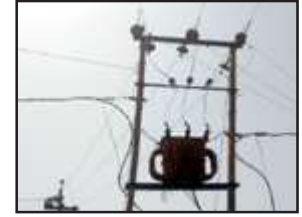
महोखरी गांव का जला विद्युत ट्रांसफार्मर।

पट्टी, प्रतापगढ़। तहसील क्षेत्र के महोखरी गांव की विद्युतापूर्ति विद्युत उपकेंद्र उड़ैयाडीह से की जाती है। महोखरी गांव में दो दिन पूर्व विद्युत ट्रांसफार्मर धू धू कर जल गया, जिससे सैकड़ों घरों की बत्ती गुल हो गई। जिसकी सूचना ग्रामीणों ने विद्युत कर्मियों को दी। लेकिन न तो ट्रांसफार्मर बदला गया न ही कोई कर्मचारी आए। बता दें की दो दिन पूर्व अचानक ट्रांसफार्मर में आग लग जाने की वजह से ट्रांसफार्मर जल गया। जिससे सैकड़ों घरों की विद्युत सप्लाई बंद हो गई। वही भीषण गर्मी में लाइट न होने की वजह से ग्रामीण काफी हैरान परेशान हो रहे हैं। और मच्छरों का भी प्रकोप बढ़ गया है, जिससे ग्रामीणों का दिन का चैन और रात की नींद हराता हो गयी है। ग्रामीणों का आरोप है कि ट्रांसफार्मर जलने