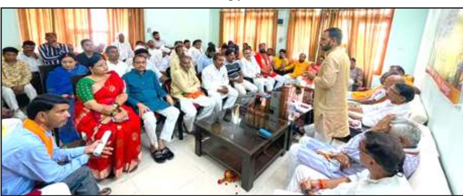
बजट गोष्ठी में बोलते जिला प्रभारी।