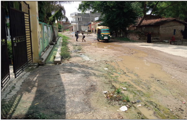
खस्ताहाल गड्डों में तब्दील सहसों बगई संपर्क मार्ग।