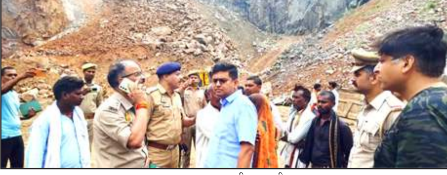
घटना स्थल पर डीएम-एसपी।