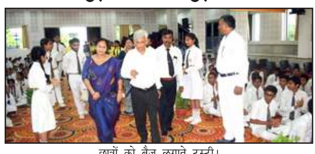
छात्रों को बैज लगाते ट्यूटोर।