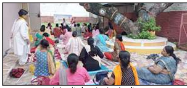
शिविर में योग सीखती महिलायें।

नहीं है। पत्नी व छानी-छप्पर से परिवार समेत जीवनयापन कर रहा है। ऑनलाइन के नाम पर हजारों रुपये खर्च किये हैं। आज तक आवास नहीं मिला। गरीब होने से प्रधान समेत अन्य अधिकारियों को सुविधा शुक के न देने से उसे आवास नहीं मिला। गांव में अपाणों को सुविधा शुक लेकर आवास दिये गये हैं।