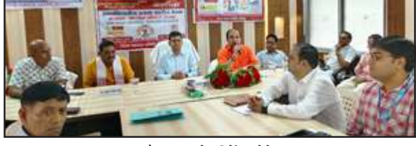
समीक्षा बैठक करते निर्देश देते डीएम।