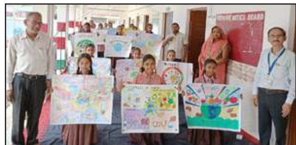
चित्रकला प्रतियोगिता के बीच बच्चे व शिक्षकगण।

प्रतापगढ़। मॉडल उच्च प्राथमिक विद्यालय कटरा गुलाब सिंह में बच्चों के समग्र विकास के लिए कक्षा कक्ष से परे पोषण संबंधी कार्य के अंतर्गत बच्चों को कुपोषण से बचने के लिए पोषण के प्रति चित्रकला प्रतियोगिता कराकर जागरूक किया गया। इस प्रतियोगिता में कई बच्चों ने प्रतिभाग किया। बच्चों ने एक से बढ़कर एक पोषक तत्व का चित्र बनाया। बच्चों का मूल्यांकन कार्य करना शिक्षकों के लिए बहुत ही कठिन कार्य था। बच्चों ने संतुलित