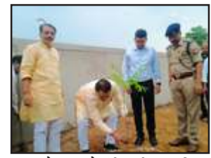
वृक्षारोपण करते मंत्री व डीएम आदि।