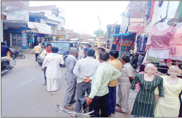
नाले में शव मिलने की जानकारी पर मौके पर लगी ग्रामीणों की भीड़

विवाहिता की हत्या के आरोप में जेल के सलाखों में बंद है युवक का भाई