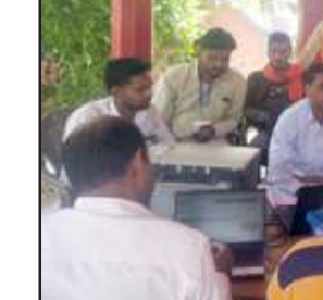
मां भवानी द्वार मिश्रपुर में लगे कैम्प में जुटी भीड़।

विद्युत विभाग कैम्प में दो लाख की हुई वसूली