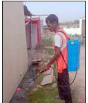
नालियों में दवा का छिड़काव करते सफाई कर्मी।