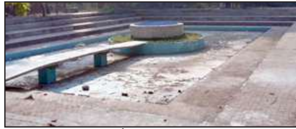
ब्लॉक परिसर में सूखा पड़ा मॉडल तालाब।

तालाब पिछले वर्ष से ही बूंद-बूंद पानी के लिए तरस रहा है। सौंदरीकरण के चक्कर में न तो अब तक विकास कार्य को पूर्ण किया जा सका है और न ही पानी भरवाया गया। इस हाल में पशु-पक्षी अपनी-दर तक बुझाने के लिए दर-दर भटक रहे हैं। वहीं जिम्मेदार भी शासन व प्रशासन के आदेशों को अनदेखा कर बैठे