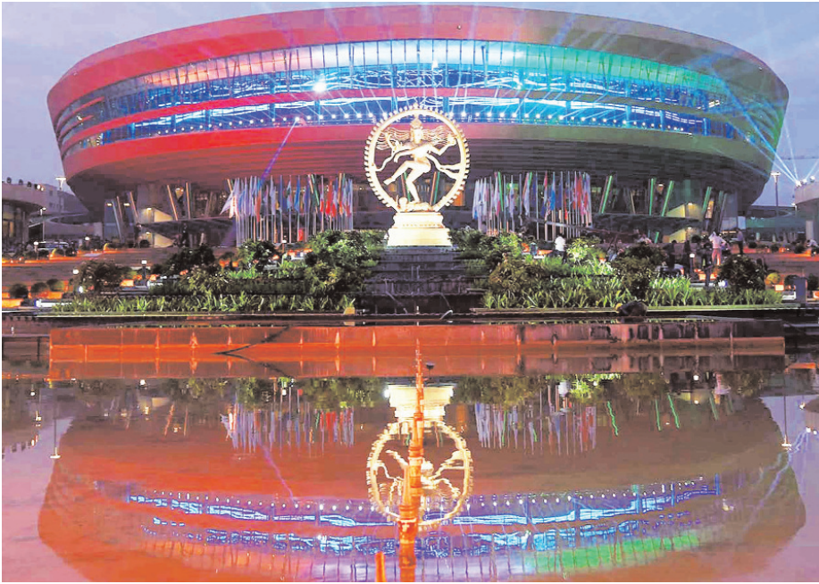
आगामी जी20 शिखर सम्मेलन से पहले प्रगति मैदान में भारत मंडप में रोशनी से चकाचौंध की झलक।

नई दिल्ली: केन्द्रीय कृषि एवं किसान कल्याण मंत्री नरेन्द्र सिंह तोमर ने कहा कि भारत के लिए जी-20 का आयोजन गौरव की बात है। इस आयोजन से देश में खुशी की लहर है। हम सभी भारतीय जी-20 के नेताओं का स्वागत करते हैं। तोमर ने गुरुवार को मीडिया से बातचीत के दौरान कहा कि जी-20 की अध्यक्षता हर भारतीय के लिए गौरव का विषय है। हमारे देश की साख दुनिया में बढ़ रही है।