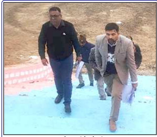
तालाब के कार्य देखते डीएम।