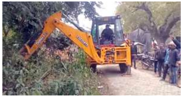
हाईवे पर बुल्डोजर से अवैध कब्जा हटाते नगर पालिका कर्मों।

खराब मौसम के कारण हेलीकाप्टर नहीं उड़ सका और उन्होंने फोन पर इस पर खेद जताया। खास बात यह थी कि खराब मौसम की वजह से बहुत सारे लोग दोपहर में ही पूर्व मंत्री के आवास पर पहुंच गये थे। मंत्रियों और नेताओं के जमावट को देखते हुए प्रशासन भी एलर्ट रहा। बड़ी संख्या में पुलिस शहर की मुख्य सड़कों, चौराहों व मोती सिंह के घर के पास चौकसी रही।