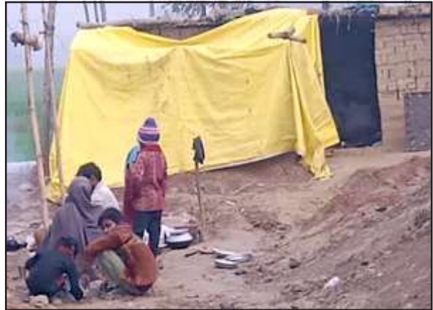
खुले आसमान के नीचे ईंट भट्टा मजदूर का परिवार।

कुछ ऐसी ही परिस्थितियों के बीच समय बीता रहे ईंट भट्टा मजदूरों की एक फोटो कई दिनों से खूब वायरल हो रही है जिसे लोग बभनपुर ईंट भट्टे की बता रहे हैं। जहां प्रवासी मजदूर अपनी बेबसी भरी जिंदगी पत्नी व मासूम बच्चों के साथ नीले अम्बर की ही अपना बिछौना मान लिया है और उसी के