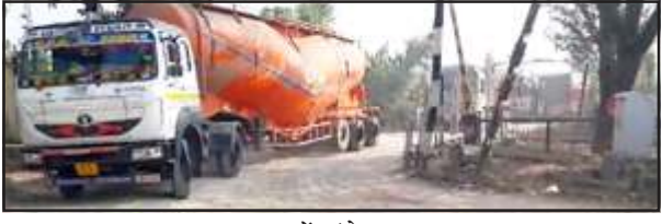
जाम में फंसे ट्रेक।

मानिकपुर/चित्रकूट। इंजन का प्रेशर कम होने से घंटों फाटक के बीच-बीच मालगाड़ी खड़ी रही। इससे लोगों को आवागमन में भारी परेशानी उठानी पड़ी। रविवार को मालगाड़ी के ब्रेक-शू जाम होने से ट्रेन के लोको पायलट ने मालगाड़ी को रेलवे क्रॉसिंग के बीच में ही रोक दिया। एक ओर रेल यातायात बाधित रहा, दूसरी ओर इटवां डुईला मानिकपुर सड़क मार्ग के टिकरिया रेलवे फाटक