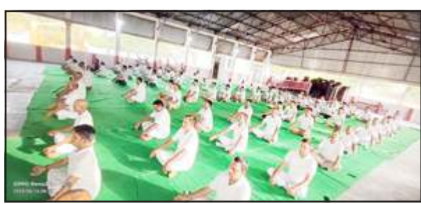
पुलिस लाइन सभागार में योग करते अधिकारी व कर्मचारीगण।

प्रतापगढ़। पुलिस अधीक्षक सतपाल अंतिल के निदेशन में पुलिस कर्मियों के स्वास्थ्य व शारीरिक/मानसिक तनाव को दूर करने के दृष्टिगत रविवार को पुलिस लाइन्स स्थित सभागार में आर0आर0. की उपस्थिति में योग शिविर का आयोजन किया गया। इस दौरान पुलिस लाइन्स सभागार में मौजूद पुलिस अधिकारी/कर्मचारीगण द्वारा योगा किया गया। इस दौरान योग के बारे में विस्तृत जानकारी दी गई और लोगों से अधिक से अधिक योग दिवस पर योग करने की सलाह दी गई। बता दें कि 15 से 21 जून तक योग सप्ताह चल रहा है। 21 जून को विश्व योग दिवस पर ये पुलिस वाले भी मुख्य कार्यक्रम में भाग लेंगे हैं। पुलिस अधीक्षक सतपाल