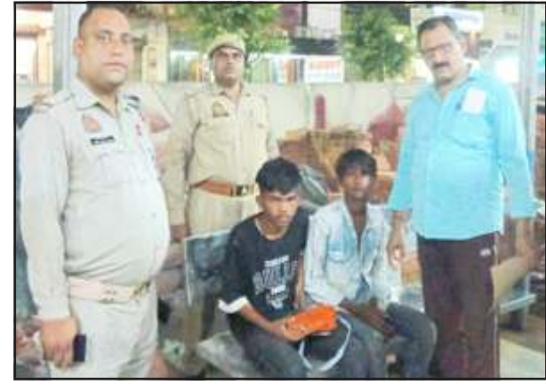
पुलिस गिरफ्त में लुटेरे।