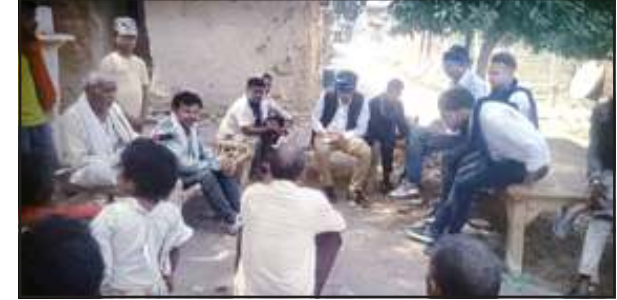
परिजनों से भेंट करते आभास महासंघ के जिलाध्यक्ष आदि।

चित्रकूट। रैपुरा थाने में 11 जून को हनुमानगंज लौरी में आदिवासी युवक को गांव के ही जातिवादी मानसिकता से ग्रस्त दबंगों ने पीट-पीटकर हत्या कर गांव के बाहर खेत में फेंक दिया था। ग्रामीणों की मदद से 12 जून को उसे जिला अस्पताल में भर्ती कराया था। हालत गम्भीर होने पर प्रयागराज रेफर हुआ था, वहां उसकी मौत होने से गुस्साये लोगों ने इलाहाबाद-झांसी