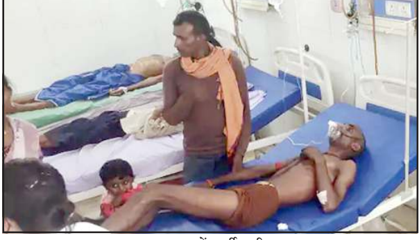
अस्पताल में भर्ती मरीज।