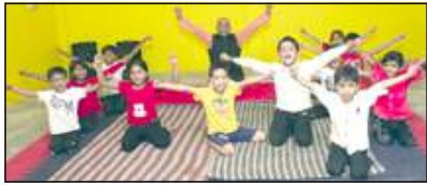
समर कैम्प में मार्शल आर्ट का प्रशिक्षण लेते बच्चे।

प्रतापगढ़। वर्ल्ड ऑफ वुमेन एजुकेशन, अमेटी रोड, चैरा में 11 दिवसीय समर कैम्प का समापन एवं फादर्स-डे बड़े धूम-धाम से मनाया गया। विगत 11 दिनों से बच्चों ने तलवारीबाजी, योगा, डांस, मार्शल आर्ट, सेल्फ डिफेंस, पोर्टी, स्केचिंग, ड्राइंग इत्यादि विभिन्न कौशलों का प्रशिक्षण लिया जिससे समापन के दिन प्रदर्शित किया गया। समर कैम्प का प्रारंभ 05 जून को पर्यावरण दिवस के दिन वृक्षारोपण के साथ किया गया। बच्चों ने अपने गमलों को रंग कर सजाया और छोटे-छोटे पौधे लगकार ये