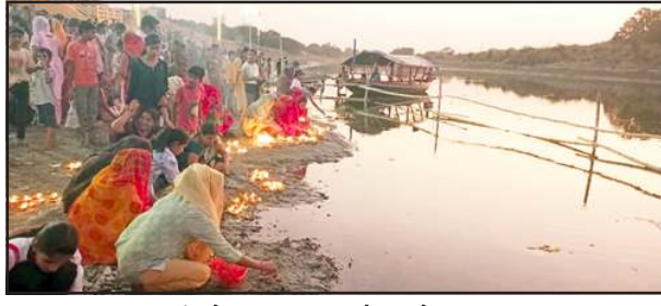
दीपों से जगमग हुआ बेल्हा देवी घाट।