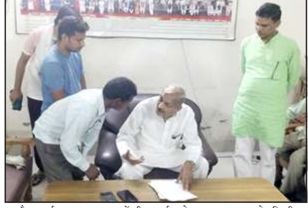
कैम्प कार्यालय पर जनसमस्याओं की सुनवाई करते राज्यसभा सदस्य प्रमोद तिवारी।

लालगंज, प्रतापगढ़। राज्यसभा में विपक्ष के उपनेता प्रमोद तिवारी ने प्रदेश में पावर कारपोरेशन के द्वारा ग्रामीण क्षेत्र के उपभोक्ताओं के लिए बिजली आपूर्ति की दरों में दो रूपये प्रति यूनिट की वृद्धि के मसौदे को जनता पर मंहगाई की एक और असहनीय सरकारी वार करार दिया है। उन्होंने कहा कि इस समय भीषण गर्मी तथा लू के चलते प्रदेश की जनता बिजली आपूर्ति में खामियों के कारण त्राहि त्राहि कर रही है। उन्होंने तंज कसा