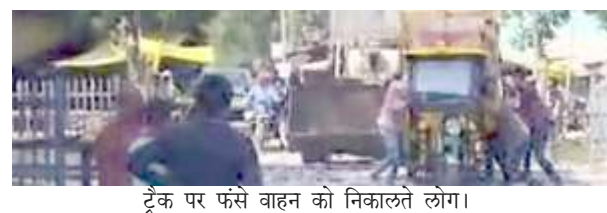
ट्रेक पर फंसे वाहन को निकालते लोग।

परियावां, प्रतापगढ़। प्रयागराज लखनऊ रेलवे ट्रेक के परियावां कालाकोर रेलवे स्टेशन के पश्चिम छोर 35 सी रेलवे फाटक पर रेल पटरों बदलने के दौरान बड़े बड़े बोल्टर डाल दिये गये हैं जिससे छोटे तीन पहिया के ऑटो रिक्शा ट्रेक के बीचो बीच निकलने समय फंस जाते हैं बुधवार की दोपहर रेलवे ट्रेक पर तीन पहिया ऑटो माल लक्षा होने के कारण रेलवे ट्रेक के बीच में बोल्टर गिट्टी के बीच फस गया संयोग अच्छा था कि कोई ट्रेन नहीं थी। रेलवे ट्रेक के बीच में फसे वाहन को जेसीबी से धक्का देकर निकाला गया लगभग एक महीने से