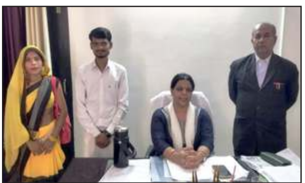
दम्पति के बीच हुआ समझौता।