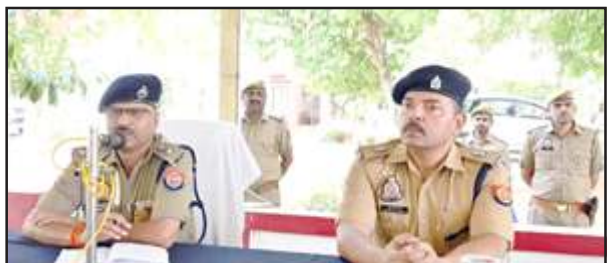
चुनाव ड्यूटी में जाने वाले पुलिस कर्मियों को निर्देश देते एसपी।

बुधवार को पुलिस अधीक्षक ने लगाये पुलिस बल को यात्रा व मतदान दौरान बरती जाने वाली सावधानियों की बाबत हिदायत दी। निर्देश दिये कि लोकसभा चुनाव अंतिम चरण में हैं। जिस तरह से अभी तक सावधानी से चुनाव सम्पन्न कराये हैं। ठीक उसी तरह से सतर्क व संवेदनशील रहकर चुनाव ड्यूटी करें। ये एक महत्वपूर्ण ड्यूटी है। लोकतंत्र के महापर्व में अपना योगदान