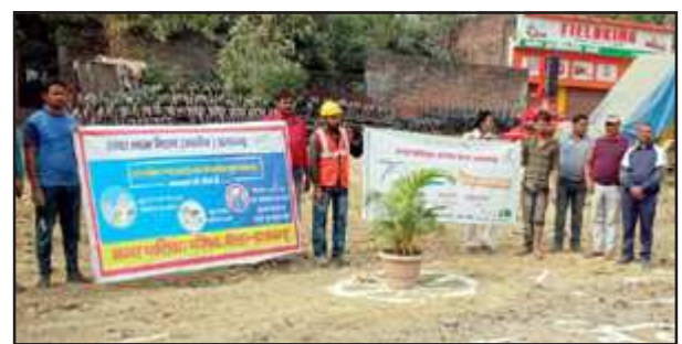
सफाई स्थल पर गमला रखकर सफाई का संदेश देते नगर पालिका कर्मी।

इसके लिये नगर पालिका ने आठ-आठ घंटे की ड्यूटी लगाकर नगर पालिका के सफाई कर्मियों से दिन रात कार्य कराकर इस अभियान में तीन स्थानों पर कूड़ा मुक्त करने में सफलता पाई। यह जानकारी देते हुए नगर पालिका