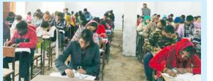
एमडीपीजी कालेज में इग्नू की परीक्षा देते परीक्षार्थी।