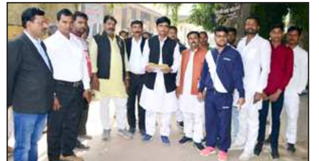
जिलाधिकारी को ज्ञापन देने जाते पूर्व ब्लाक प्रमुख व ग्रामीण।

बताया जाता है कि नगर पालिका के सीमा विस्तार में प्रार्थीगणों के गाँव नगर पालिका क्षेत्र में शामिल थे और ग्रामीणों के मृत्यु व जन्म प्रमा पत्र बनते रहे और उक्त ग्राम प्रधान का चुनाव नहीं कराया गया। ऐसे प्रार्थीगणों को नगर पालिका में सम्मिलित किया जाए क्योंकि वह अब न तो ग्राम सभा